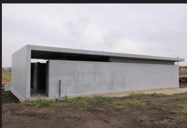
屋外トイレ・倉庫 外観

子どもの「学び」や「育ち」の連続性を保証した小中一貫教育を推進する小山市に令和4年4月に新設。地域の防災拠点としての役割を踏まえた防災機能を確保している。体育館には、各種手すりや背もたれを備え利用者の快適性に配慮した車椅子使用者優先トイレも設置している。