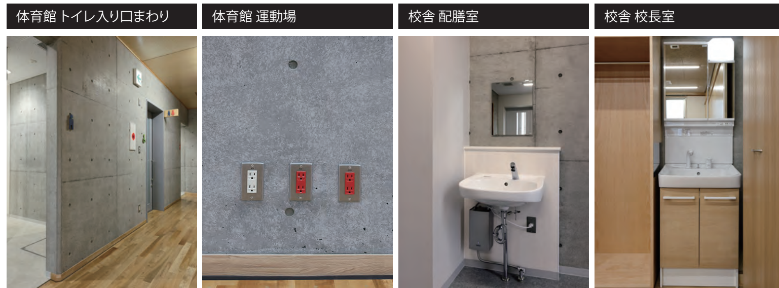
立体的なトイレサインがアクセントになった入り口まわり。 停電時には太陽光発電の電気を使える非常用コンセントを設置。 必要ときだけ必要な水温まで瞬間的に加温する加温自動水栓を採用。 快適・エコな洗面化粧台を設置。背の高いものも収納できる扉タイプ。