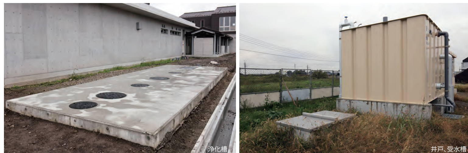
災害時の下水道不通や断水を想定し、屋外には体育館トイレからの汚水を一時貯留できる浄化槽や、トイレ洗浄水用の井戸と受水槽も設置している。