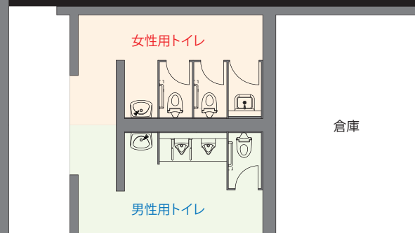
屋外トイレ 平面図