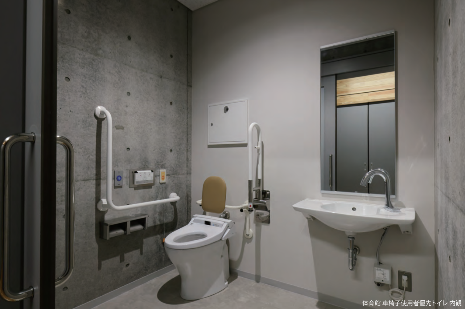
体育館 車椅子使用者優先トイレ 内観