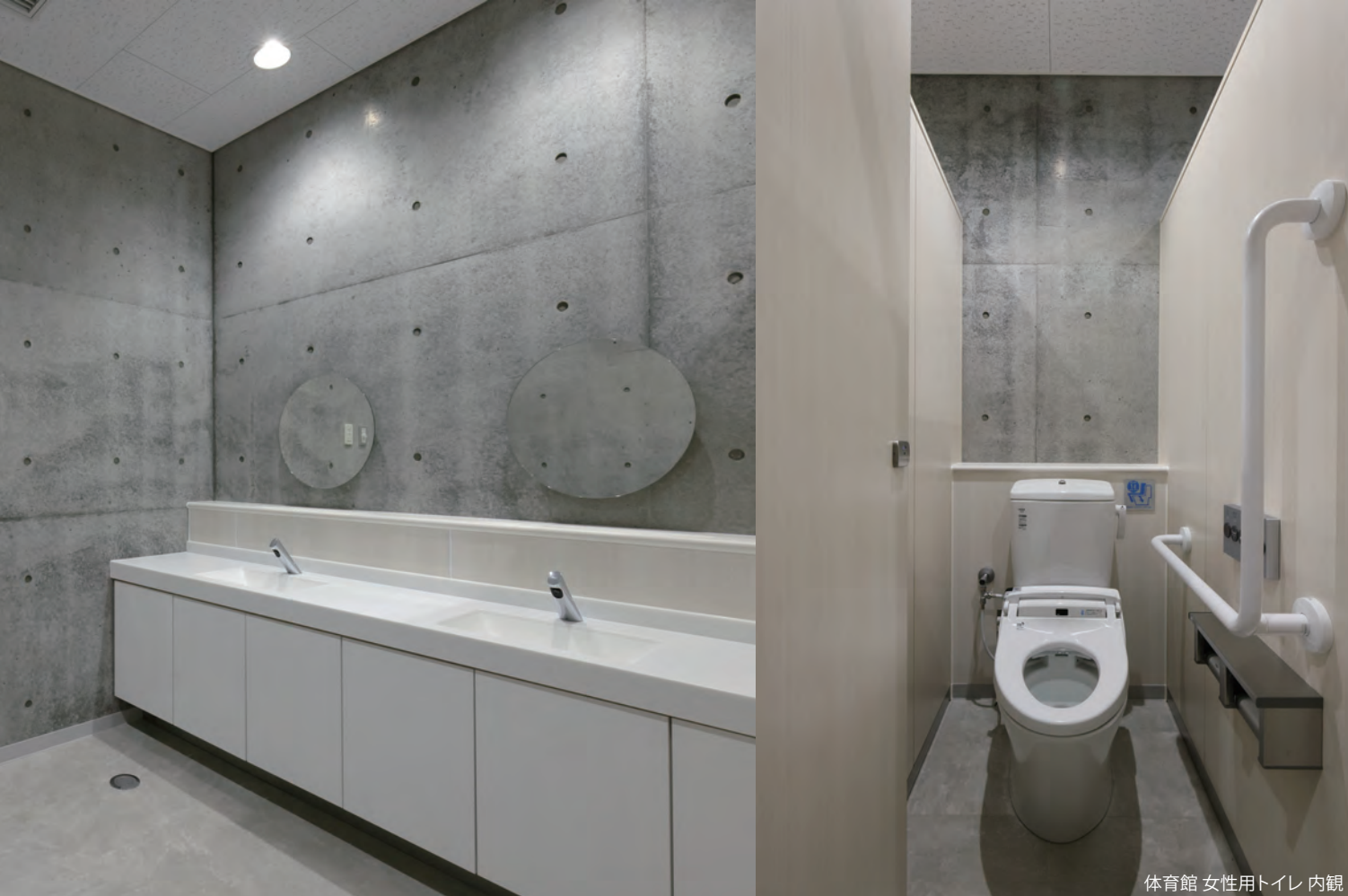
体育館 女性用トイレ 内観