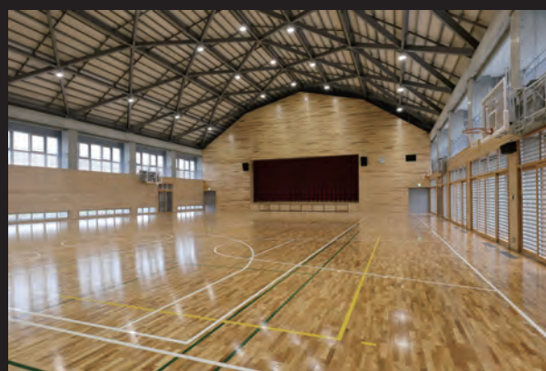
体育館 運動場 内観

子どもの「学び」や「育ち」の連続性を保証した小中一貫教育を推進する小山市に令和4年4月に新設。地域の防災拠点としての役割を踏まえた防災機能を確保し、体育館には洗浄水量の切り替えで断水時にも使い慣れたトイレを使用できる「レジリエンストイレ」を設置している。