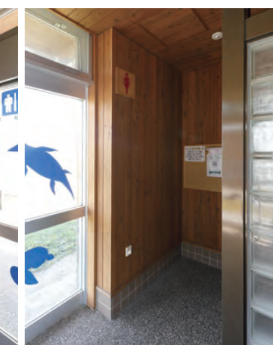
女性用トイレ入り口