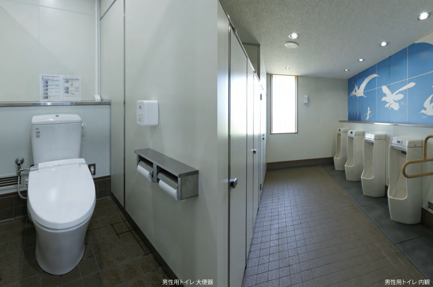
男性用トイレ 大便器