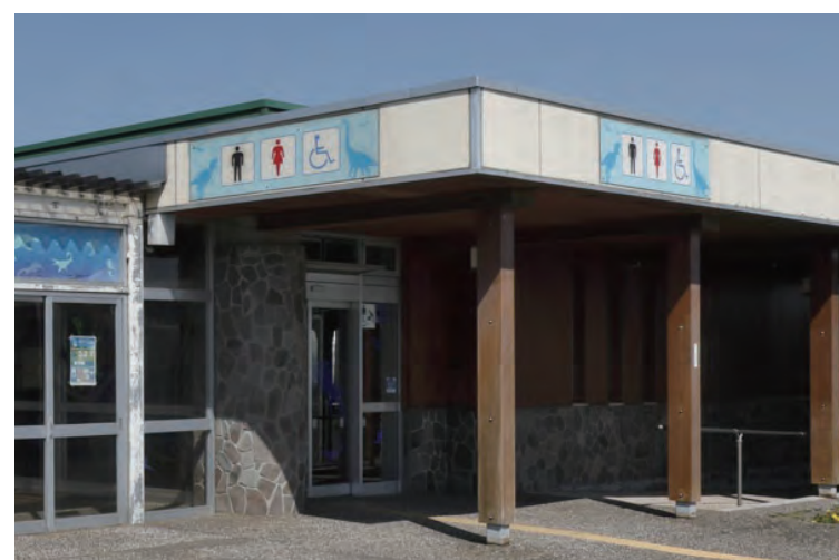
屋外トイレサイン