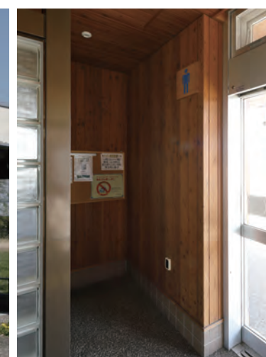
男性用トイレ入り口