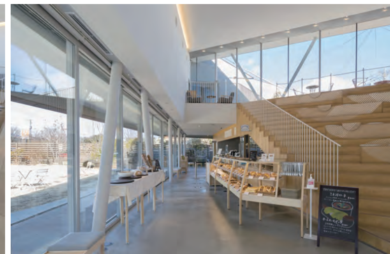
併設されたベーカリーカフェ「エブリパン」