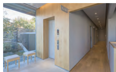
トイレ入り口(ベーカリーカフェ側)