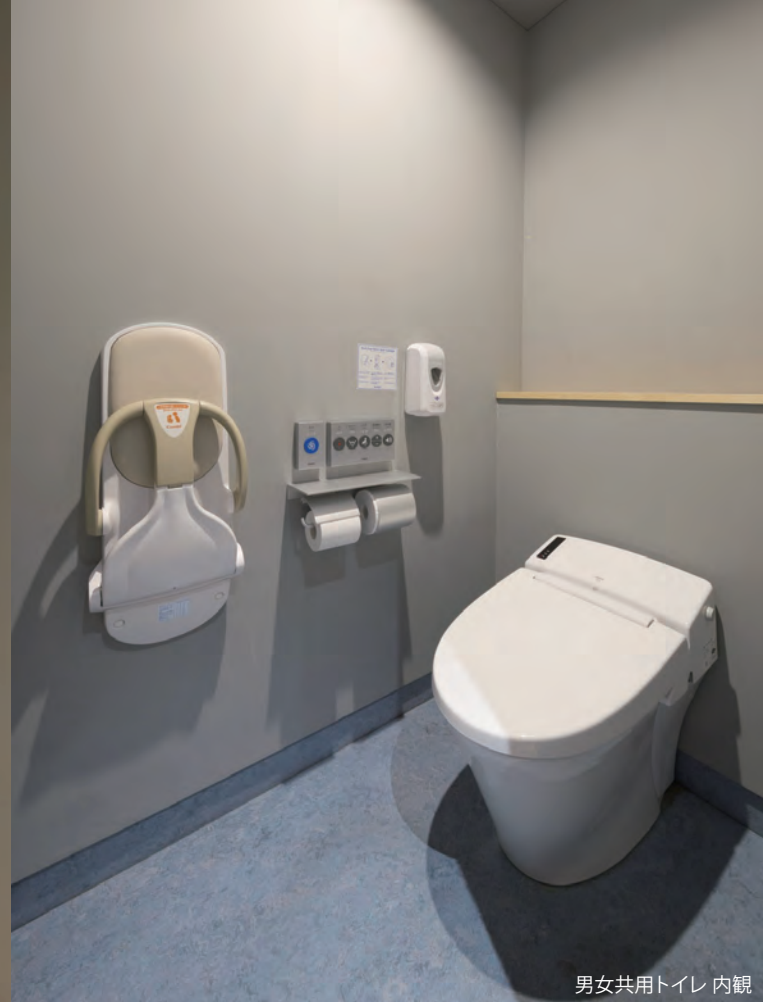
男女共用トイレ 内観