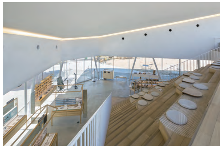
大階段から見た店内