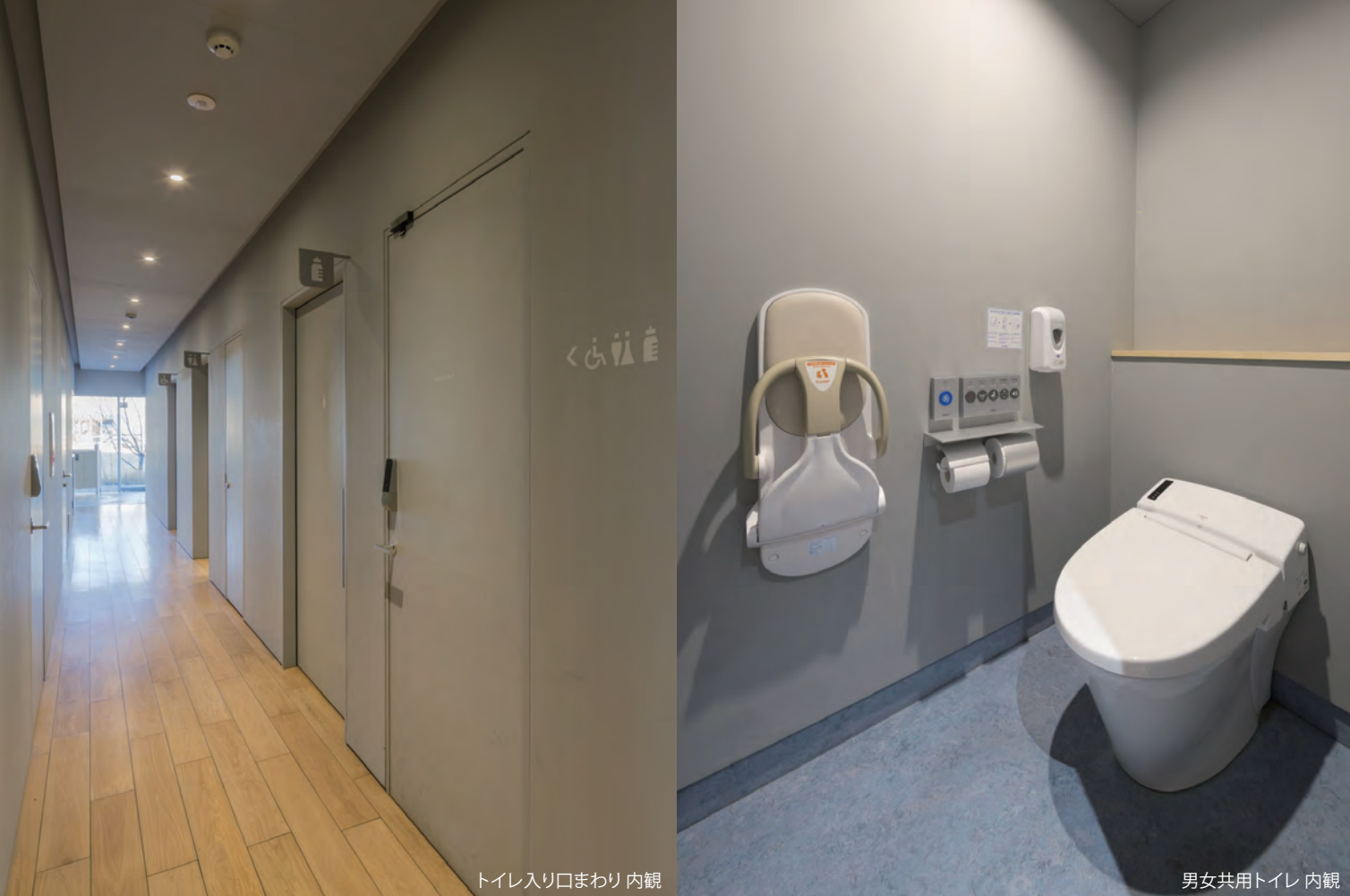
トイレ入り口まわり 内観