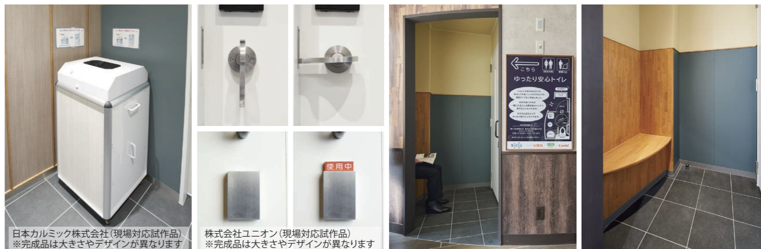
日本カルミック株式会社(現場対応試作品) ※完成品は大きさやデザインが異なります