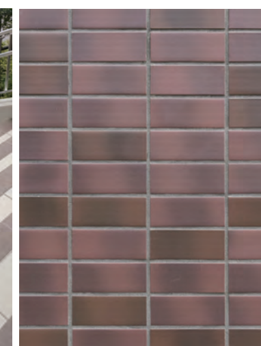
低層部 外装壁タイルディテール