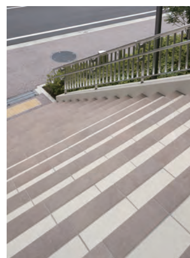
階段 外装床タイル