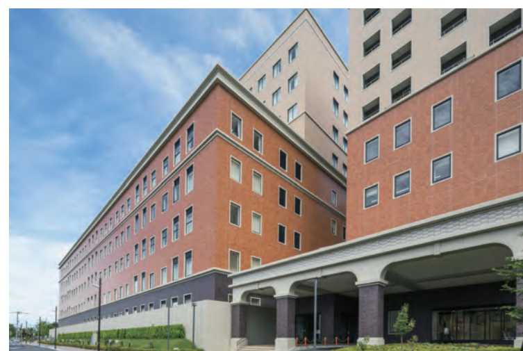
病院棟、学校・寮棟 南面