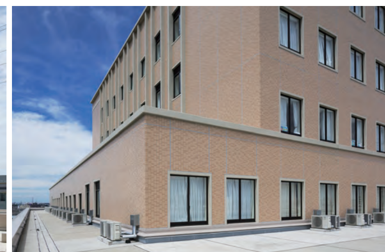
高層部 外装壁タイル