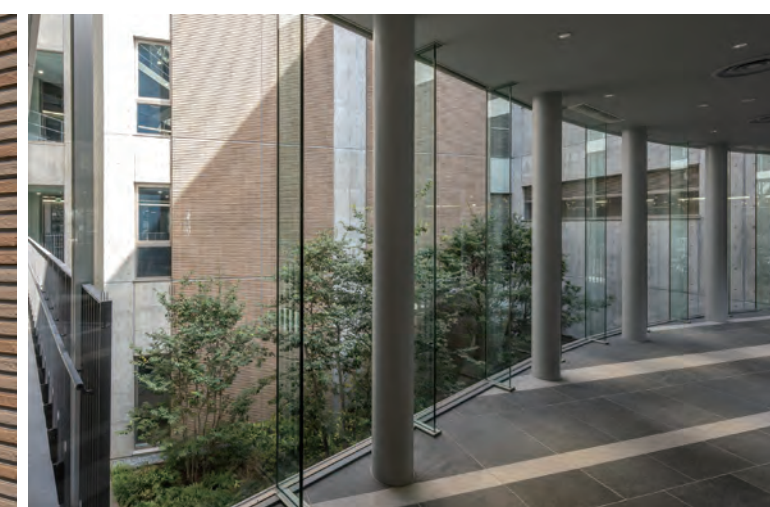
回廊 内装床タイル、中庭に面した外装壁タイル