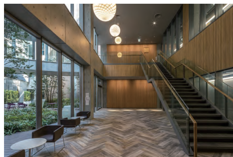
吹き抜け 内装床タイル