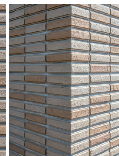
外装壁タイルディテール