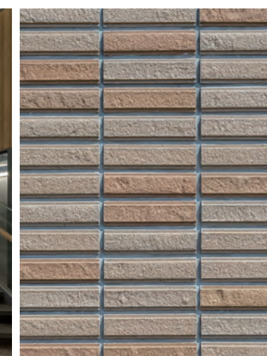
外装壁タイルディテール