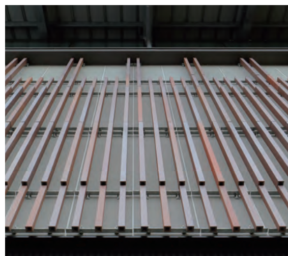
テラコッタルーバー