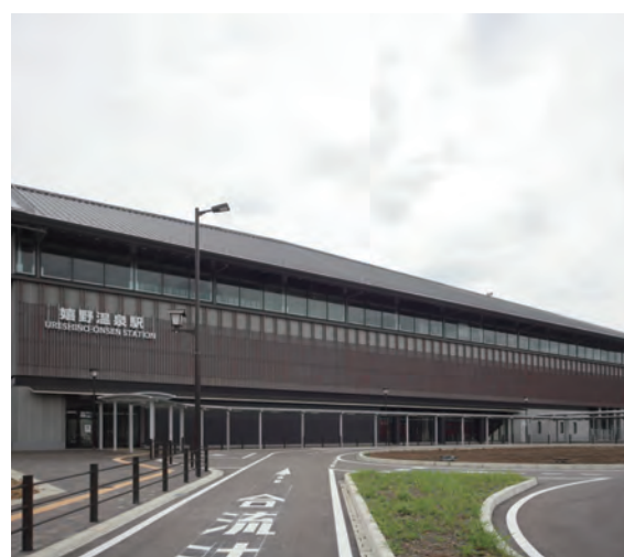
テラコッタルーバー