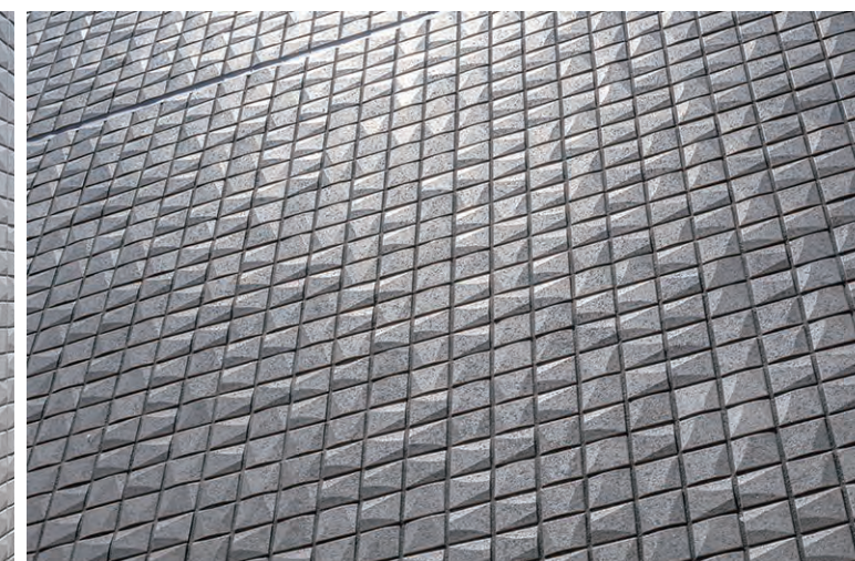
外装壁タイルディテール(見上げ)