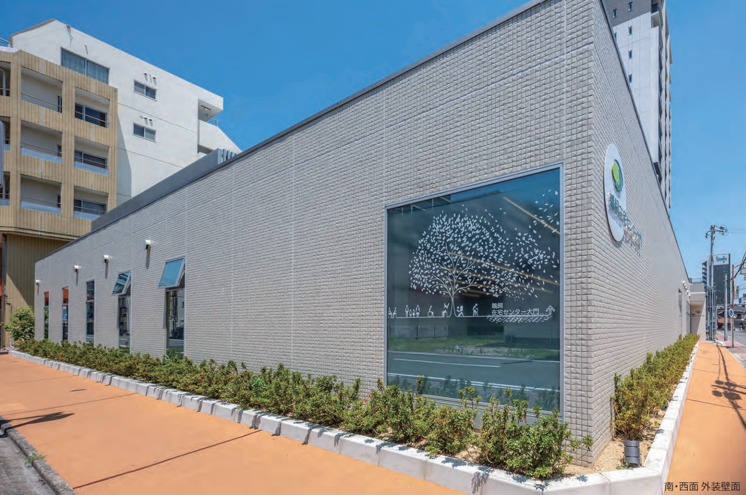
南・西面 外装壁面