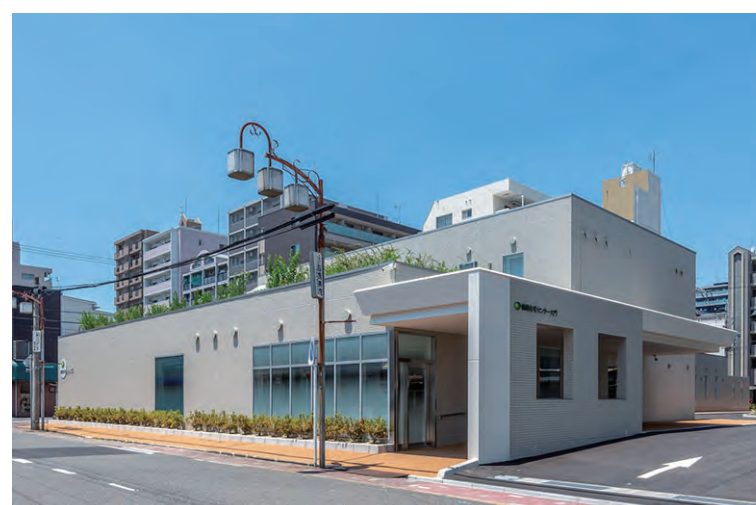
南・東面 外装壁面