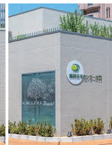
南・西面 外装壁面