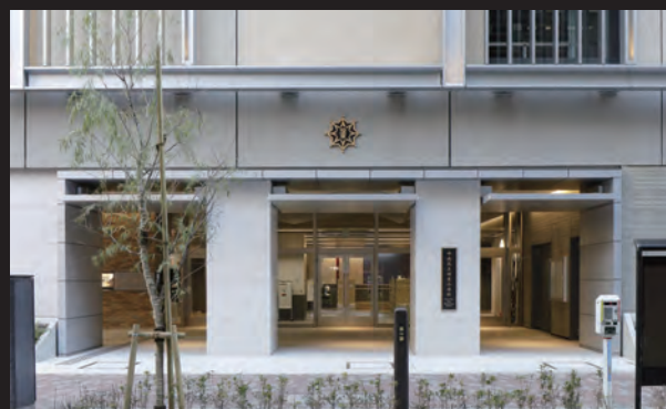
中央区立城東小学校 ファサード入口

掲載内容及び写真・図版の無断転載はかたくお断りします。(許可なく転載・流用した場合、損害賠償が発生します。)