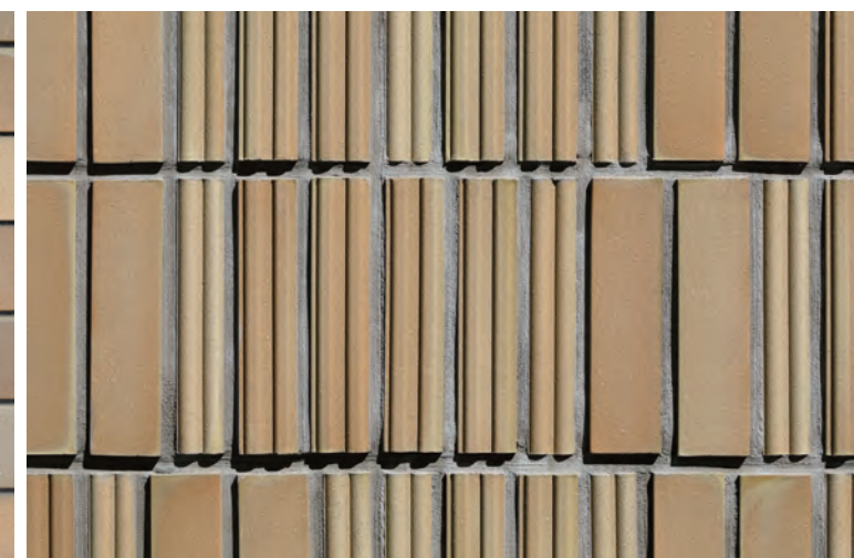
八重洲ウォーク 塀 外装壁タイル