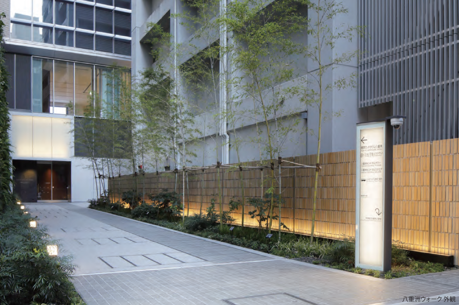
八重洲ウォーク外観