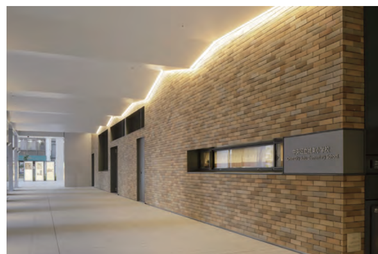
エントランスピロティ 外装壁タイル