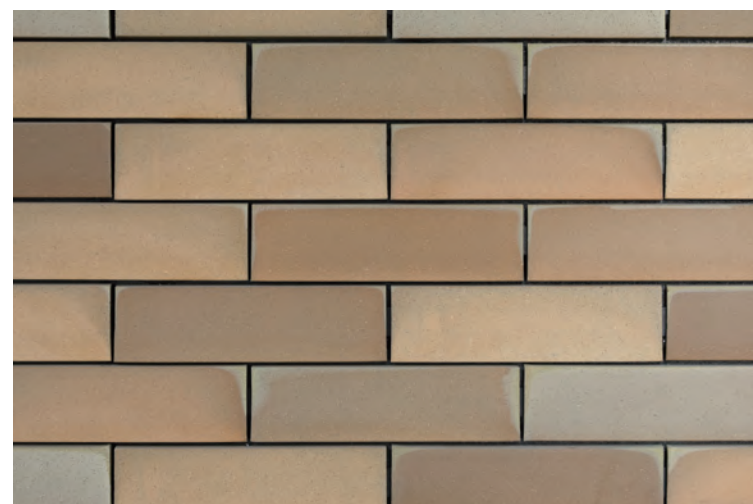
中央区立城東小学校 エントランスピロティ 外装壁タイル