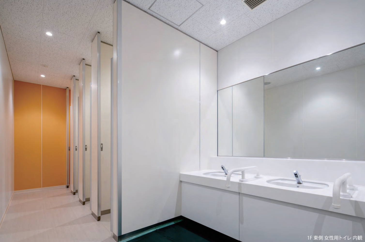
1F 東側 女性用トイレ 内観