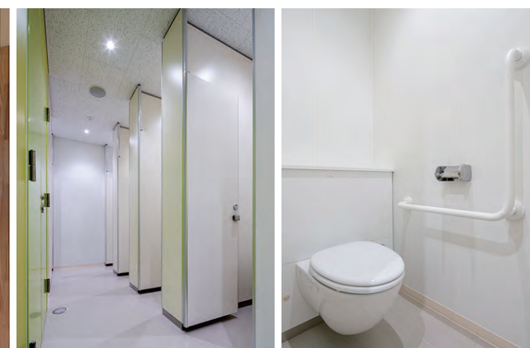
2F 西側 女性用トイレ

個室同士の間仕切りは天井までであるため、落ち着いて利用できる。混雑時も連続して利用できるクイックタンク式の大便秘器を採用。壁掛式のため足元の清掃性も高い。