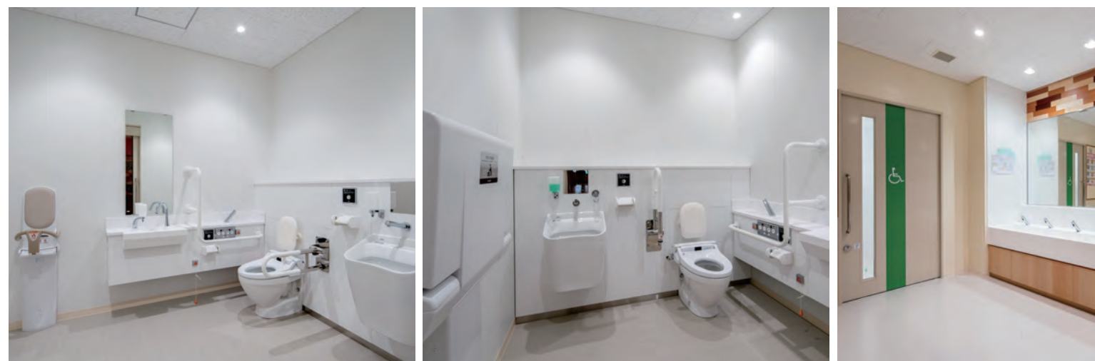
2F バリアフリートイレ

2Fにはバリアフリートイレを右勝手と左手の2箇所設置。各種手すりや車椅子対応機器の他、オストメイトに配慮した流しも完備。また、幼児連れの方も安心して来校できるよう、おむつ交換台やベビーシートも備えている。