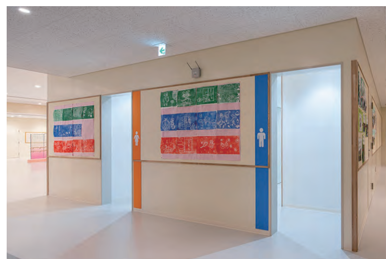
1F 東側 トイレ入り口まわり

トイレサインはライン状に色分けされ、大きなピクトグラムを表示。シンプルでわかりやすいため、離れた場所からでも確認しやすい。