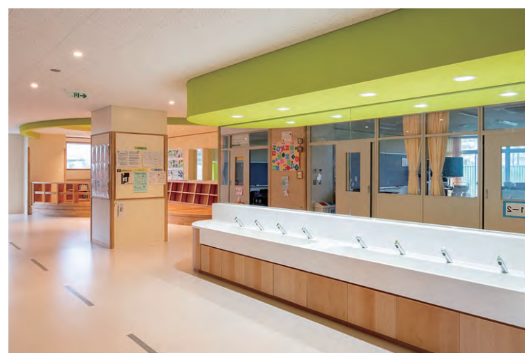
2F 西側 トイレ入り口まわり

トイレ裏に設置された水まわりは、うがいや手洗いのみの利用者を分散できるためトイレの利用集中の緩和につながっている。