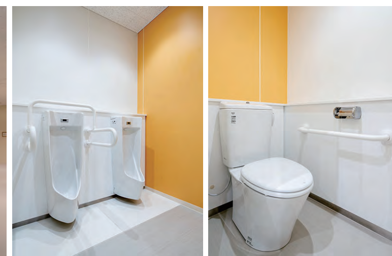
1F 東側 男性用トイレ

小便器は尿ダレに配慮し汚垂石を設置。1Fの大便器はレジリエントトイレを採用し、断水時には洗浄水量を5Lから1Lに切り替えて使用できる。