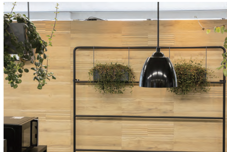
「行くべき場所」から「行きたい場所」にオフィスの価値提案を实践。