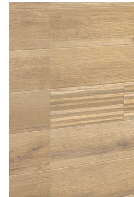
内装壁タイルディテール