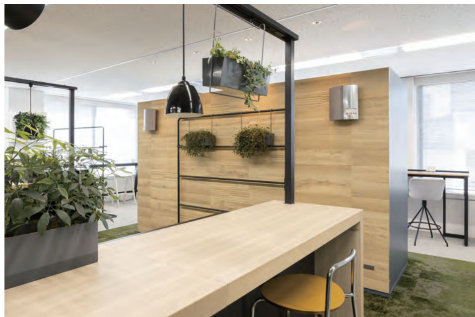
新しい働き方とこれからのオフィス空間を体験できる。

ニューノーマルな働き方に挑戦している「霞が関ライブオフィス」。新たなSTEP UPを目指し、「誰もが来たくなるオフィス」をコンセプトに、オフィスをリニューアル。