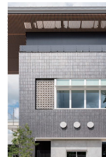
外壁 外装壁タイル