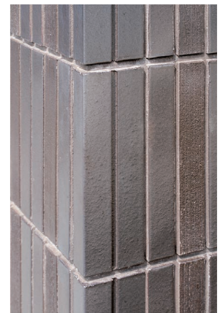
外装壁タイルディテール