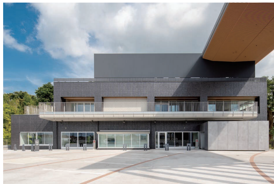
外壁 外装壁タイル

佐倉図書館の建て替えを核として、歴史・文化のまちを象徴する旧城下町の保全や、地域の活性化にも資する拠点施設。