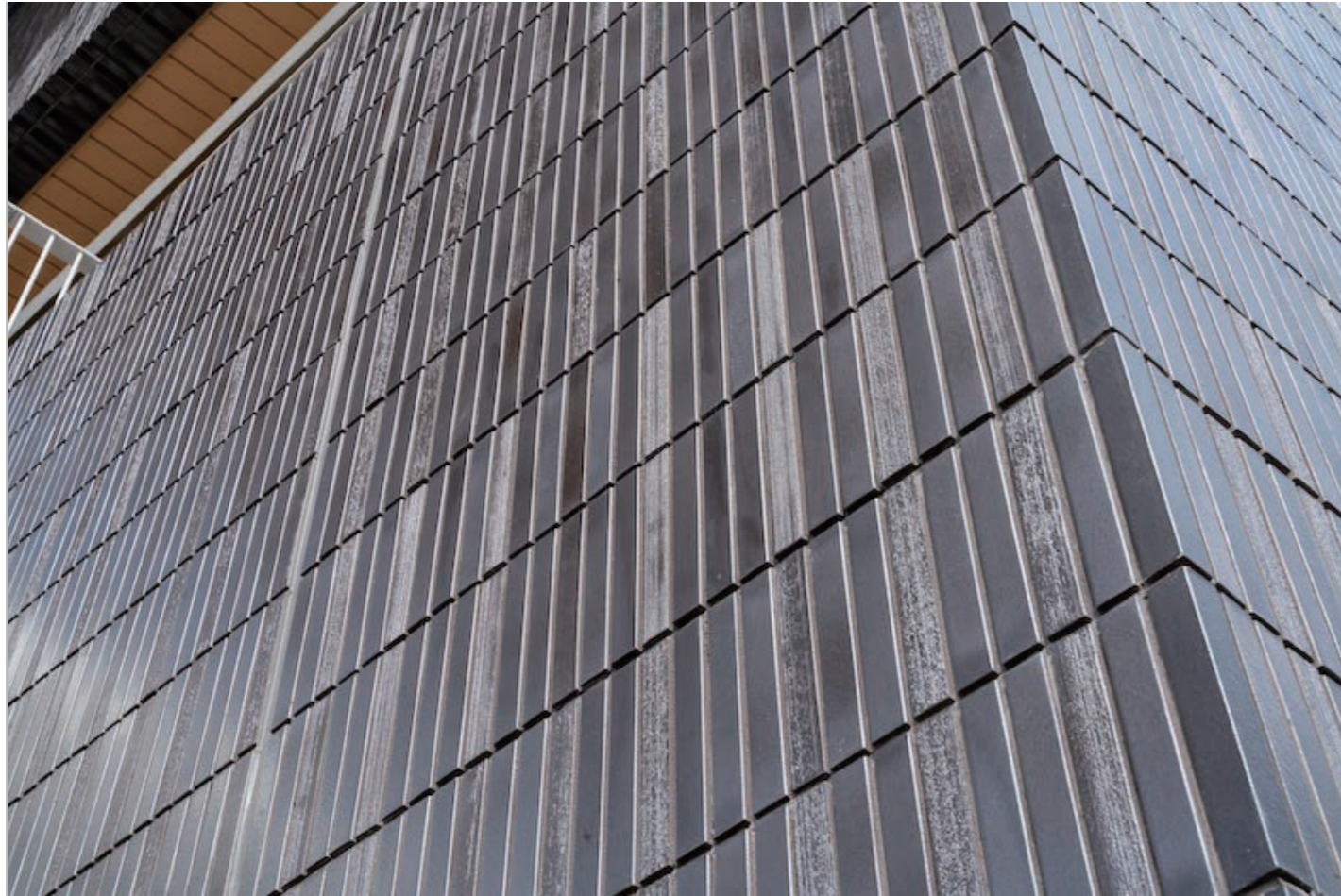
外装壁タイルディテール