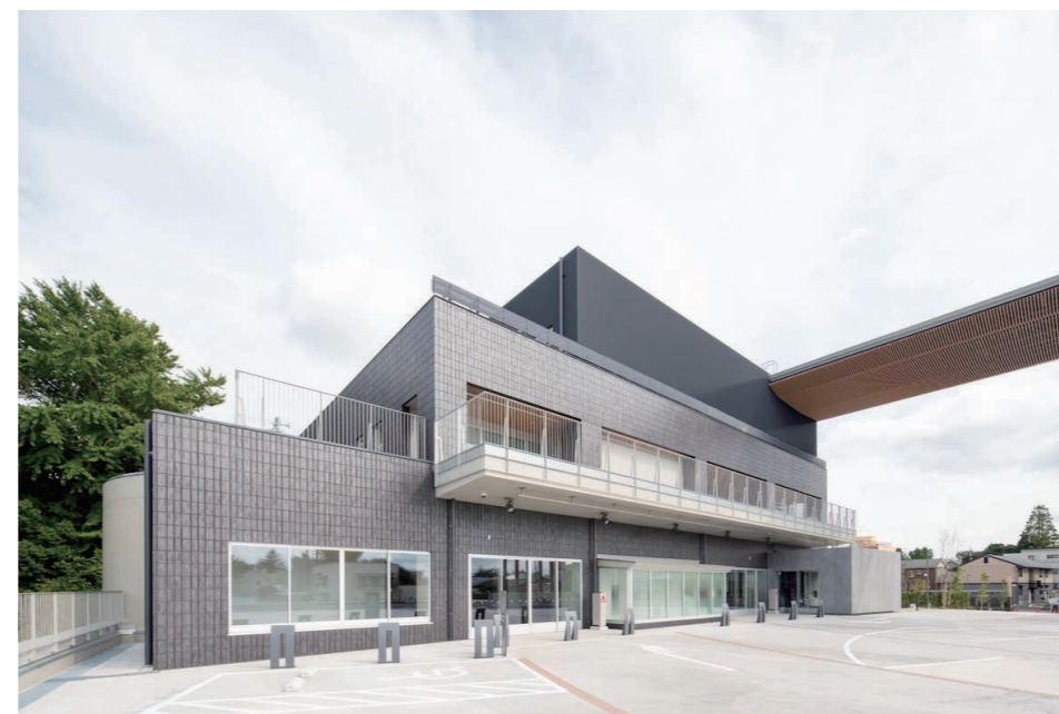
外壁 外装壁タイル