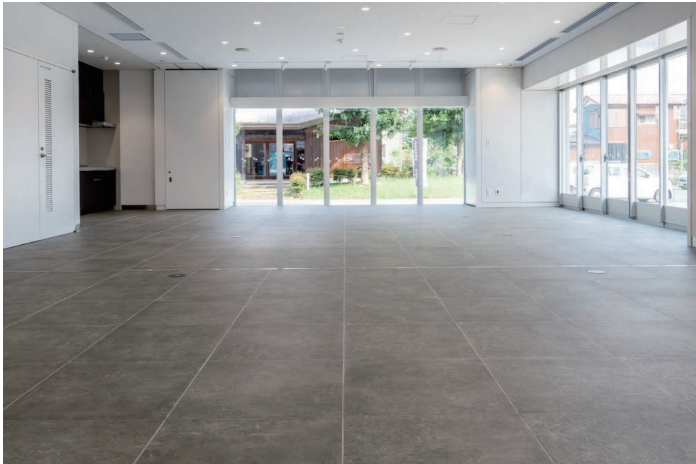
ゆめさくらひろば 内装床タイル