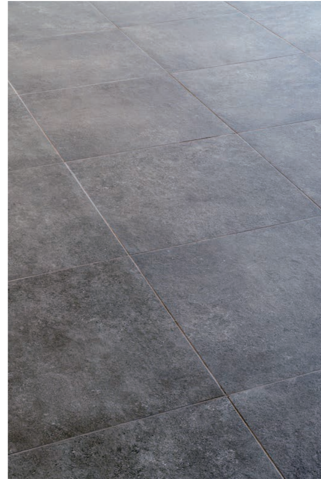
内装床タイルディテール