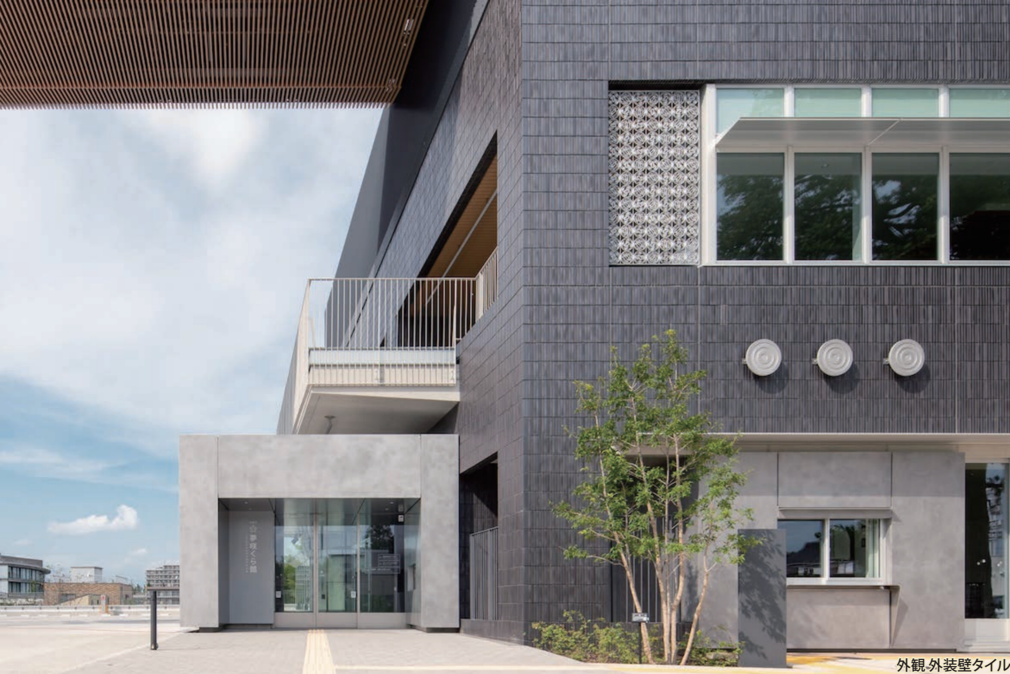
外観 外装壁タイル

外装壁タイル : FT-11/30x226t15/OM5137-60A・OM5137-62C (特注) 内装床タイル メンフィス : IPF-600/MMP-23 ユーティリティティオ (Tio) : L=1800