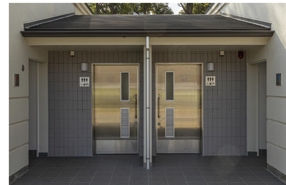
トイレ入り口まわり