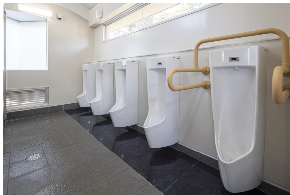
男性用トイレ 小便器

明治時代の代表的近代西洋庭園であり、庭園鑑賞や自然観察、写生など、さまざまな目的で幅広い世代に利用される国民公園。