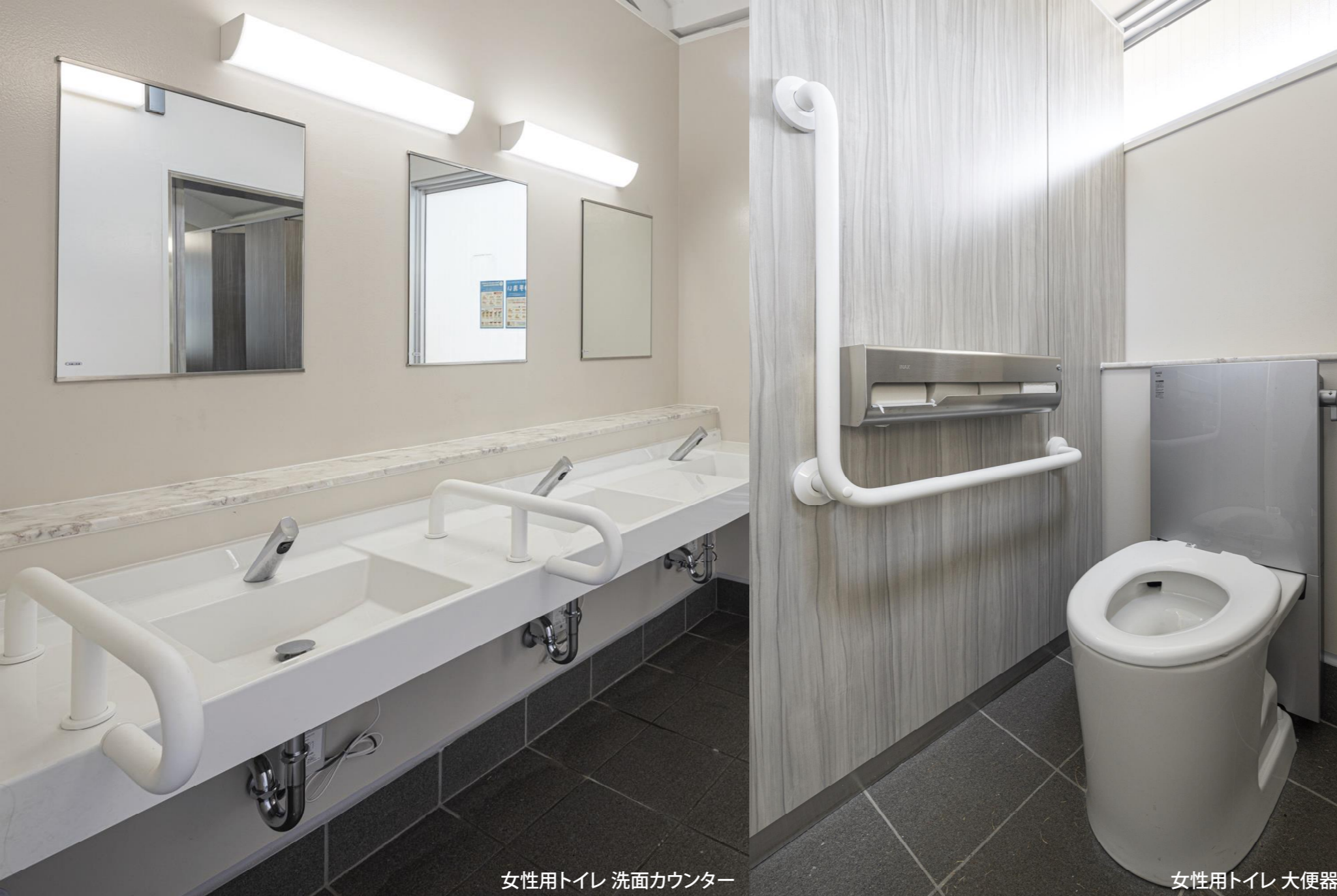
女性用トイレ 洗面カウンター