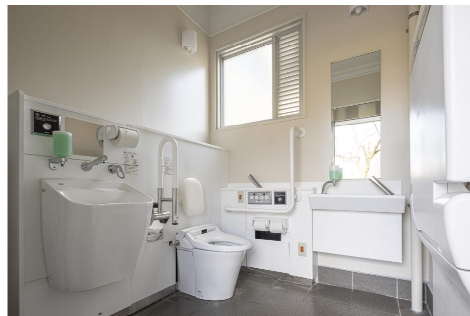
バリアフリートイレ