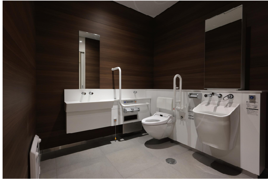
2F 車椅子利用者優先バリアフリートイレ