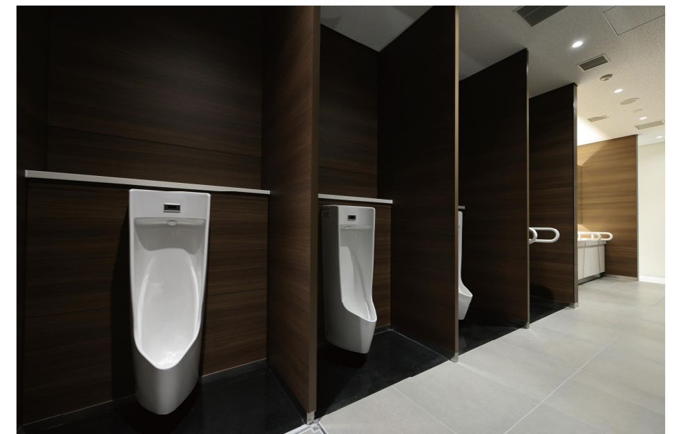
1F男性用トイレ 小便器