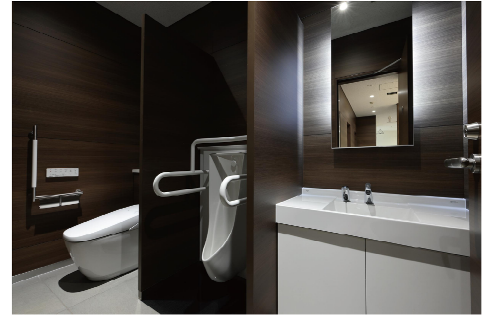
2F 男性ゾーン大便器・小便器個室