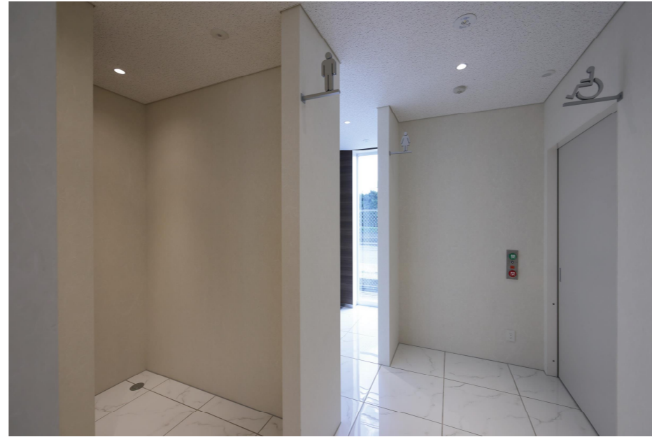
1Fトイレ入り口周り