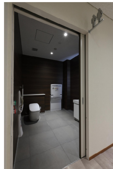
2F 男女共用広めトイレ