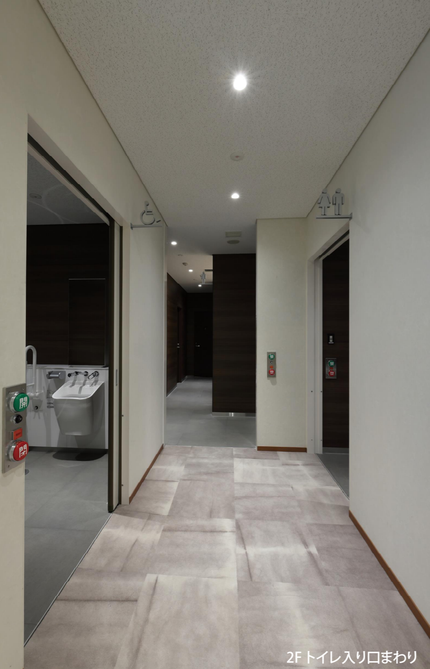
2F トイレ入り口まわり