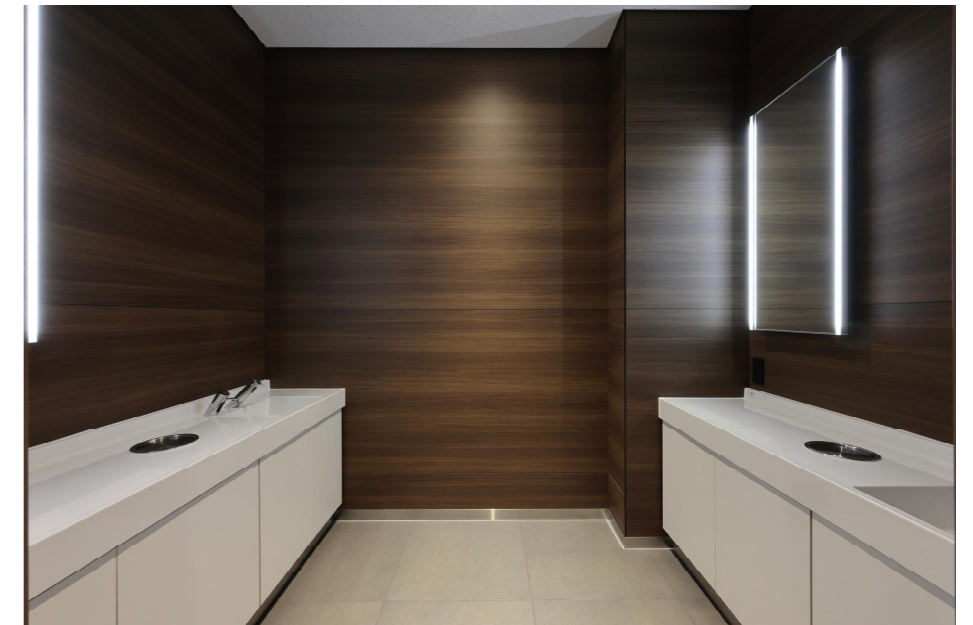
2F 女性ゾーン 洗面・スタイリングコーナー