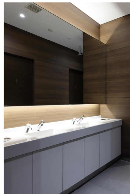
2F 男性ゾーン 洗面カウンター