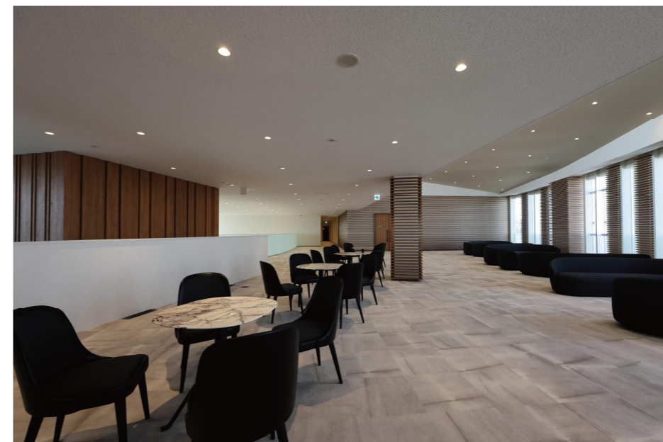
2F ラウンジ・トイレ入口