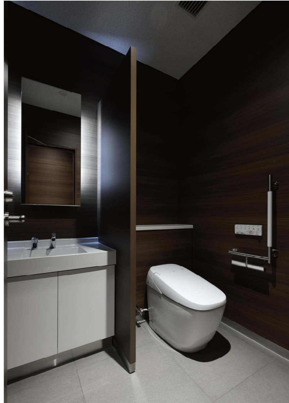
2F 男性ゾーン大便器個室