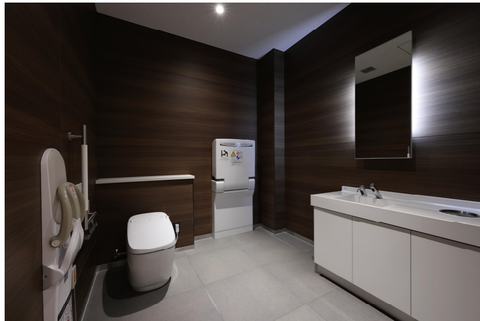
2F 男女共用広めトイレ