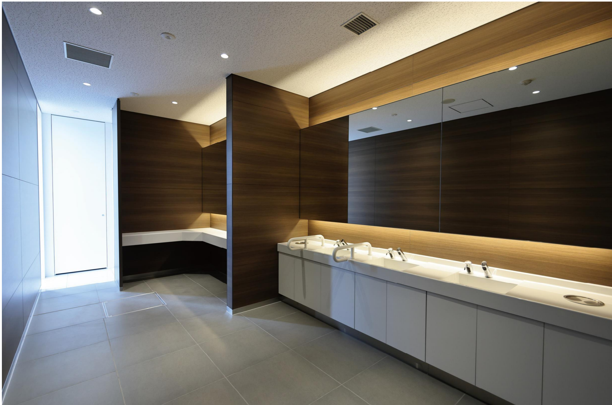
1F女性用トイレ 洗面カウンター、スタイリングコーナー