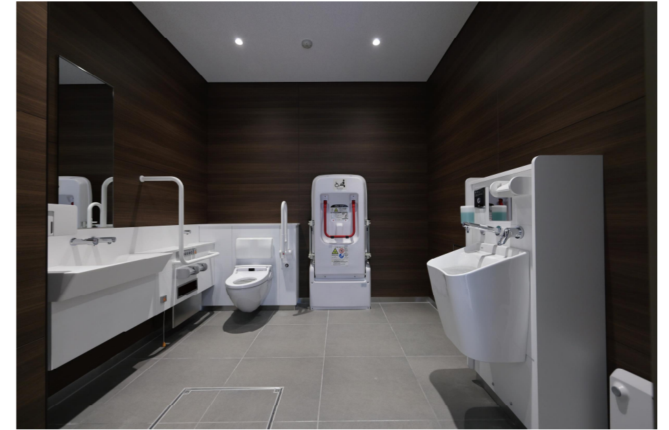
1Fバリアフリーストイレ