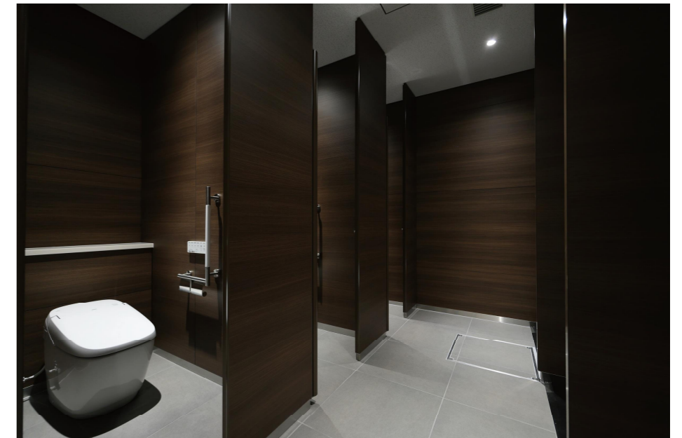
1F女性用トイレ 大便器