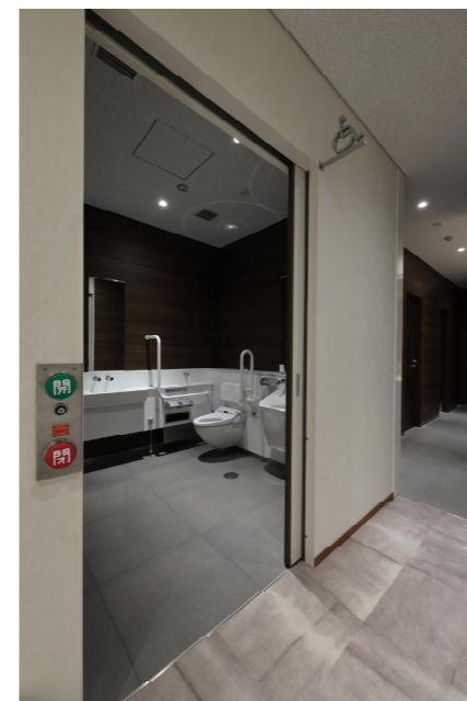
2F 車椅子使用者優先バリアフリートイレ