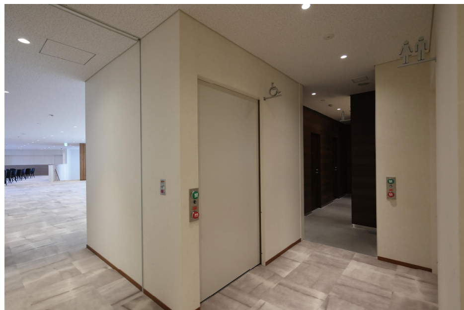
2F トイレ入り口まわり