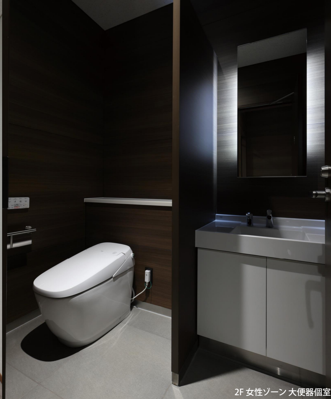
2F 女性ゾーン 大便器個室

最先端の技術・材料・デバイスを提供するメーカーの本社に、ステークホルダーとのコミュニケーションを図るための施設が完成。