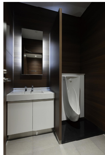
2F 男性ゾーン 小便器個室

最先端の技術・材料・デバイスを提供するメーカーの本社に、ステークホルダーとのコミュニケーションを図るための施設が完成。