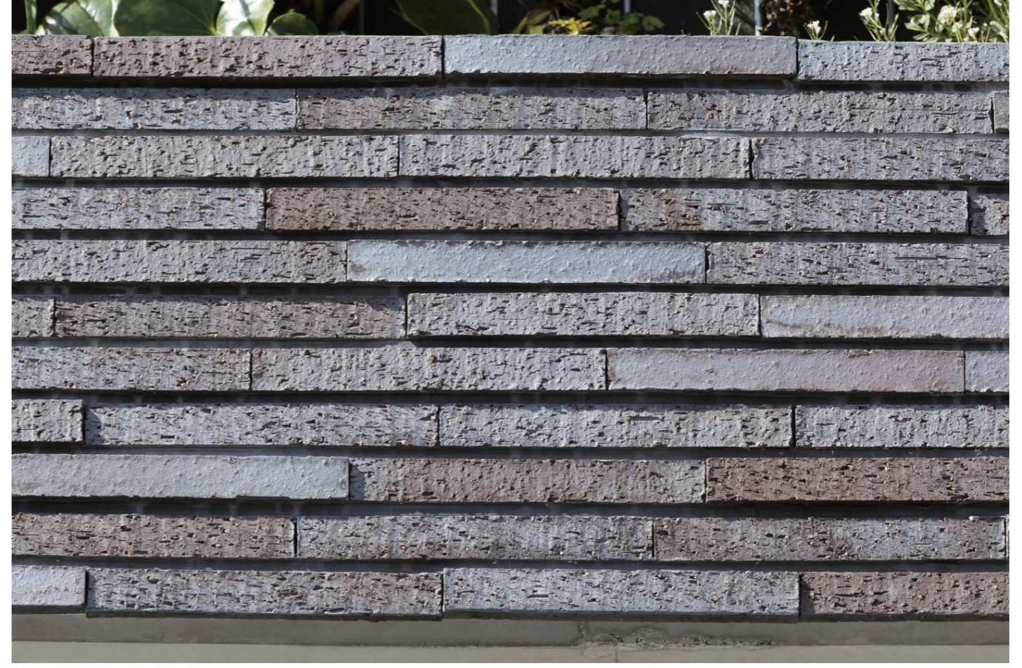
フラットとラフの面状を用意し、タイルの厚さも変えてランダムに配置した。