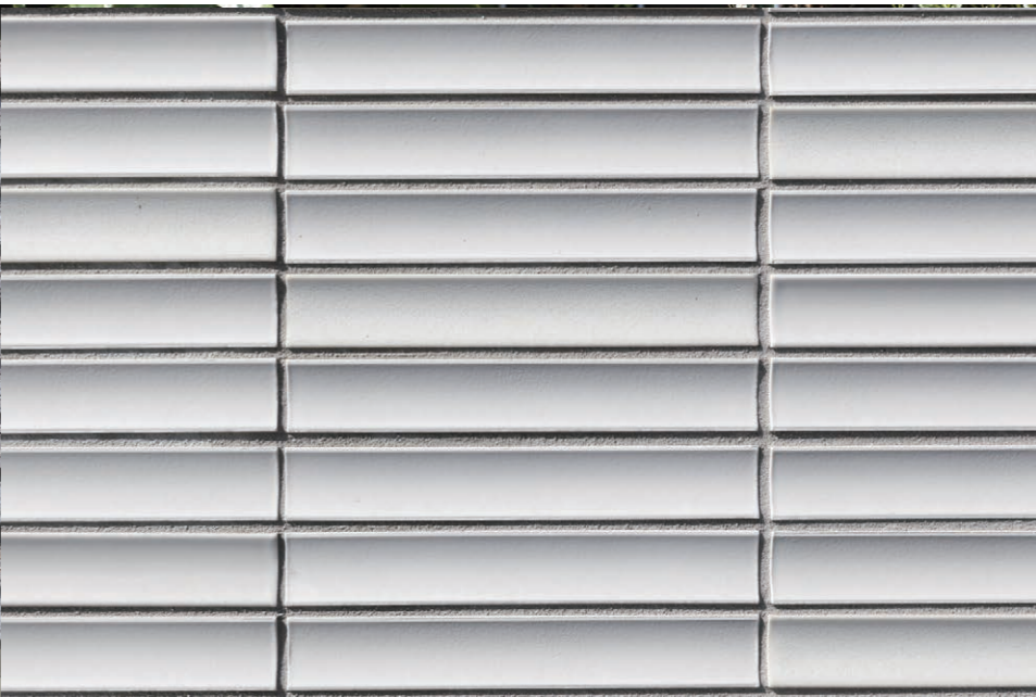
内側にラウンドした曲面に異なる質感の施釉を施し柔らかな陰影を表現した。