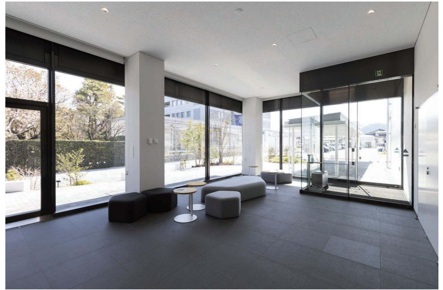
エントランス内装床