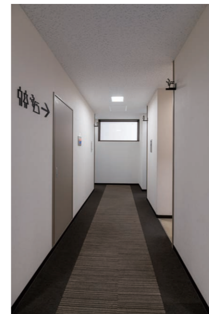
トイレ入り口まわり