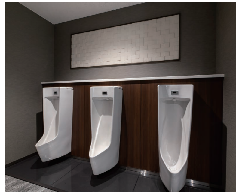
男性用トイレ 小便器