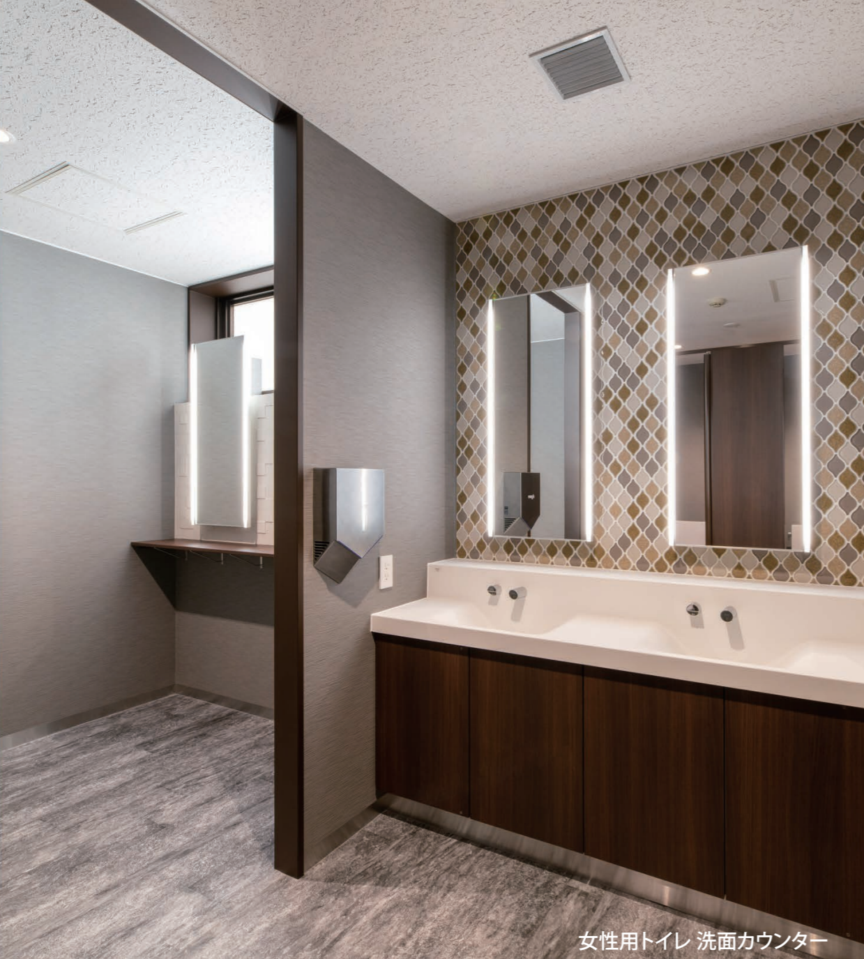
女性用トイレ 洗面カウンター