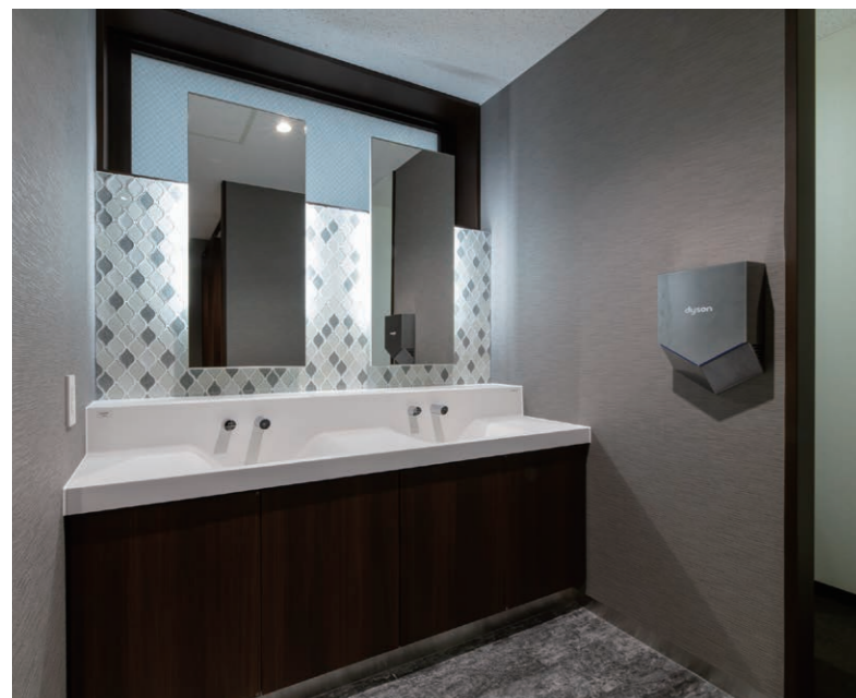
男性用トイレ 洗面カウンター

社会の「食」を支え続けてきた総合厨房機器メーカーの事業所トイレを全面リニューアル。