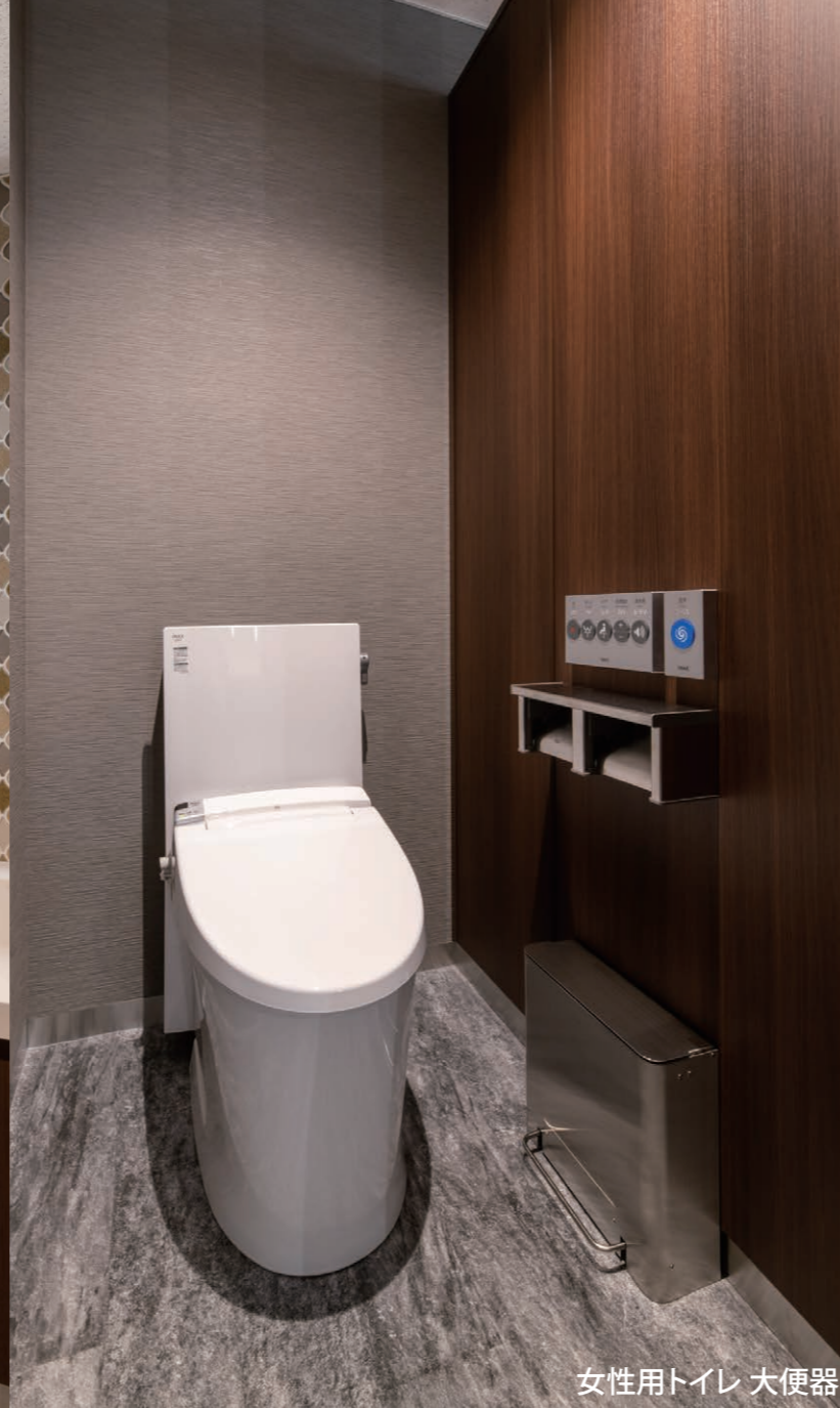
女性用トイレ 大便器

社会の「食」を支え続けてきた総合厨房機器メーカーの事業所トイレを全面リニューアル。