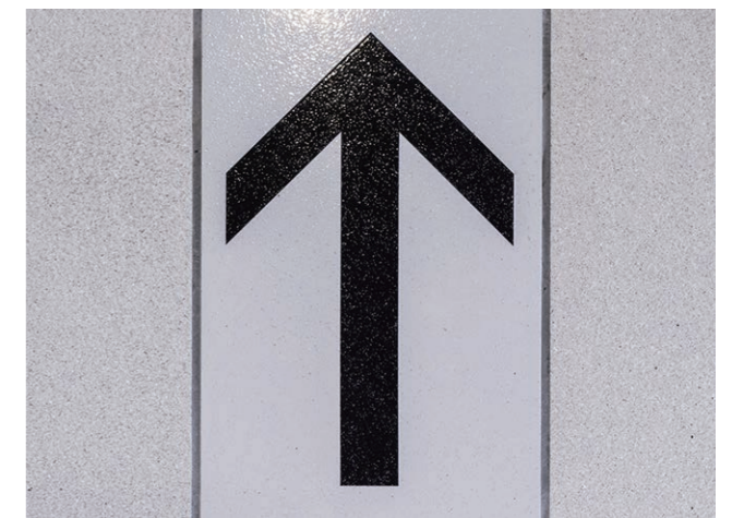
ホーム階床面ディテール