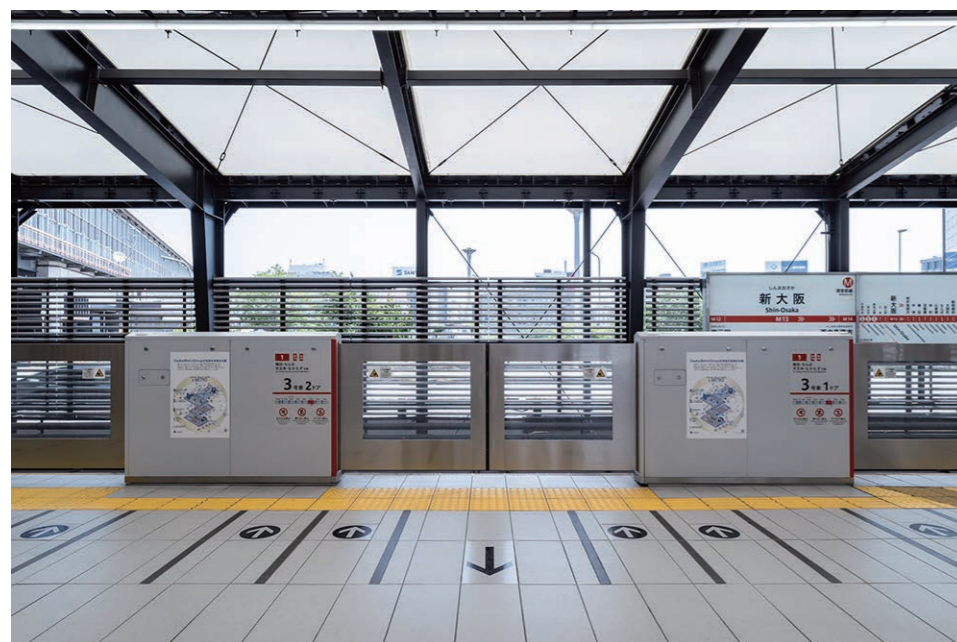
「矢印」は、混雑時における車両乗降の円滑な誘導をサポート。

大阪市内を南北に縦断する御堂筋線の新大阪駅は、新幹線や在来線などと接続する大阪の交通の要所。