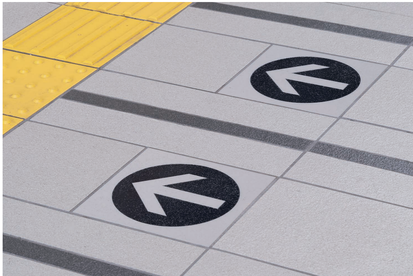
ホーム階床面ディテール