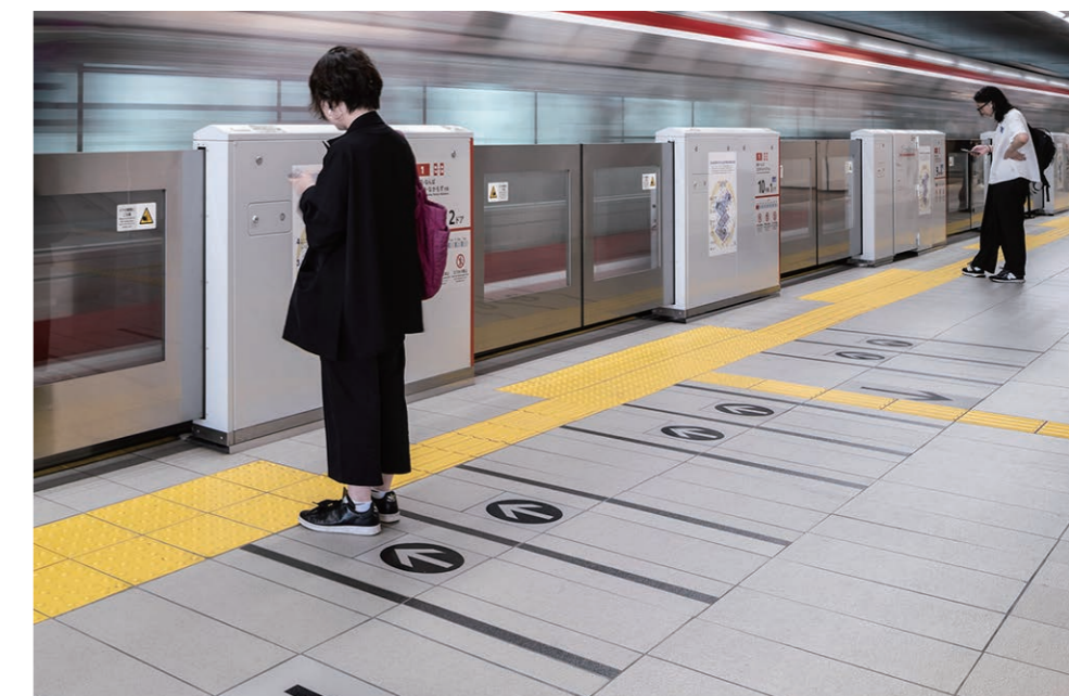
ベース色と黒のコントラストで、視認性が高くなっている。