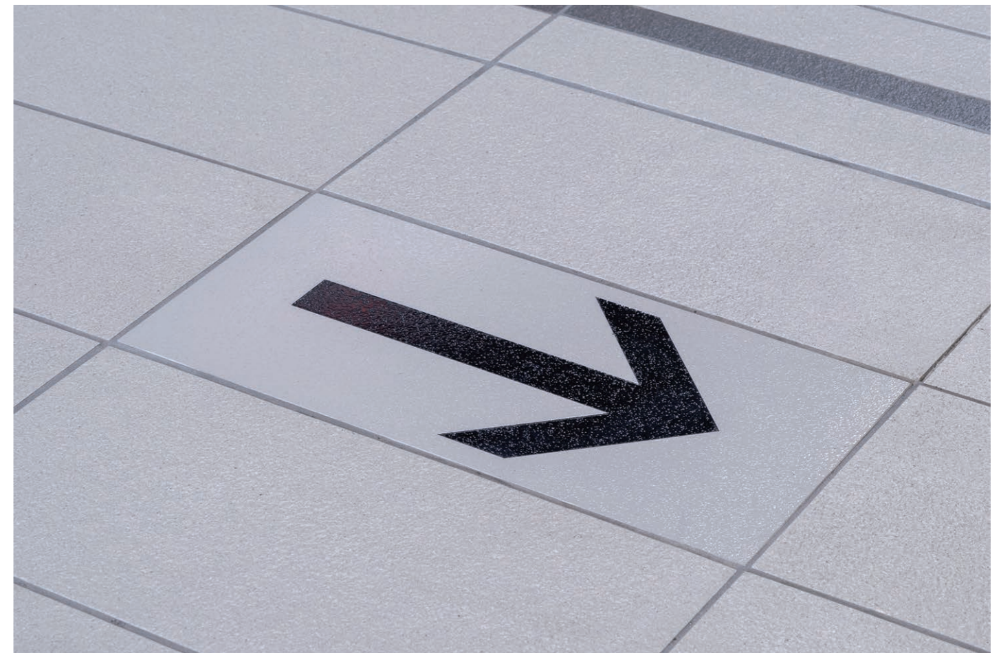
ホーム階床面ディテール