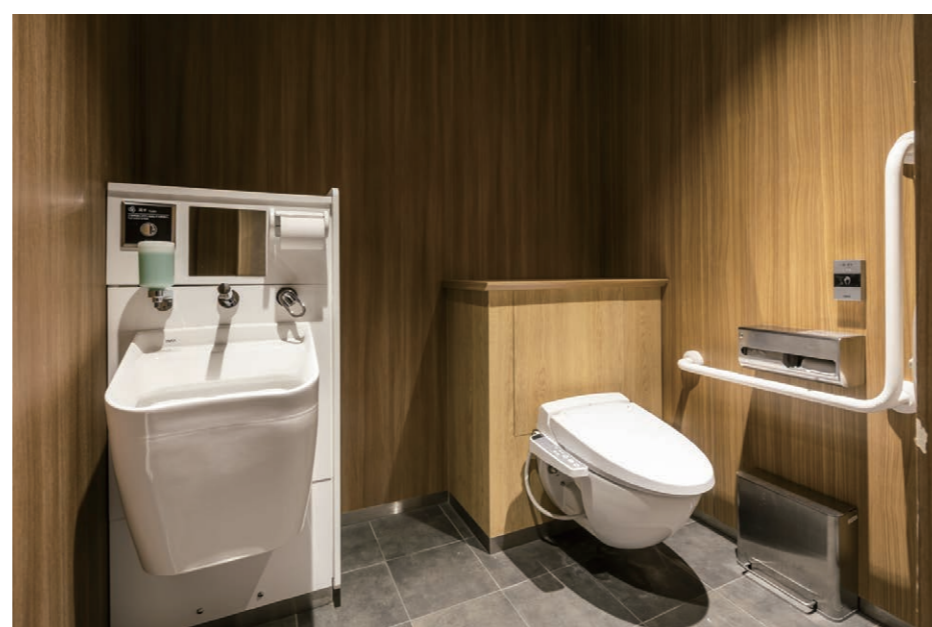
女性用トイレ 広めブース(オストメイト対応流し設置)