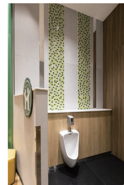
キッズトイレ 小便器