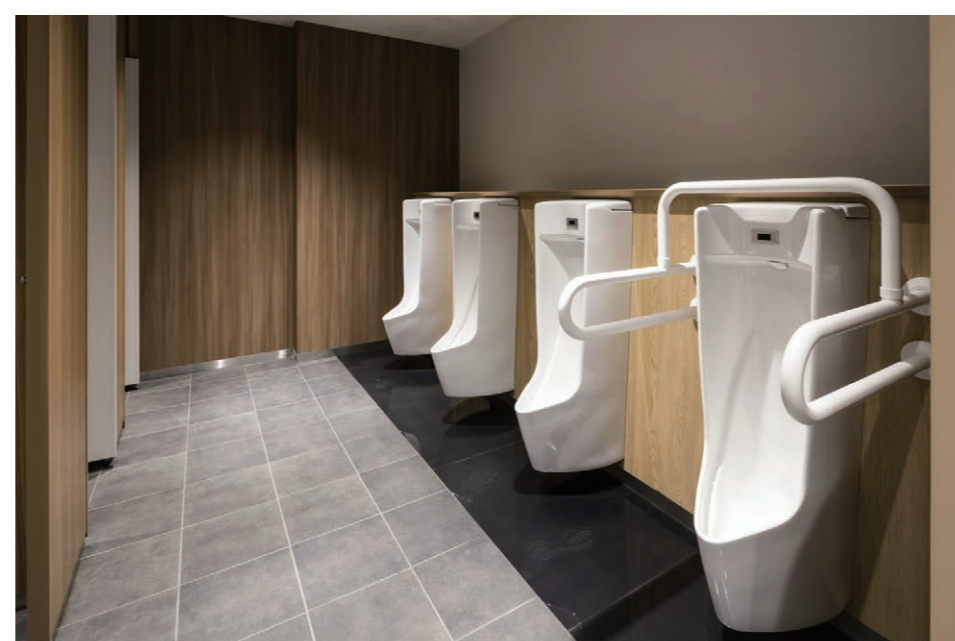
男性用トイレ 小便器