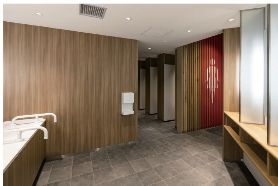
女性用トイレ 洗面・スタイリングコーナー