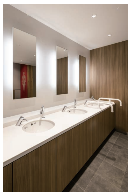
女性用トイレ 洗面