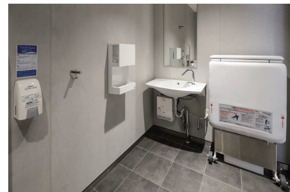
バリアフリートイレ(洗面側)