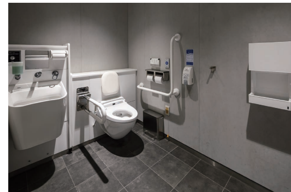
バリアフリートイレ(大便器側)