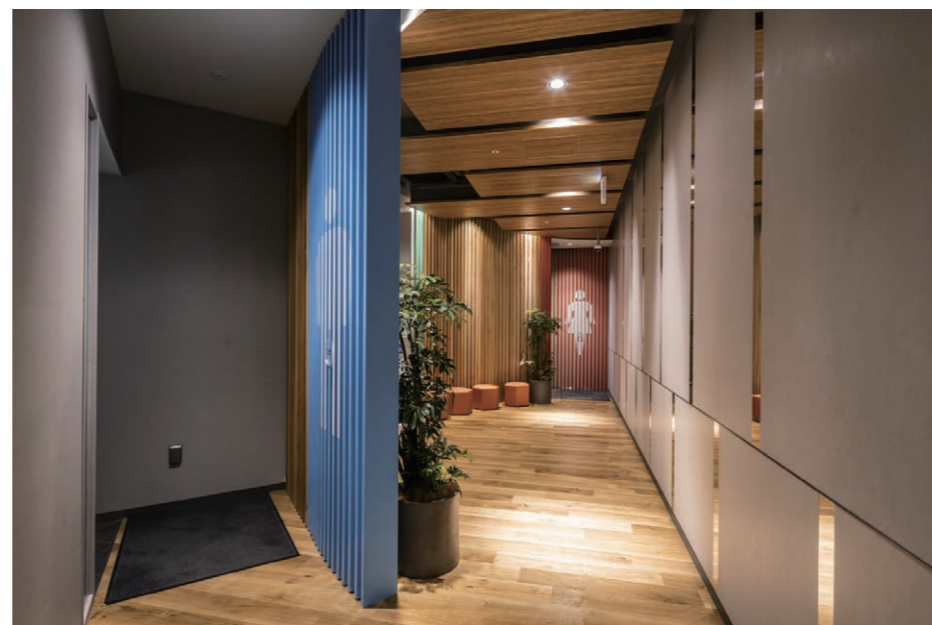
男性用トイレ 入り口まわり