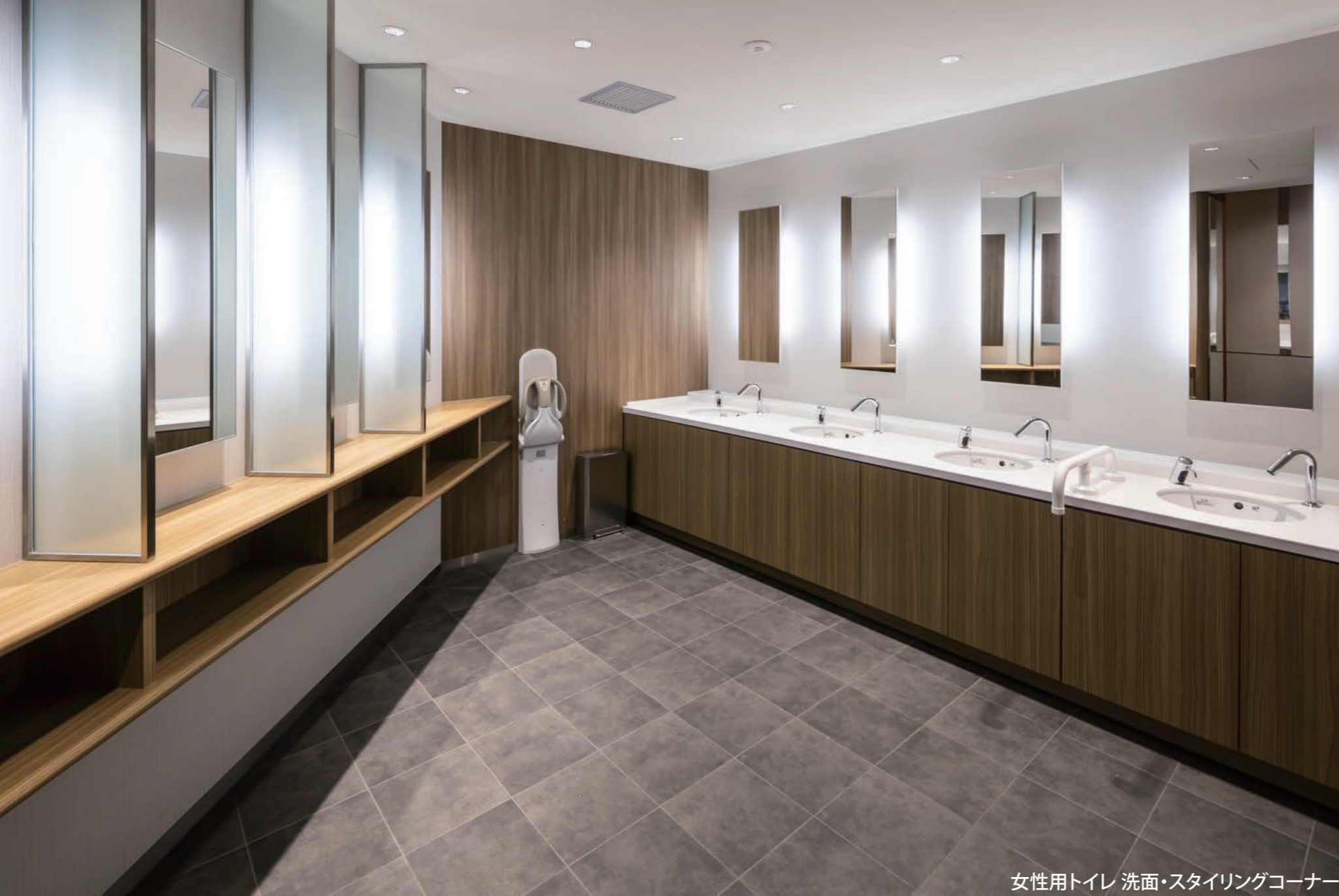
女性用トイレ 洗面・スタイリングコーナー