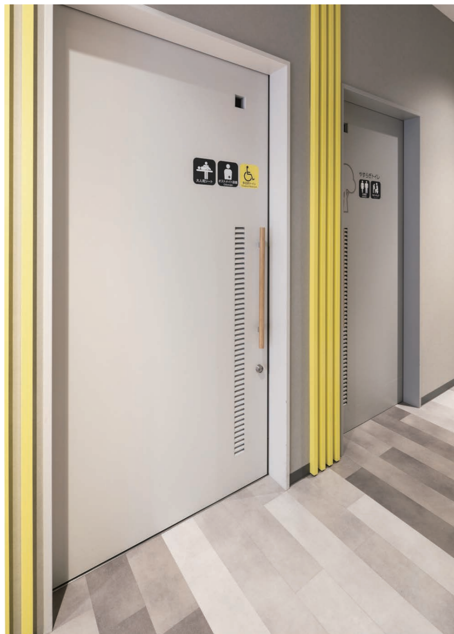
バリアフリートイレ・やすらぎトイレ(男女共用広めトイレ) 入り口まわり