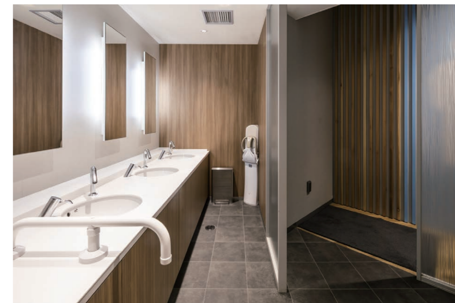
男性用トイレ 洗面