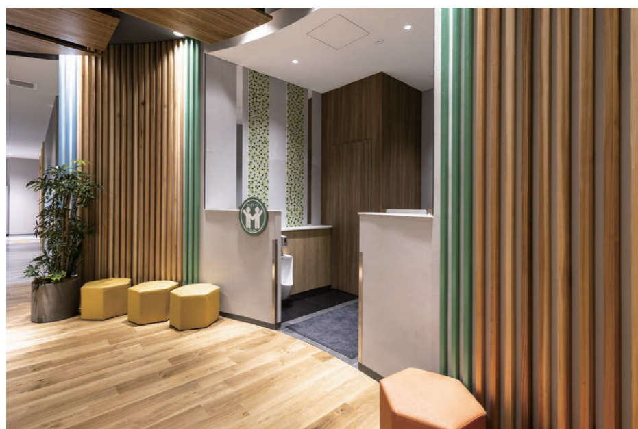
キッズトイレ 入り口まわり