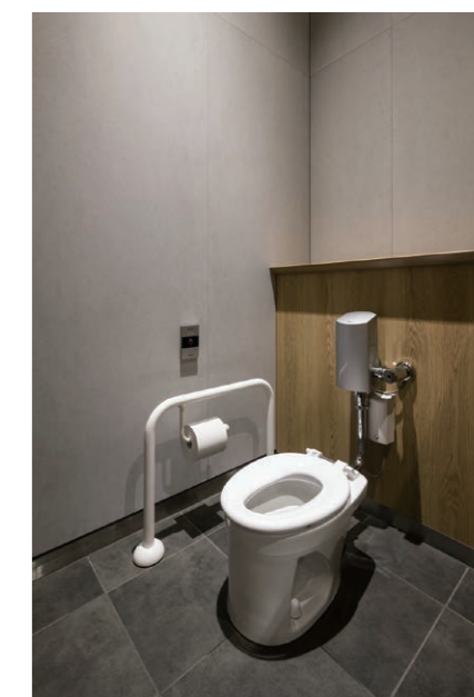
キッズトイレ 大便器