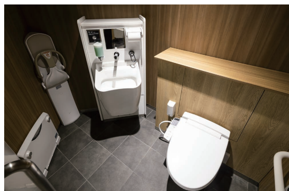
男性用トイレ 広めブース（オストメイト対応流し設置）

日生病院跡地に建つ、「健康・医療」をテーマにした複合商業施設。スーパーマーケット、ドラッグストア、クリニックなどが出店。