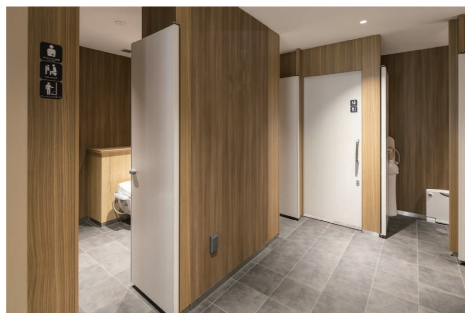
女性用トイレ 大便器コーナー