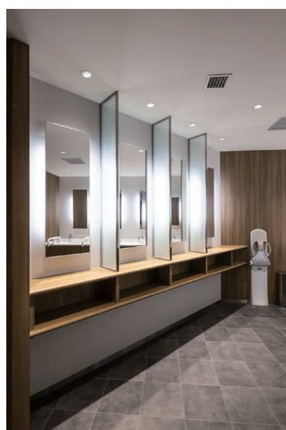
女性用トイレ スタイリングコーナー