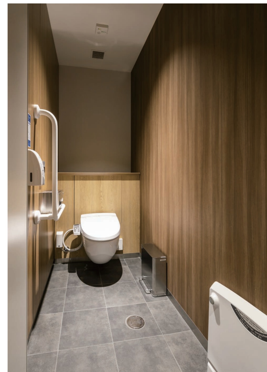
女性用トイレ 広めブース(チェンジングボード設置)