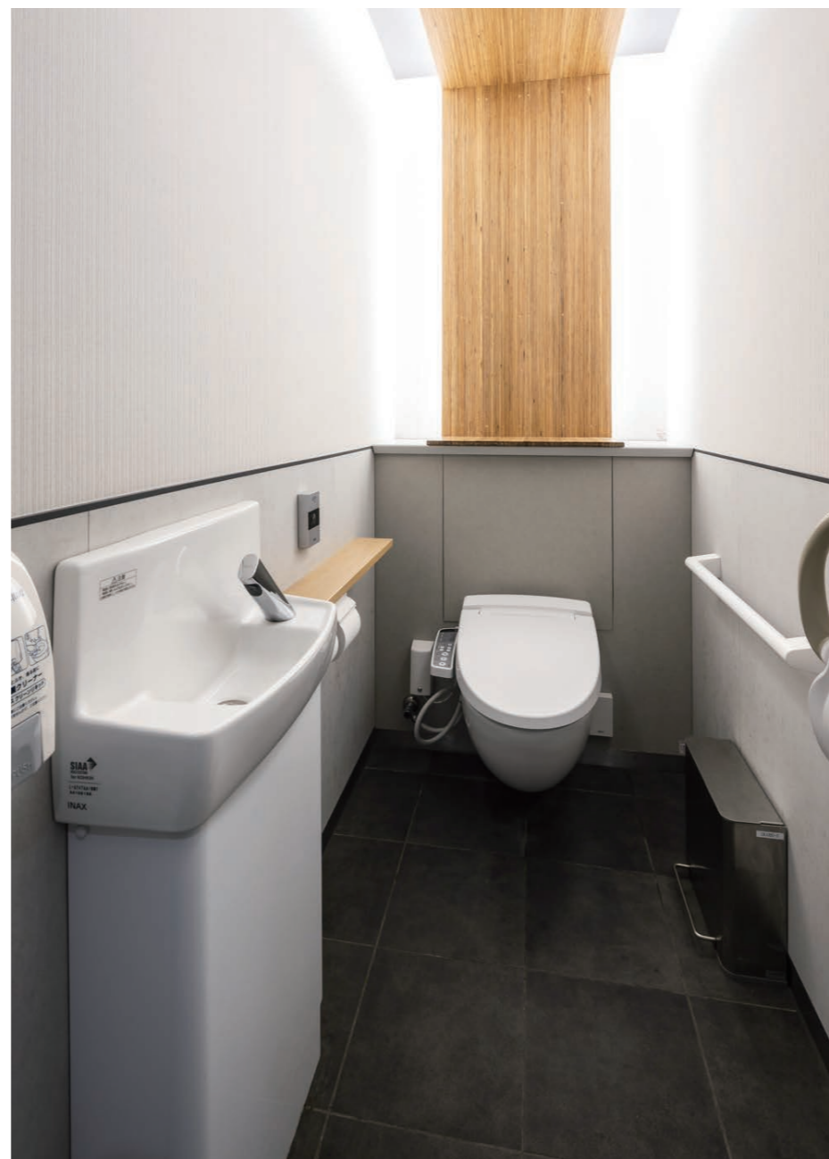
やすらぎトイレ(男女共用広めトイレ)