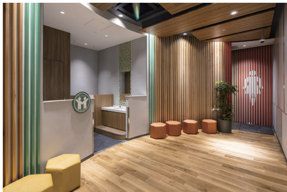
女性用トイレ・キッズトイレ 入り口まわり