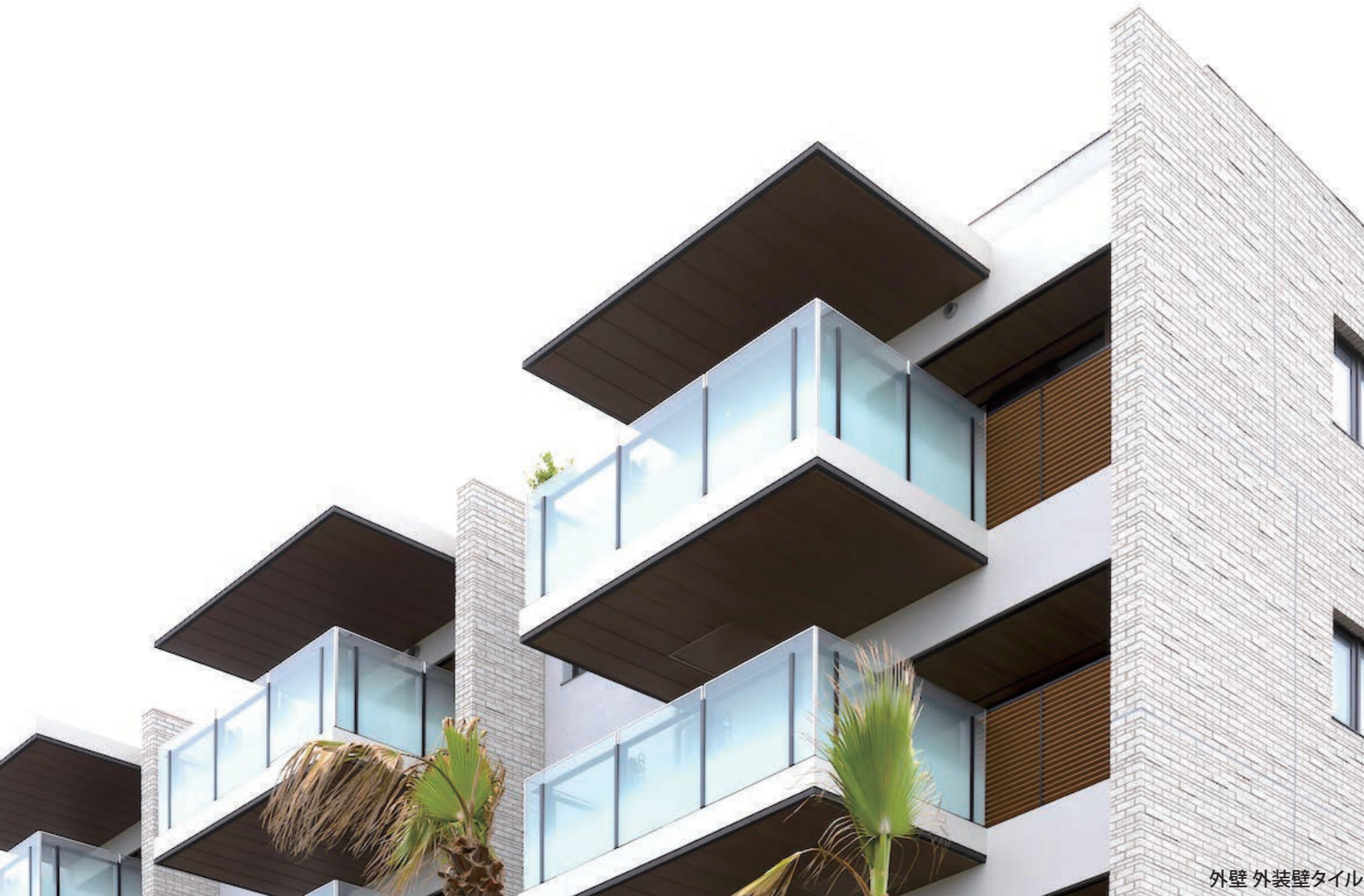
外壁 外装壁タイル

<開放廊下> 外装壁タイル(特注)：AM-255/Z814-210R-1211※45二丁擬似目地 <エントランス> 外装床タイル フェディーレ：IPF-600/FED-1、IPF-630/FED-1※パターン張り <通路スロープ> 外装床タイル フェディーレ：IPF-300/FED-2 <1F 専有部バルコニー> 外装床タイル バサーティル：IPF-915/VER-4