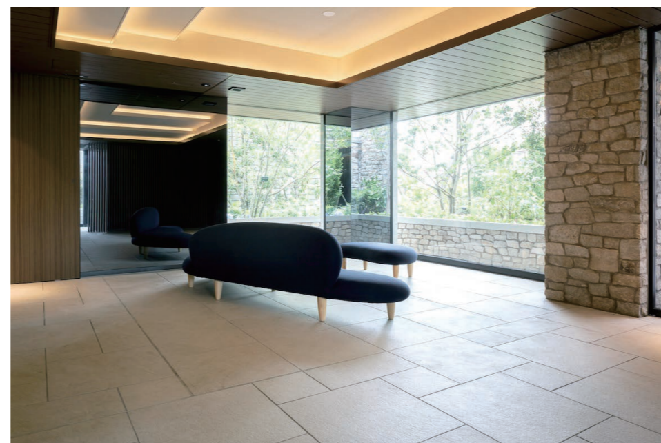
エントランスホール 内装床タイル