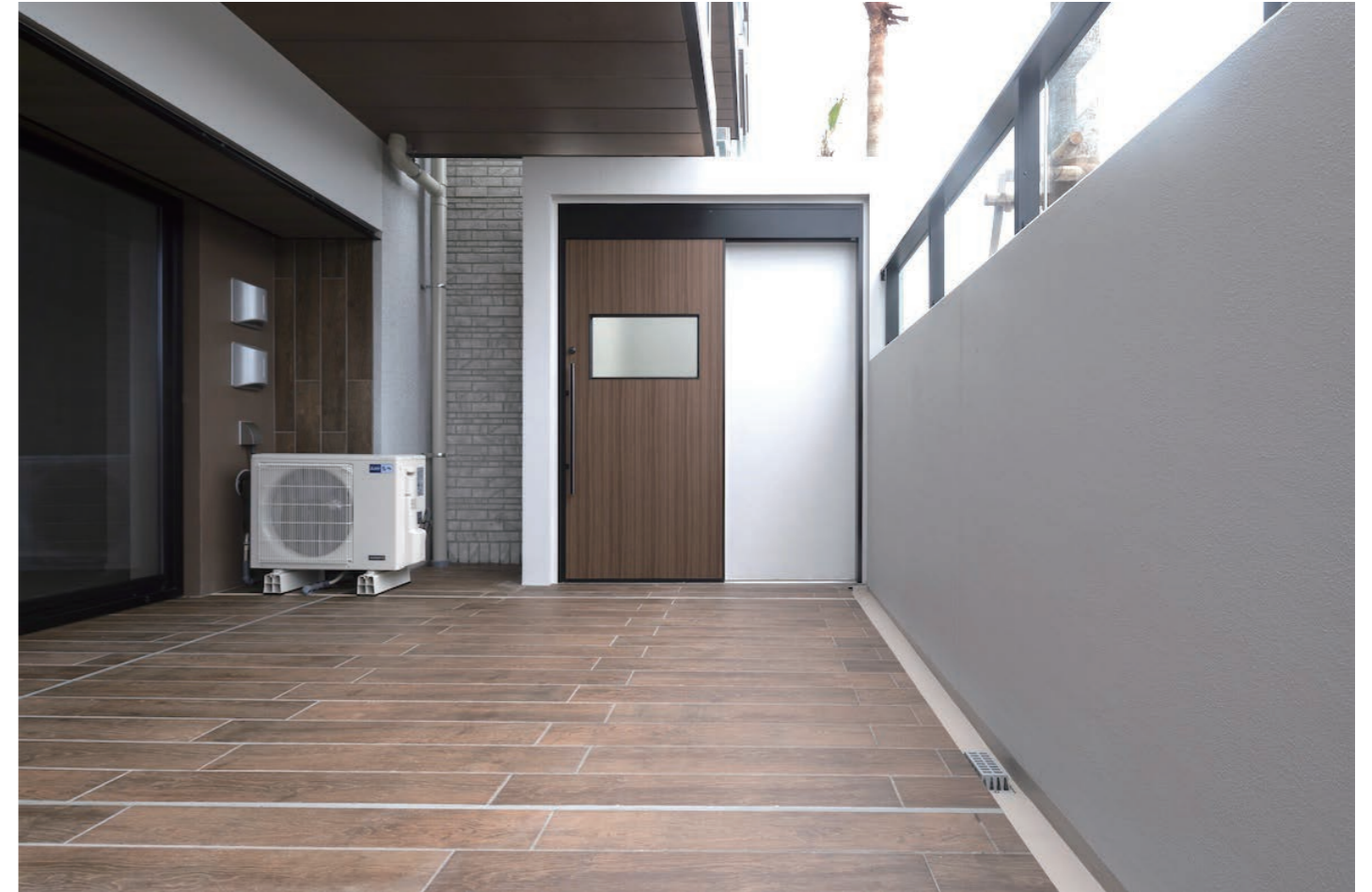
1F 専有部バルコニー 内装床タイル