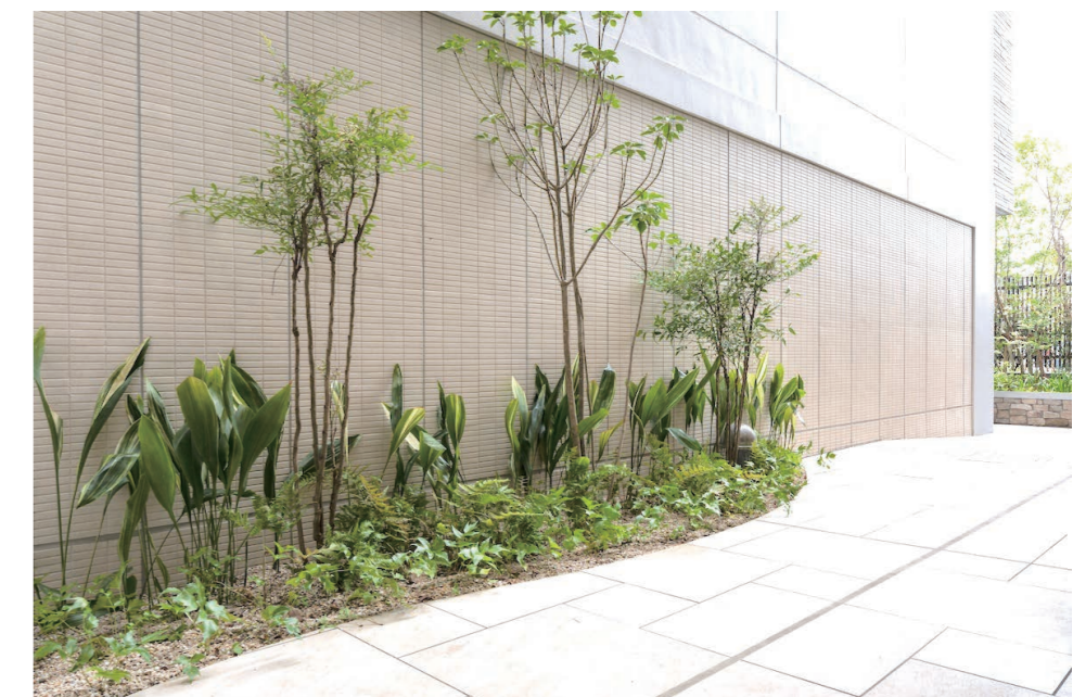
通路スロープ 外装床タイル