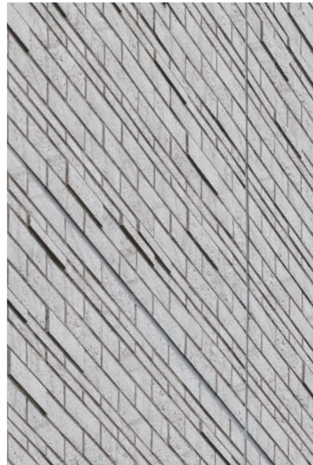
外装壁タイル デイテール