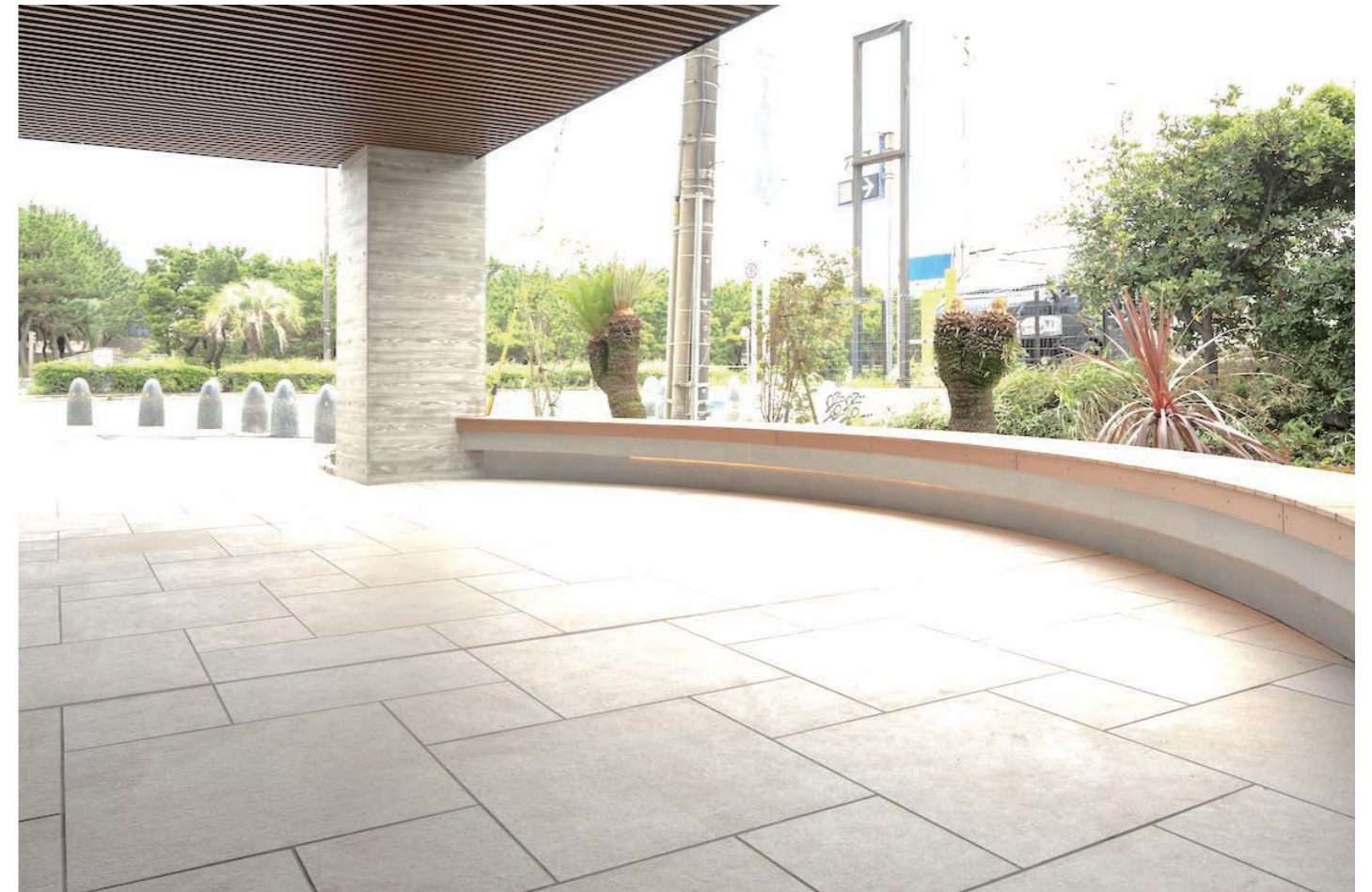
エンストランス 外装床タイル