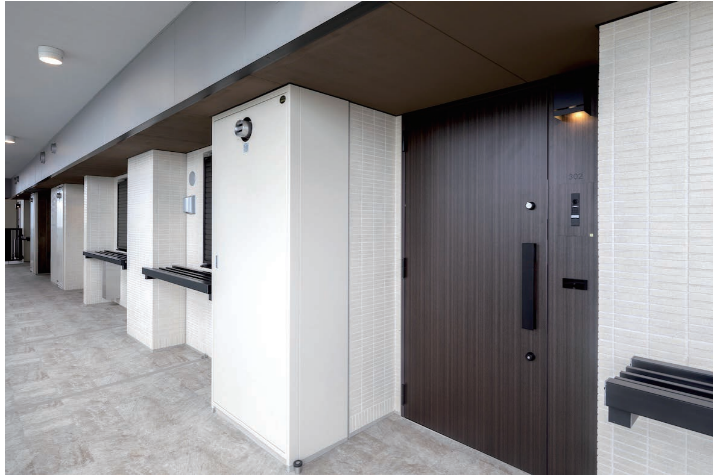
開放廊下 内装壁タイル