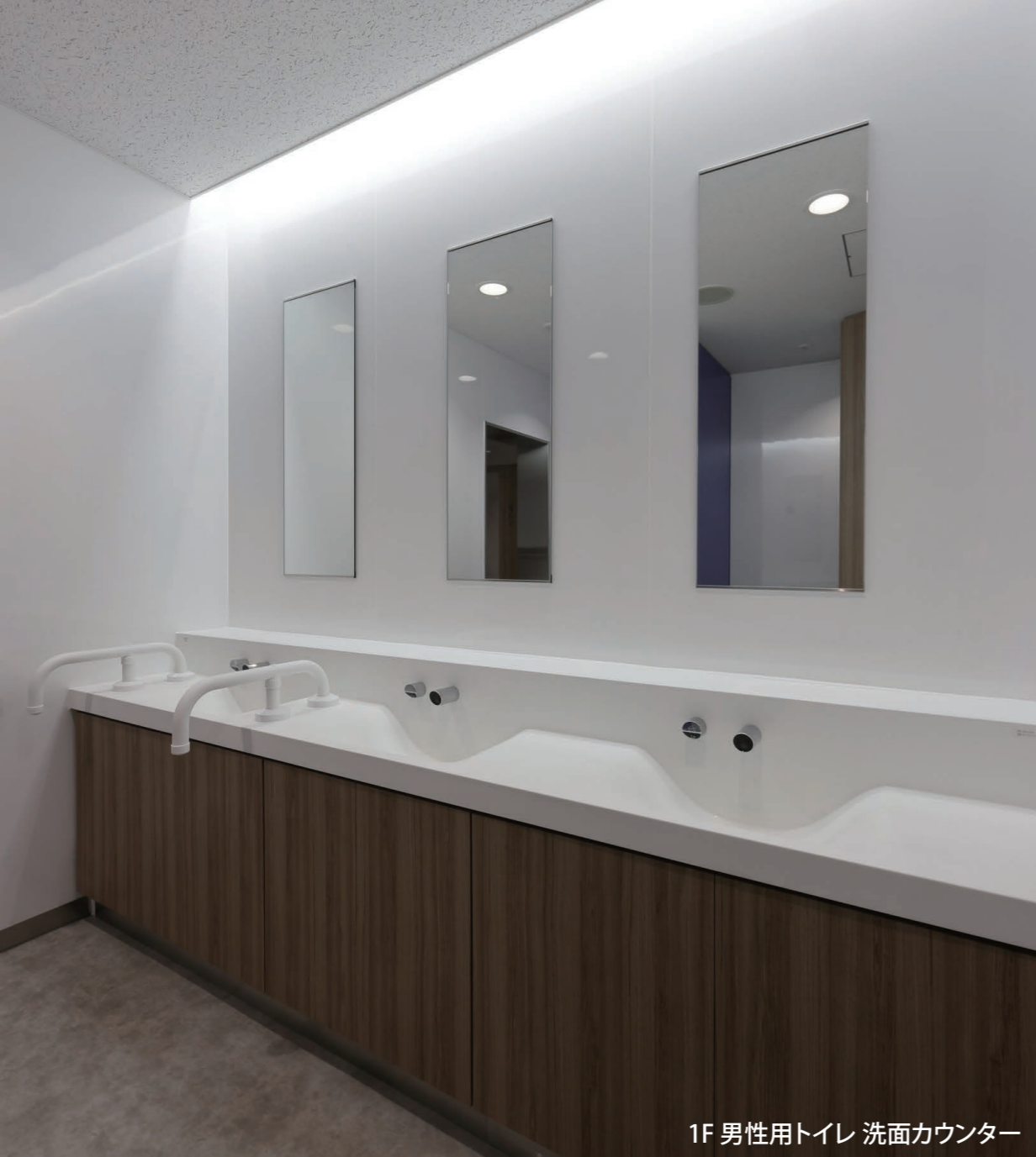
1F 男性用トイレ 洗面カウンター