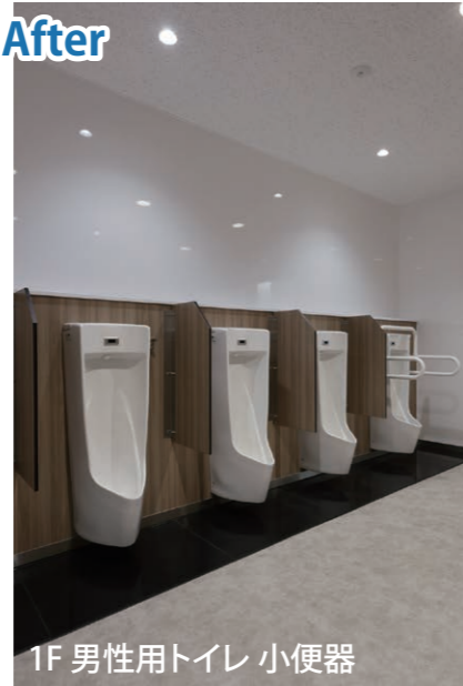
1F 男性用トイレ 小便器