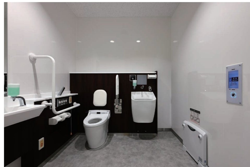
4F バリアフリートイレ