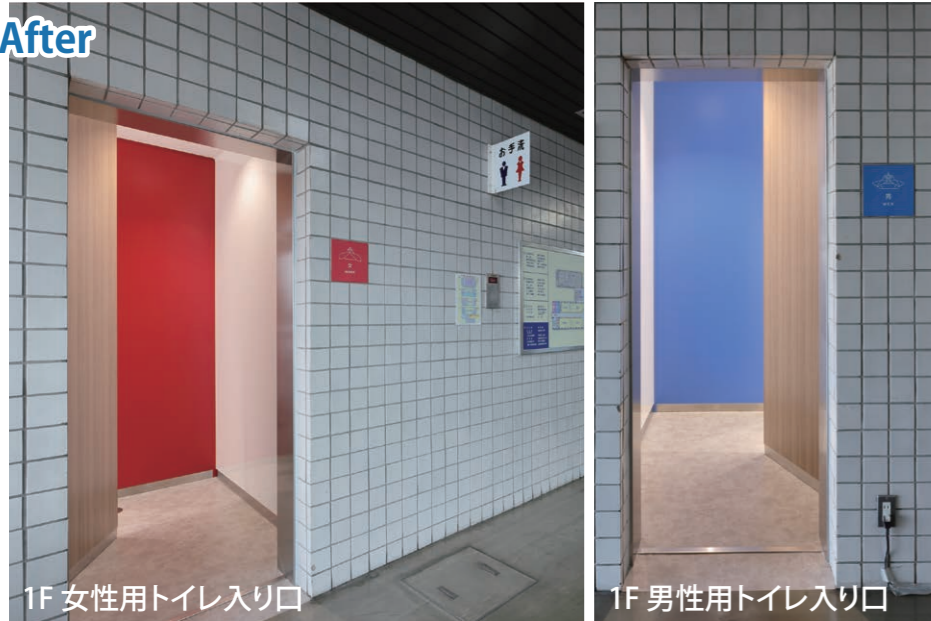
1F 女性用トイレ入り口