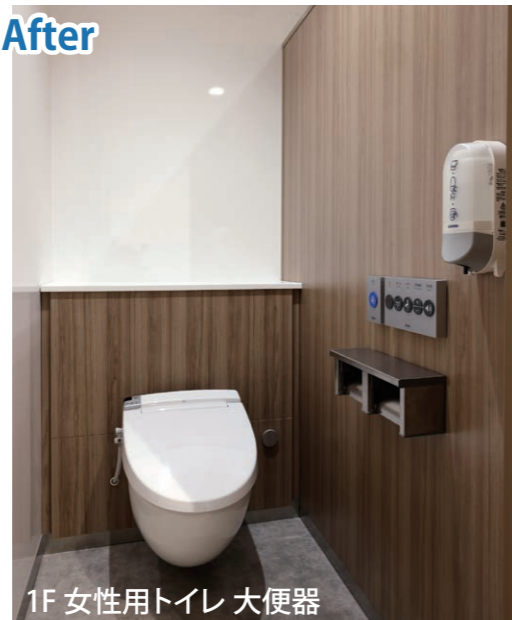
1F 女性用トイレ 大便器

床の乾式化で雑菌の繁殖を抑制。壁掛式の便器は床掃除がしやすく、床を清潔に保つことができる。手すりや幼児用器具を備えた広めブースも設置している。