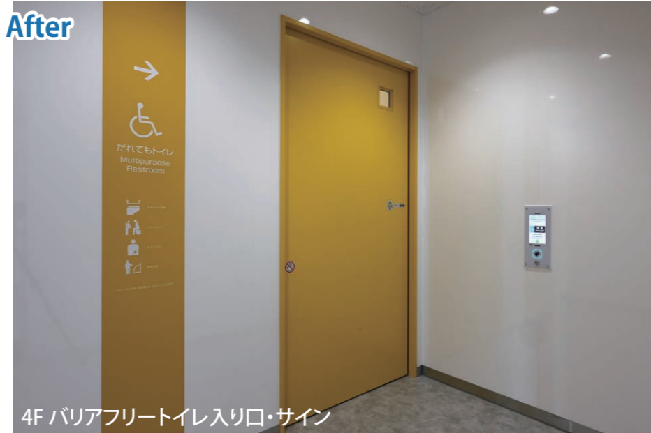
4F バリアフリートイレ入り口・サイン