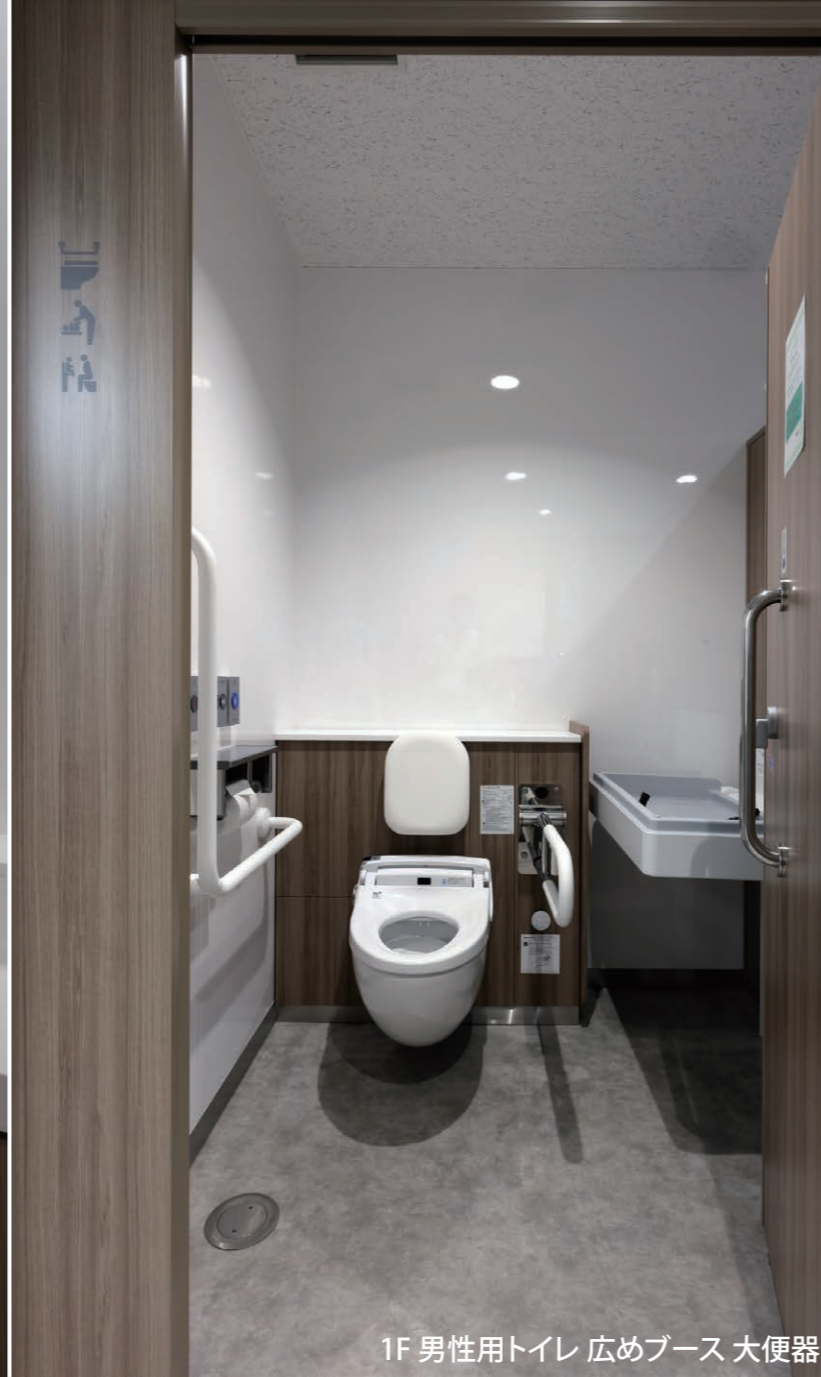
1F 男性用トイレ 広めブース 大便器

「ORIGAMIのまち」上三川町。災害時の対応拠点となる町庁舎が、老朽化に伴う大規模改修でトイレをリニューアル。