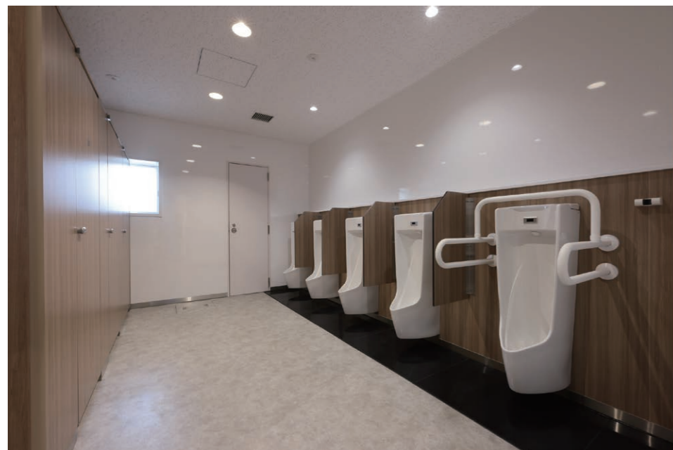
1F 男性用トイレ 小便器

「ORIGAMIのまち」上三川町。災害時の対応拠点となる町庁舎が、老朽化に伴う大規模改修でトイレをリニューアル。