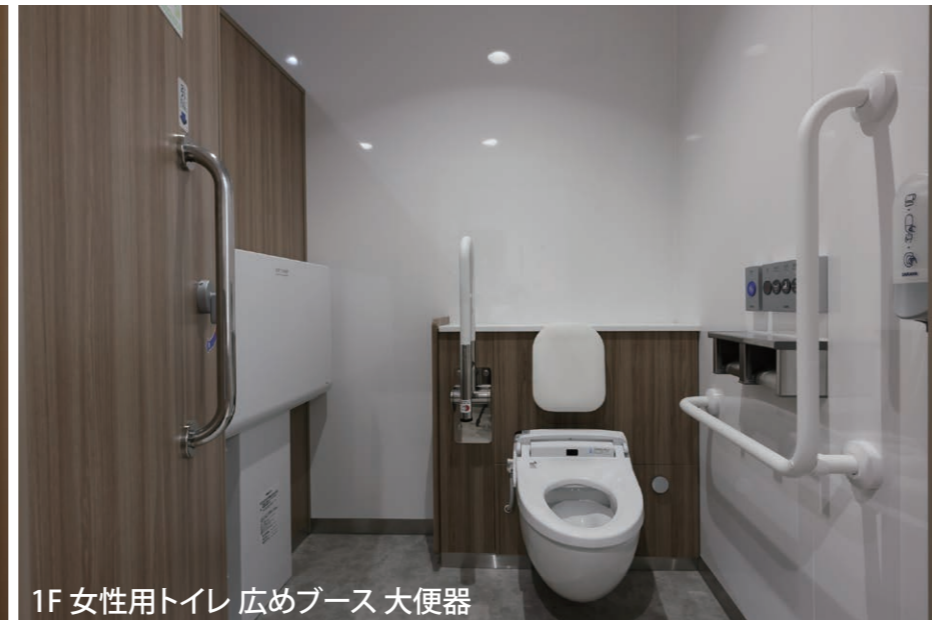
1F 女性用トイレ 広めブース 大便器

床の乾式化で雑菌の繁殖を抑制。壁掛式の便器は床掃除がしやすく、床を清潔に保つことができる。手すりや幼児用器具を備えた広めブースも設置している。