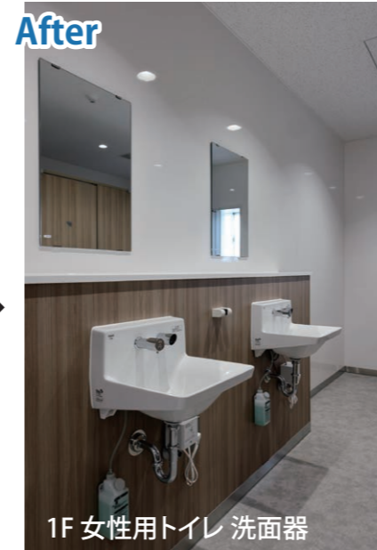
1F 女性用トイレ 洗面器