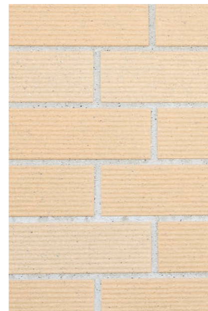
外装壁タイル デティール