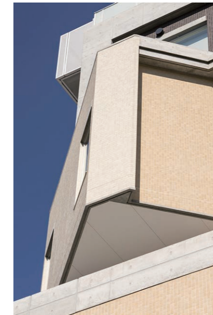
外装壁面 コーナー部