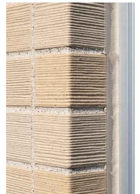
外装壁タイルデティールコーナー部