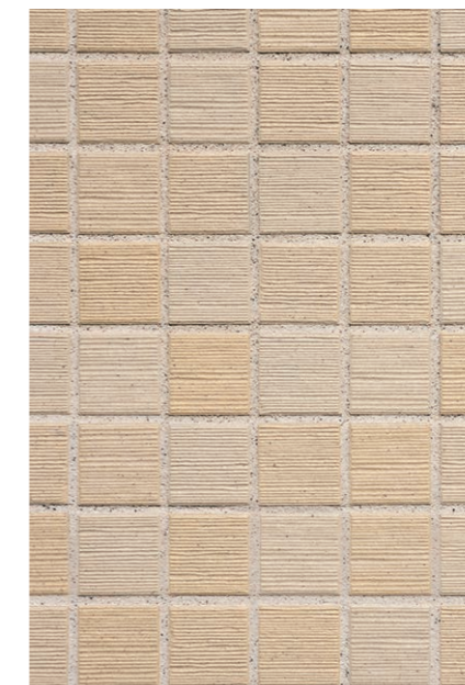
外装壁タイル デティール