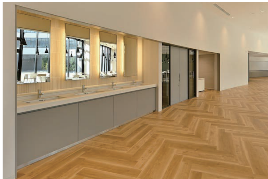
ダイニング 手洗い