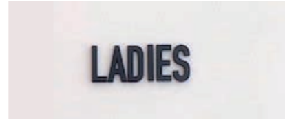
女性用トイレサイン