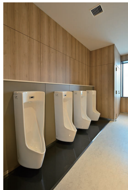
1F 男性用トイレ 小便器

生徒たちが刺激を受け合いながら共同生活を送るボーディングスクールの、自然豊かなランドスケープに囲まれた国際寮。