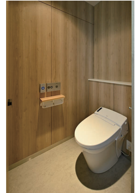
1F 男性用トイレ 大便器