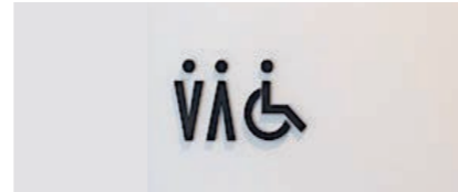
バリアフリートイレサイン