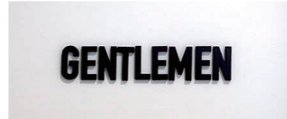
男性用トイレサイン