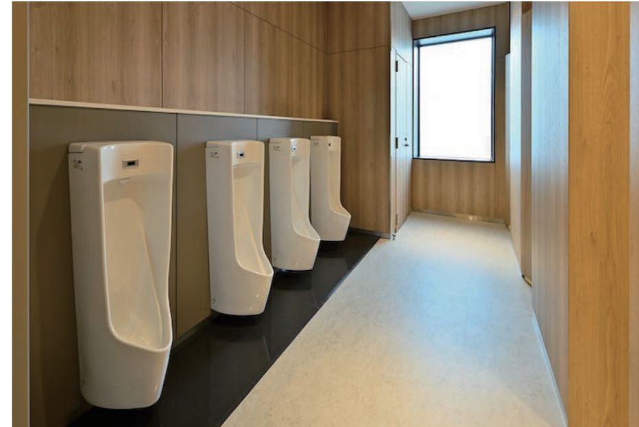
1F 男性用トイレ 小便器