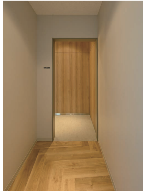
1F 男性用トイレ入り口まわり