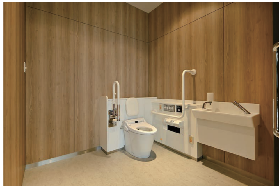
1F バリアフリートイレ