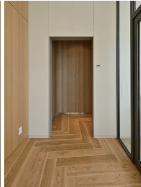
1F 女性用トイレ入り口まわり