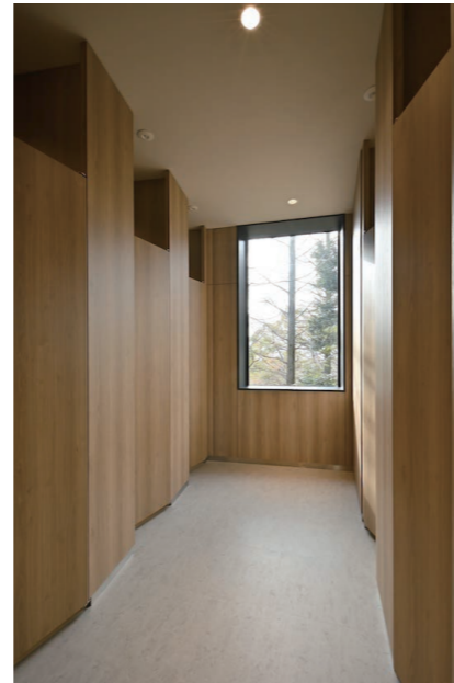
1F 女性用トイレ 大便器ブース