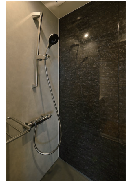
寮室 シャワーユニット