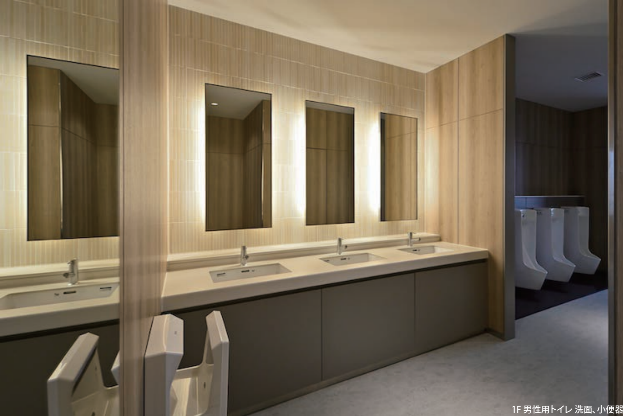
1F 男性用トイレ 洗面、小便器