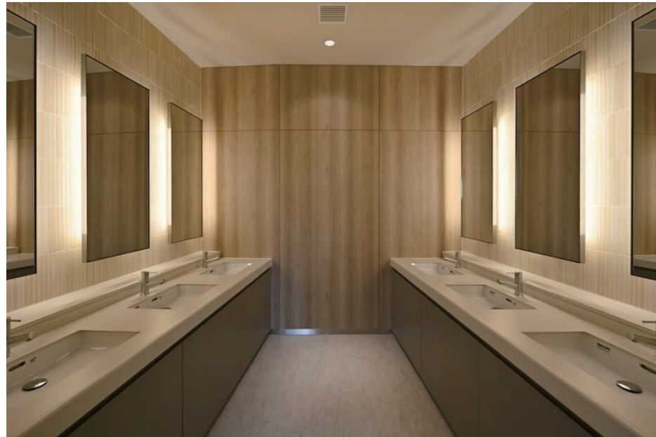
1F 女性用トイレ 洗面