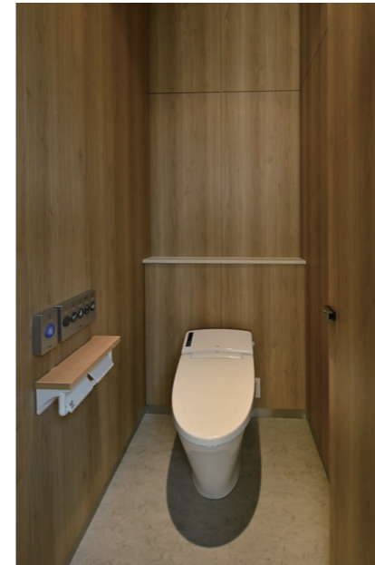
1F 女性用トイレ 大便器