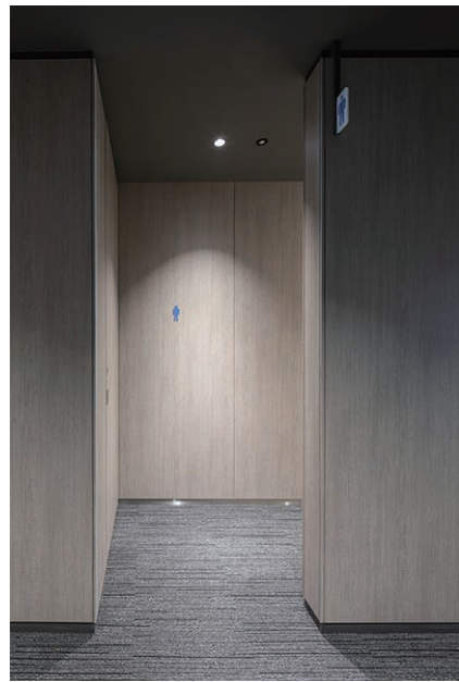
男性用トイレ 入り口