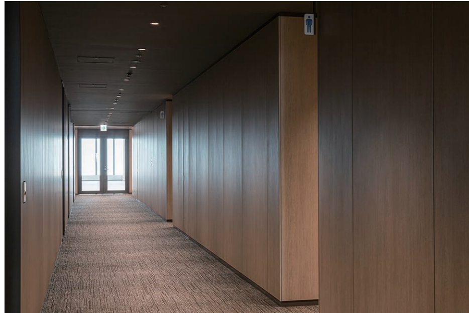
トイレ入り口まわり