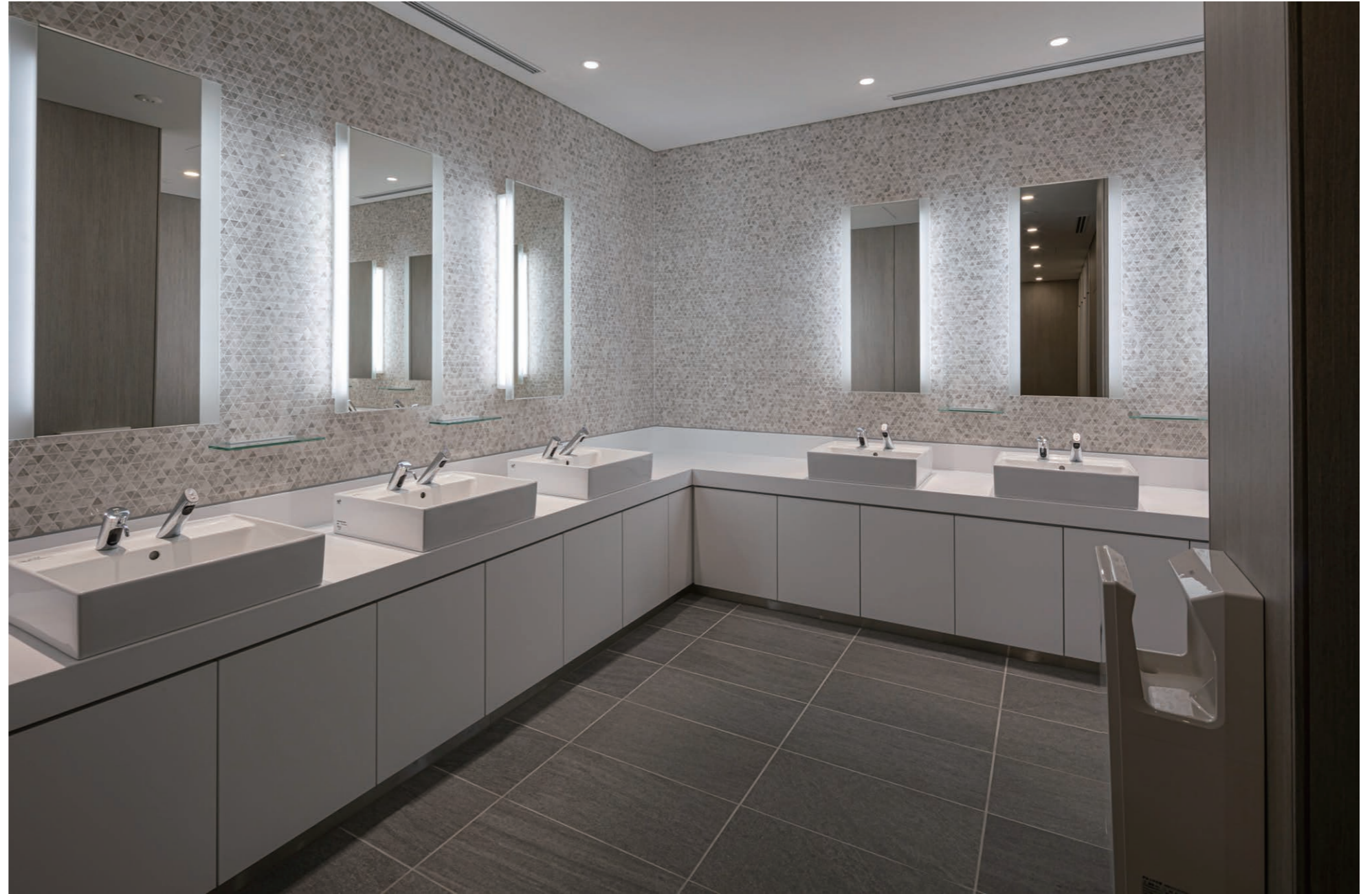
女性用トイレ 洗面