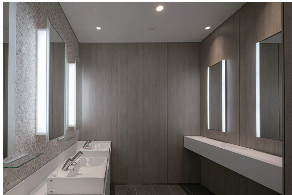
女性用トイレ 洗面・スタイリングコーナー