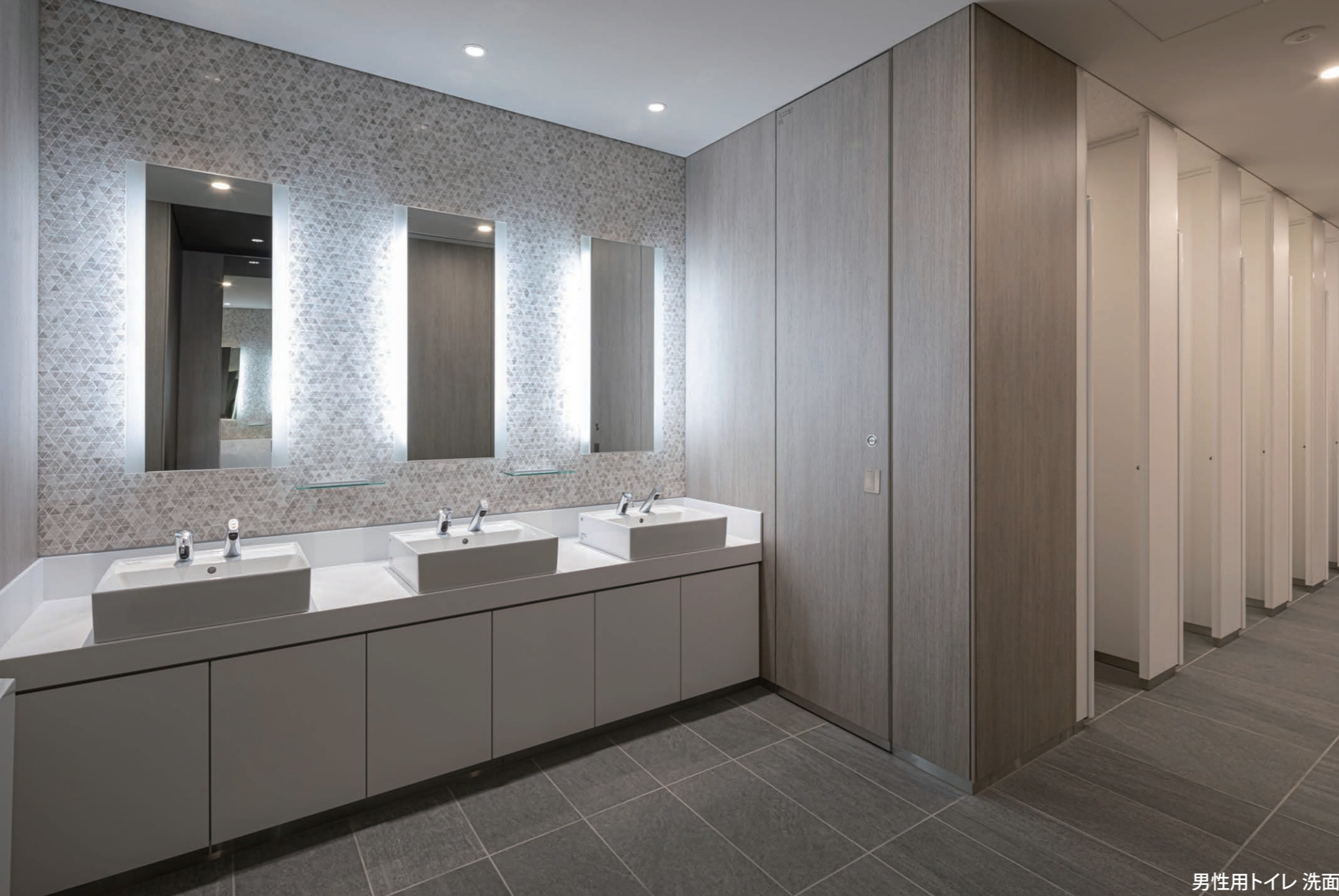
男性用トイレ 洗面

地上64F、地下5F、森JPタワーのオフィスフロア。最新の環境性能や強固なBCP対応を備えている。