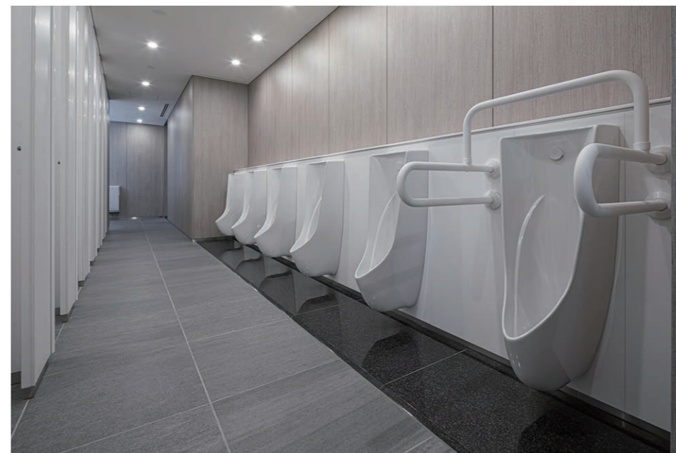
男性用トイレ 小便器