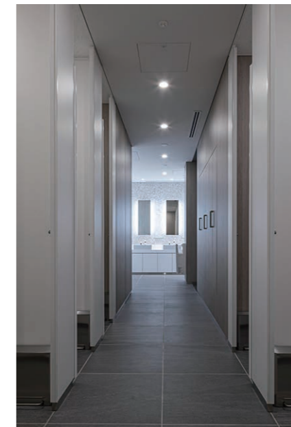
女性用トイレ大便器ブース