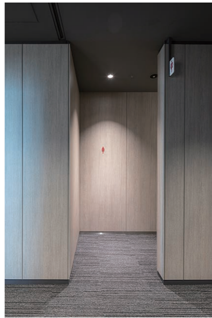
女性用トイレ 入り口