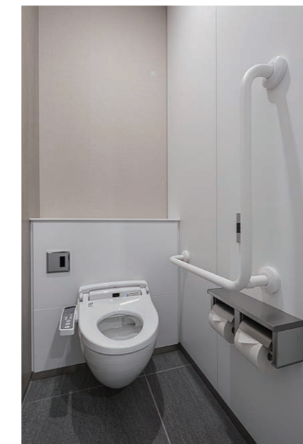
男性用トイレ 大便器