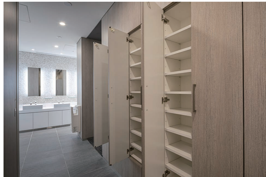
女性用トイレ 小物ロッカー