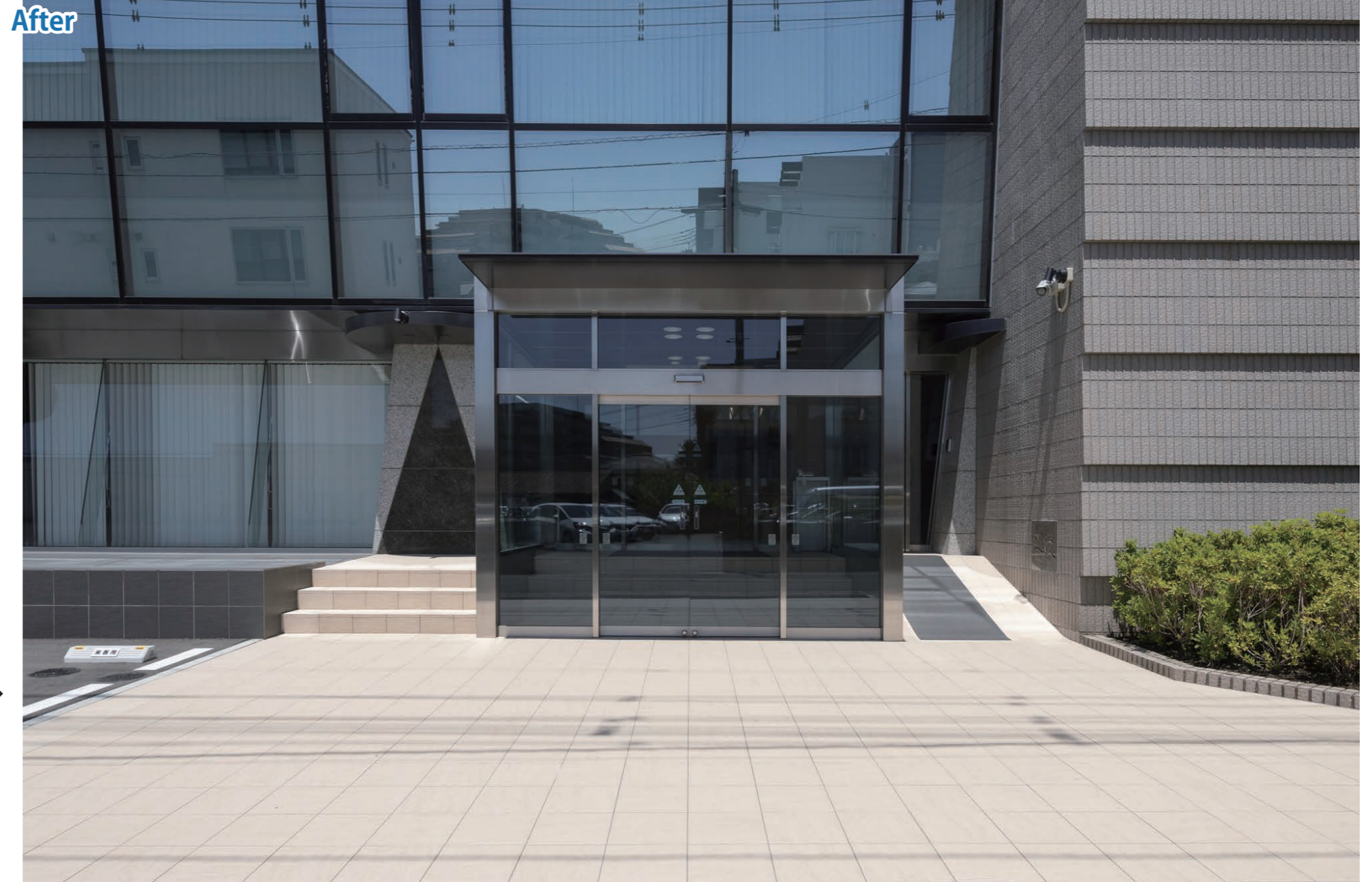
玄関ポーチ 外装床タイル