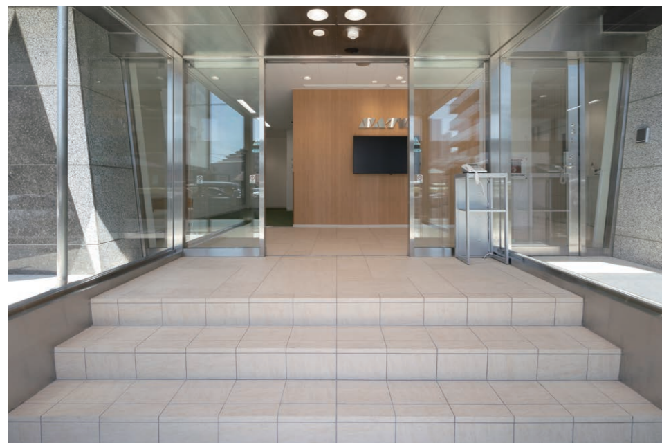
風除室 外装・内装床タイル

現場ごとに最適な課題解決の仕組みを提供する「自動認識ソリューション」の会社の営業拠点がリニューアル。