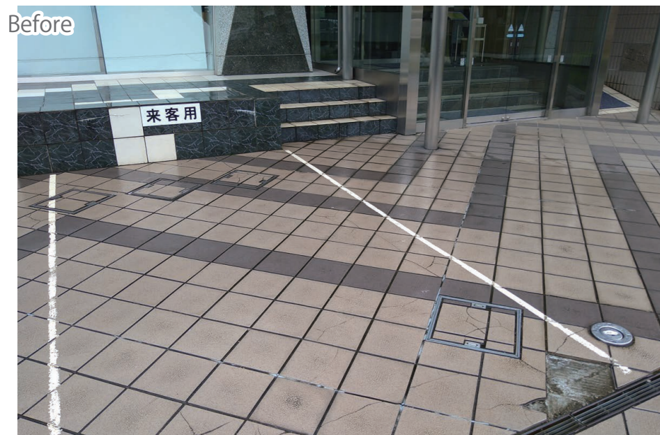
玄関ポーチ・デッキ