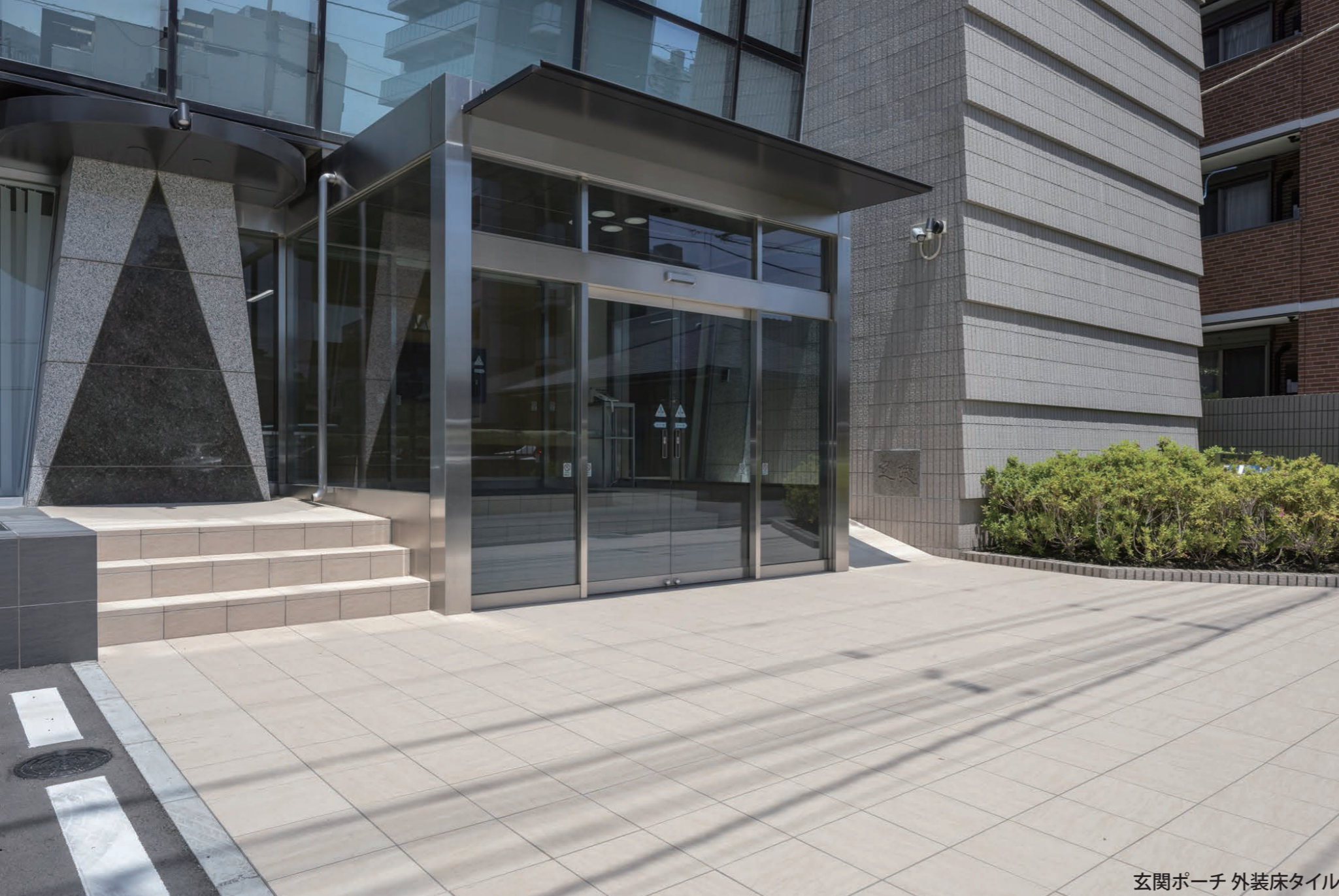
玄関ポーチ 外装床タイル

外装床タイル ストーンエッジⅡ：IPF-600/SEN-3・4、IPF-630/SEN-3・4、 IPF-615/SEN-3・4、IPF-300/SEN-3・4 内装床タイル ストーンエッジⅡ：IPF-600/SEN-3、IPF-630/SEN-3、 IPF-615/SEN-3、IPF-300/SEN-3