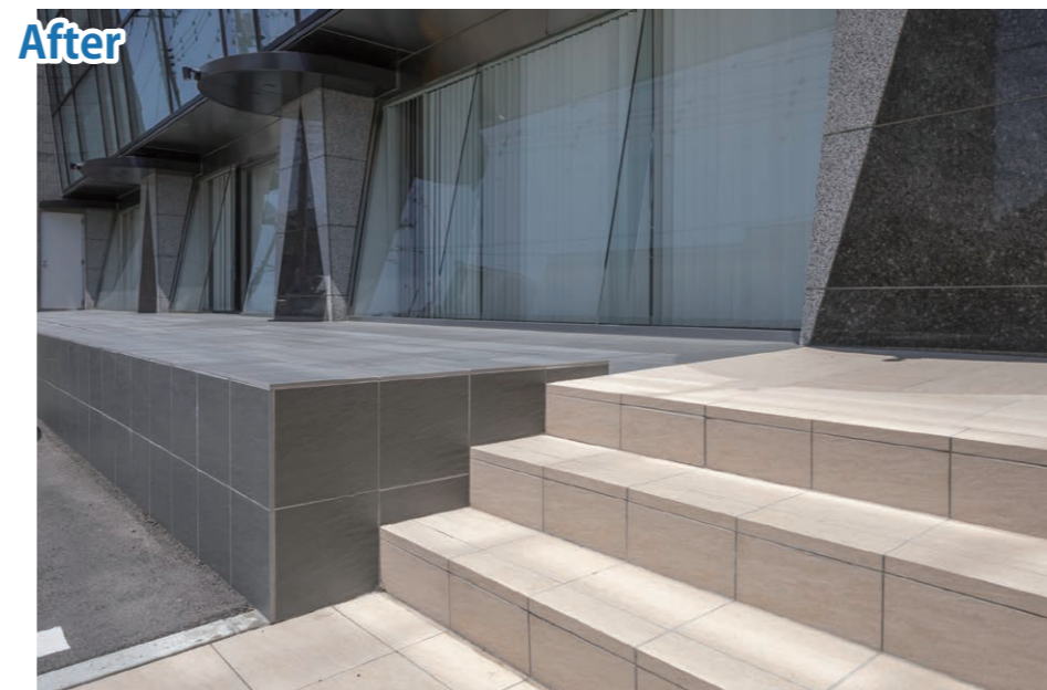
デッキ 外装床タイル