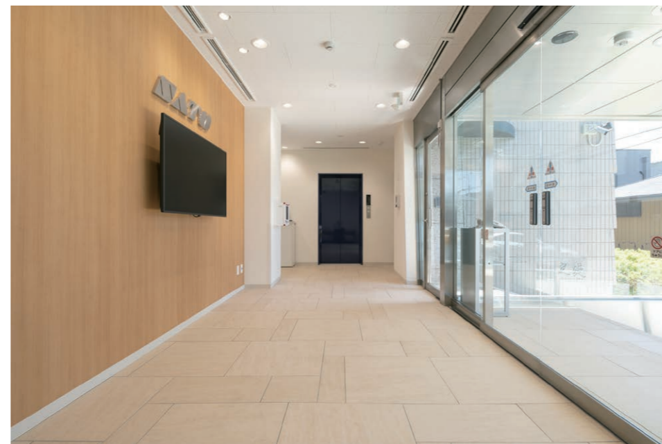
エントランス 内装床タイル