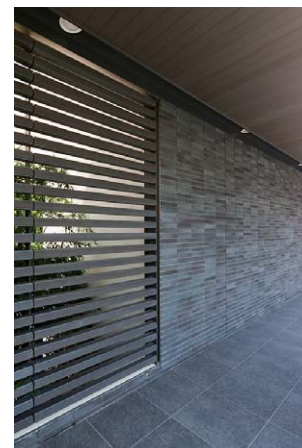
西南側/通路:テラコッタルーバー