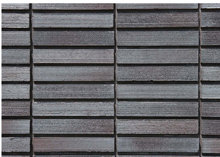
タイルディテール