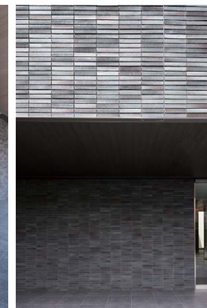
南側/エントランス