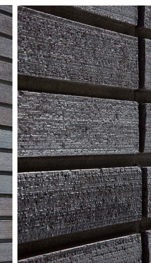
タイルディテール