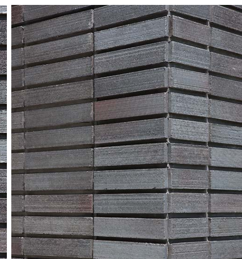
タイルディテール