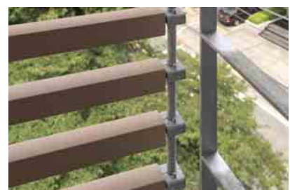
テラコッタルーバーディテールアップ