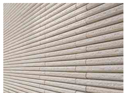
細割ボーダーディテールアップ