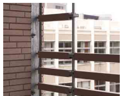
ベランダのテラコッタルーバーディテールアップ