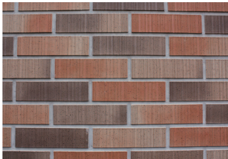
タイルディテールアップ