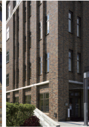
北東側/コーナー部中景