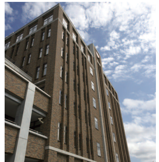
北西側/見上げ全景