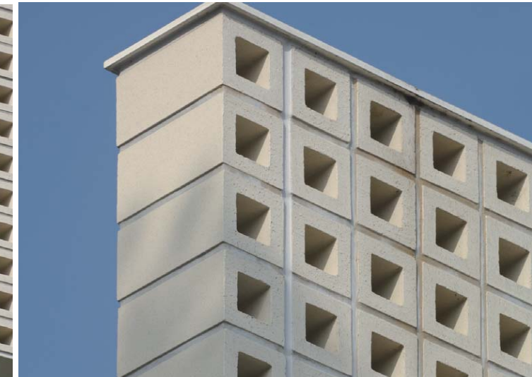
テラコッタブロックディテール