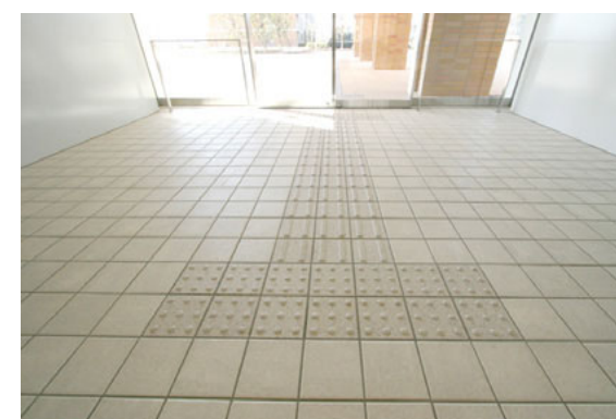
エントランスの視覚障害者用タイル