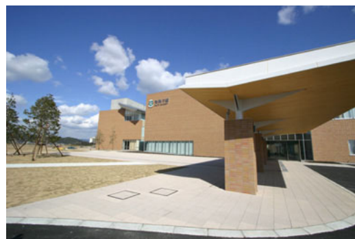
ロータリー歩道部全景