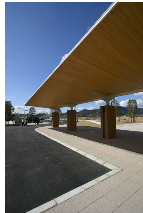
ロータリー歩道部ディテール