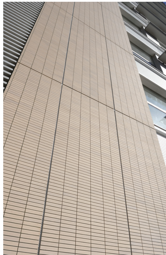
東側見上げディテール