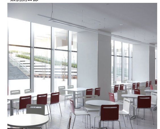
地下1階学生食堂内観