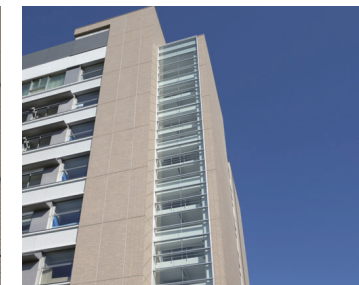
東側コーナー見上げ