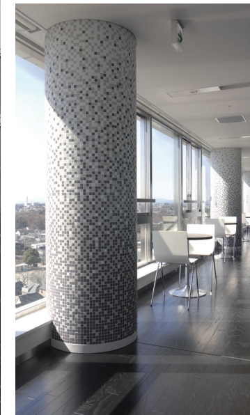
10階スカイラウンジ内観