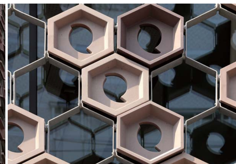
タイルディテールアップ