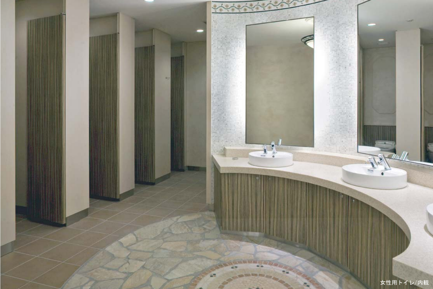
女性用トイレ/内観