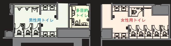
地下1階トイレ 平面図

<一般トイレ> 大便器 :C-22PURC シャワートイレ :CW-P22F-TUC 小便器 :U-406RC 洗面器 :L-848トク 自動水栓 :AM-91K(100V) <多目的トイレ> シャワートイレ :CW-E55-CK 手洗器 :AWL-71AH(P) 洗面器 :L-275L 自動水栓 :AM-121C(100V) 汚物流し :S-203U