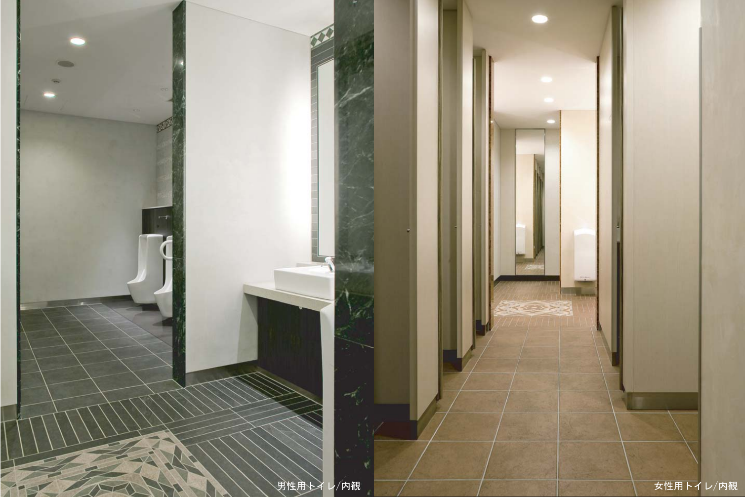
男性用トイレ/内観