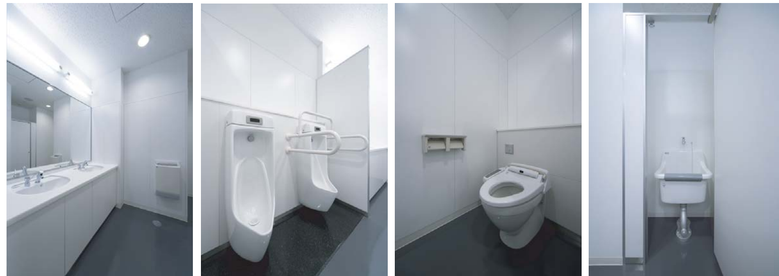
白を基調とした明るいトイレ空間。節水型の機器を採用することで、省エネにも繋がっている。