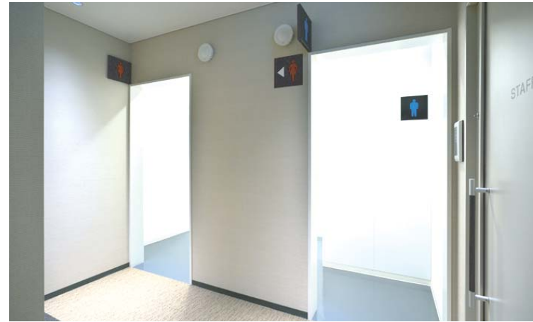
右が男性用トイレ入り口。左が女性用トイレ入り口。