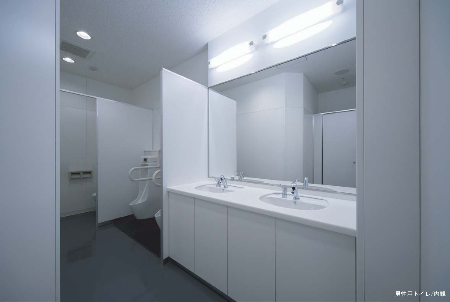
男性用トイレ/内観