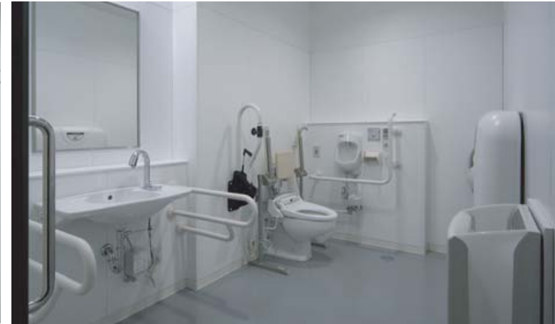
手すりやベビーシートのついた多目的トイレを設置。