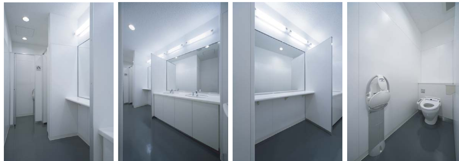
女性用トイレは限られたスペースの中にもパウダーコーナーを確保し、快適性を高めている。また、大便器ブース内は1カ所にベビーキープを設置し、子ども連れの利用者にも配慮している。