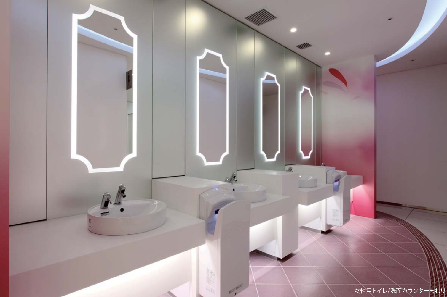
女性用トイレ/洗面カウンターまわり