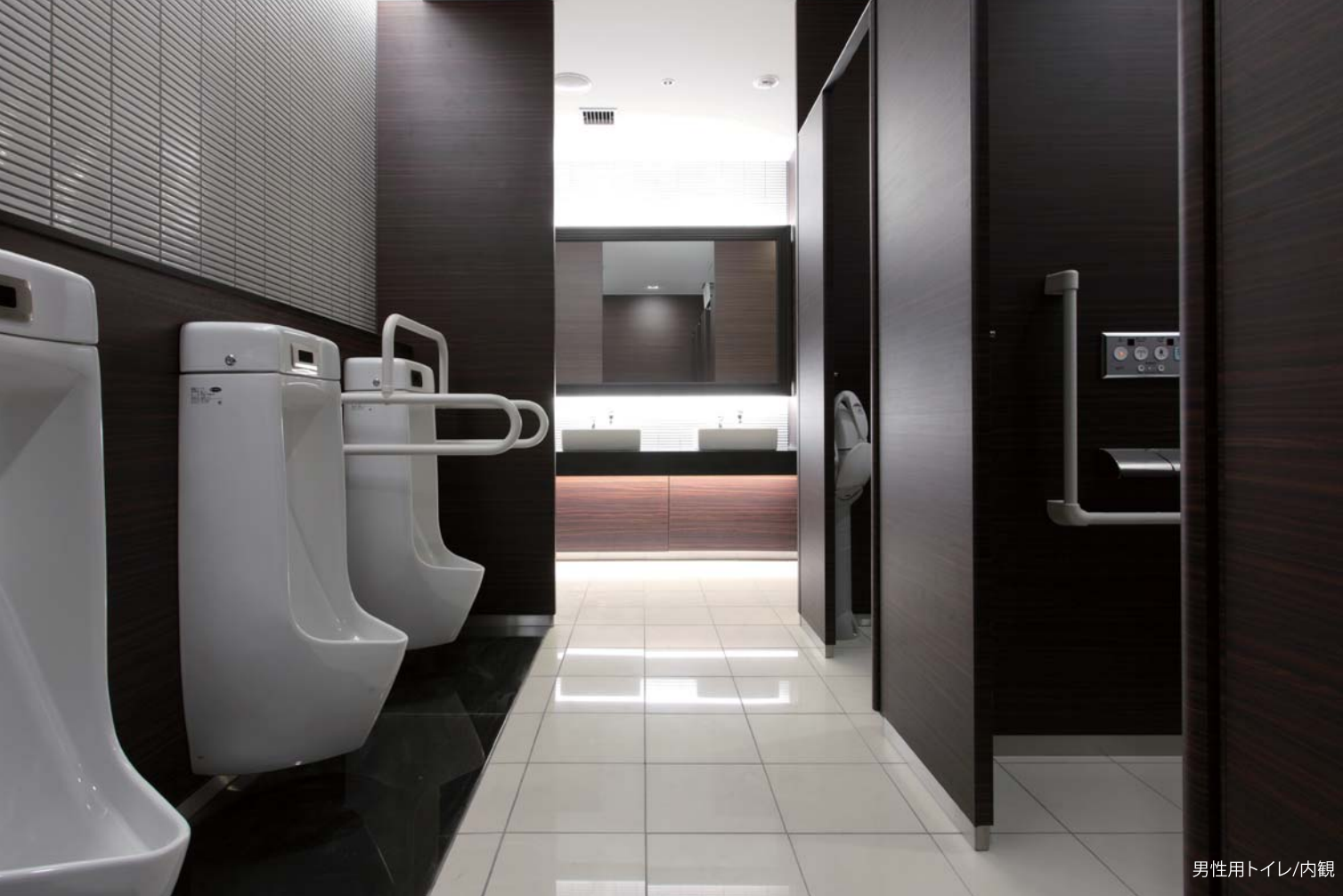
男性用トイレ/内観