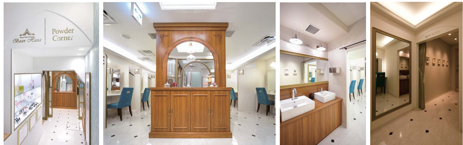
パウダーコーナーは店内の奥に配置し、入口には外部からの視線に配慮してパーテーション代わりの家具を設置。姿見の奥にある洗面・トイレスペースの入口はプライベート感を演出してカーテンを設置