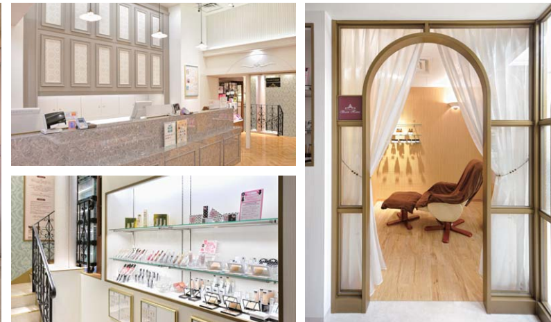
マッサージサロンも併設されている