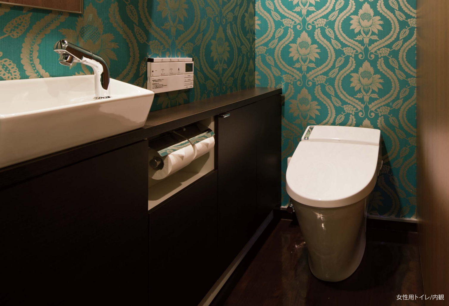
女性用トイレ/内観