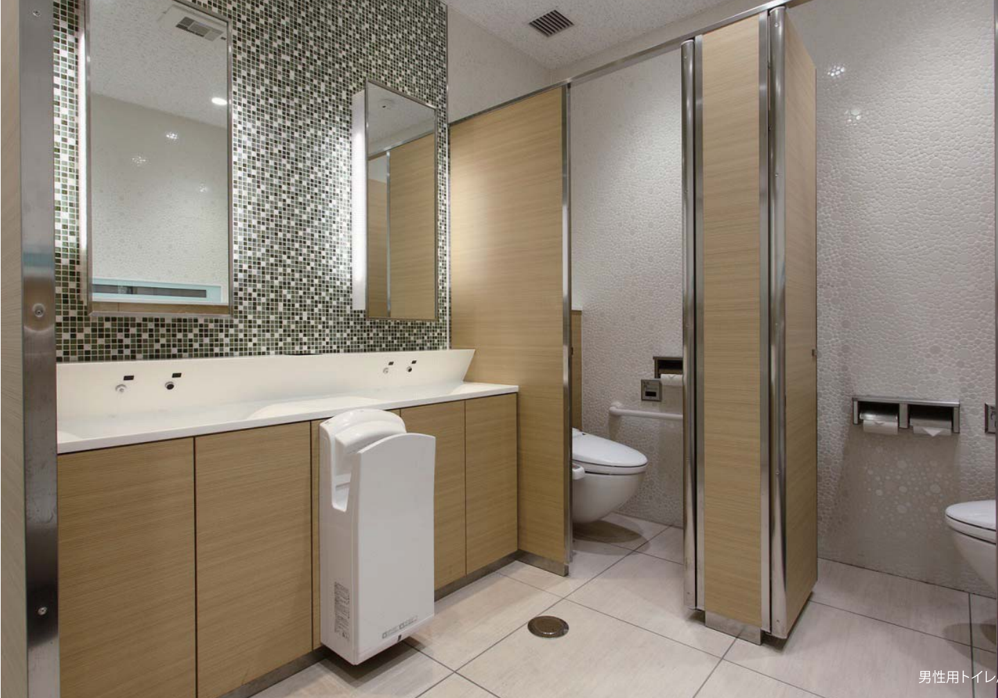
男性用トイレ/内観