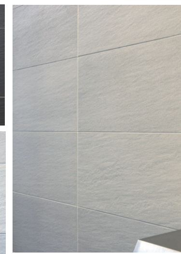
タイルディテール(左側面側)