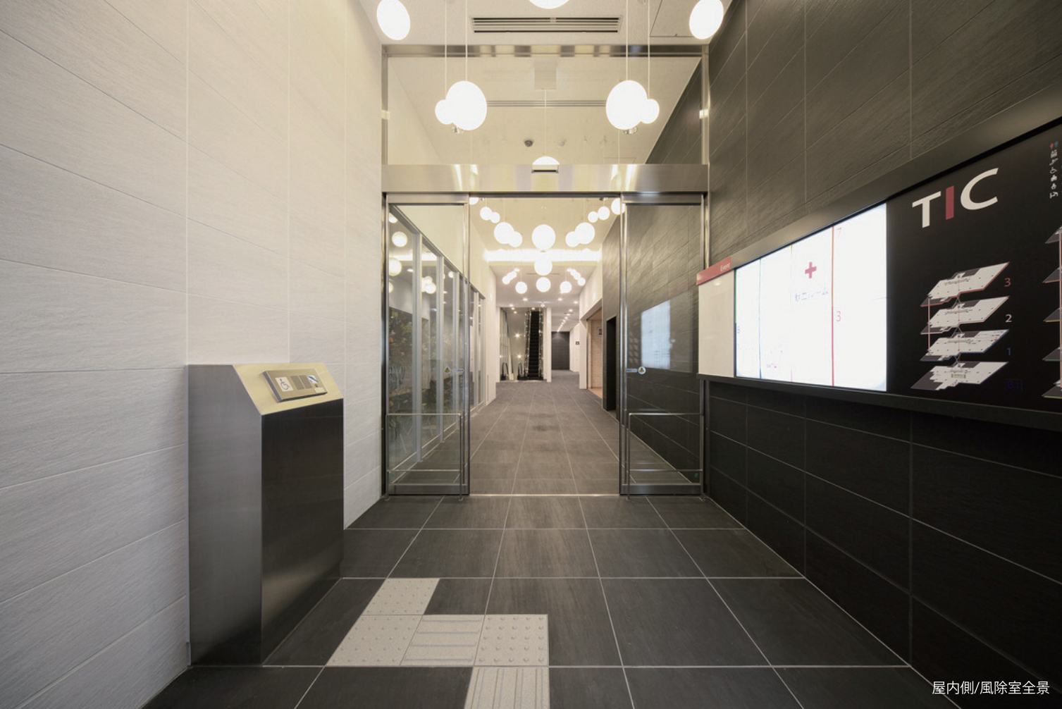
屋内側/風除室全景