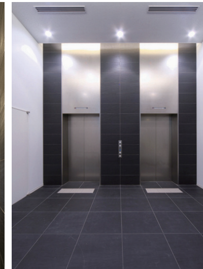
屋内/エレベーターホール全景