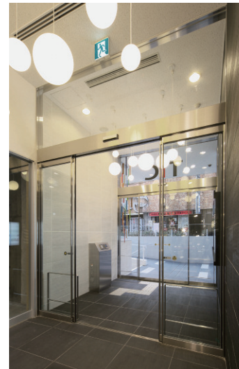
屋内側/エントランス全景(昼間)