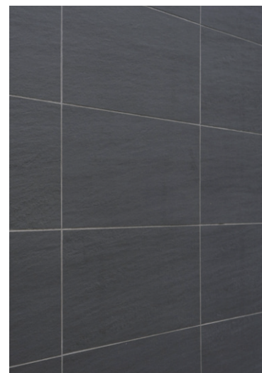
タイルディテール(右側面側)