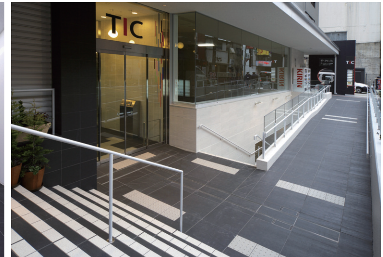
屋外/エントランス横・外構部及び階段側面(昼間)