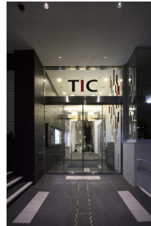
屋外側/エントランス全景(夜間)