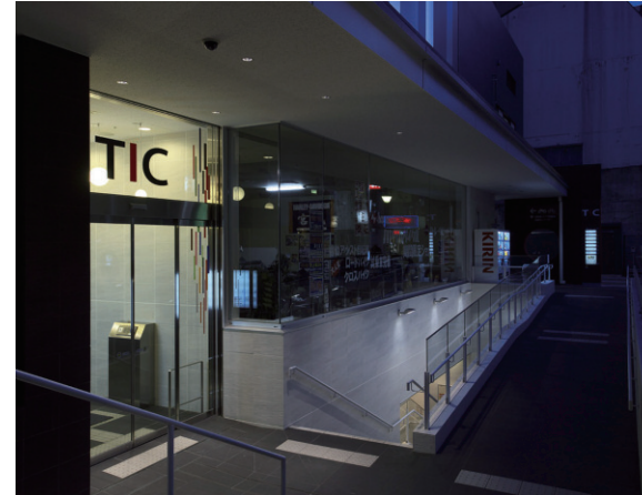
屋外/エントランス横・外構部及び階段側面(夜間)