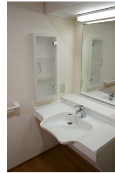
洗面カウンターまわり