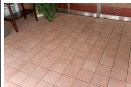
タイルディテールアップ