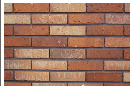
タイルディテールアップ