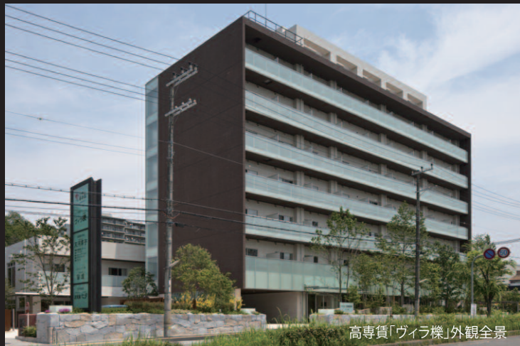
高専賃「ヴィラ櫟」外観全景

内部空間の使用部位に応じてタイルを選定して使用しています。浴室内装タイルは敷き瓦をイメージした、和風テイストの外装床タイルを、あえて内壁にランダムに配置し、隣接する脱衣室の内壁には凸凹のある、調湿機能を持つ健康建材エコカラットを使用しています。共用部のエントランスから居室に繋がる通路の内壁にはライムストーン調の大形建材アガトスを使用しています。エレベーターホールについても一部モザイクタイルを採用しています。