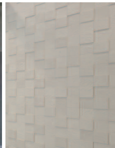
内壁タイルディテール