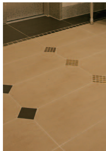
内床ポイントタイルディテール