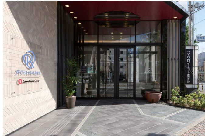
北側/エントランス