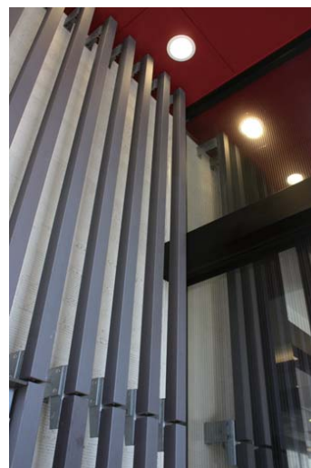
テラコッタルーバーディテール