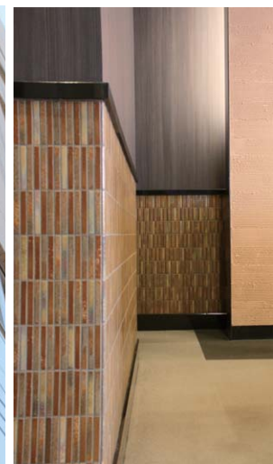
タイルディテールアップ