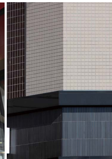
タイルディテール