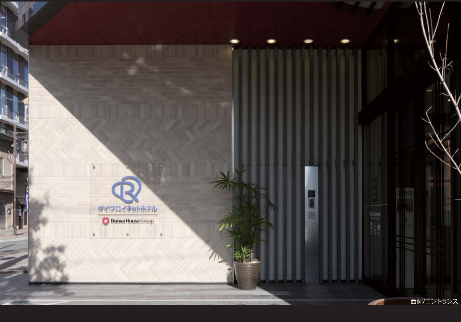
西側/エントランス