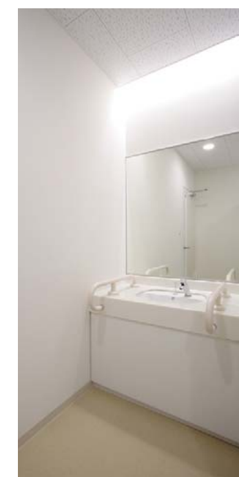
洗面カウンターまわり