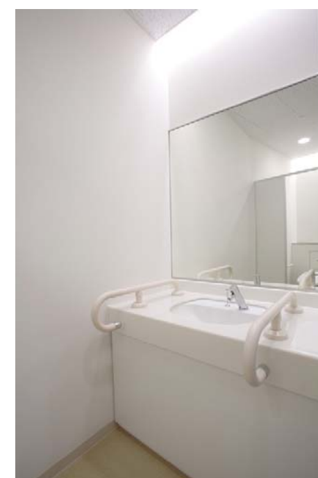
洗面器カウンターまわり