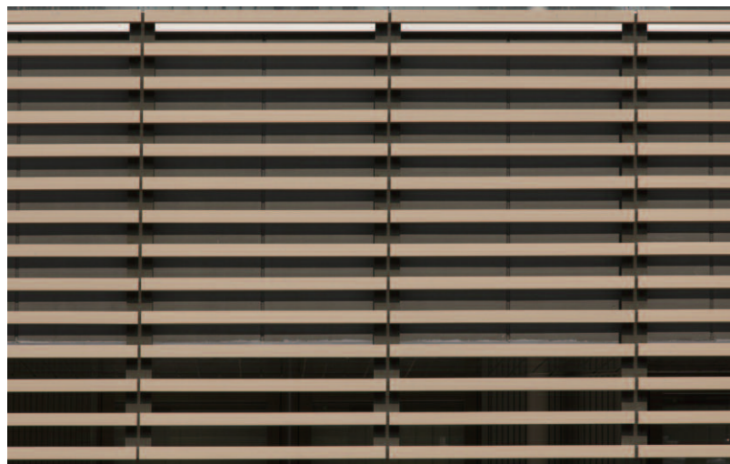
テラコッタルーバーディテール