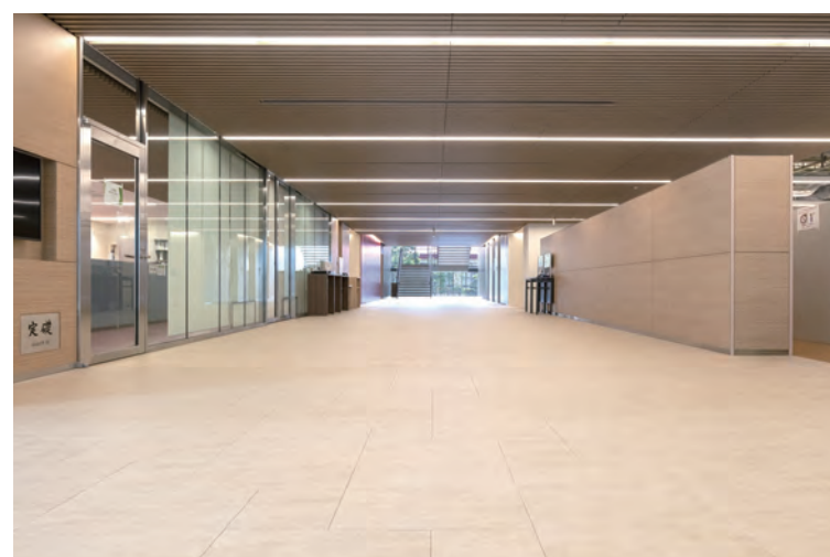
1F エントランスロビー床