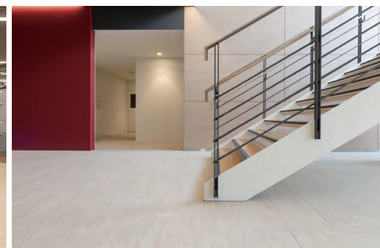
1F エントランスロビー床