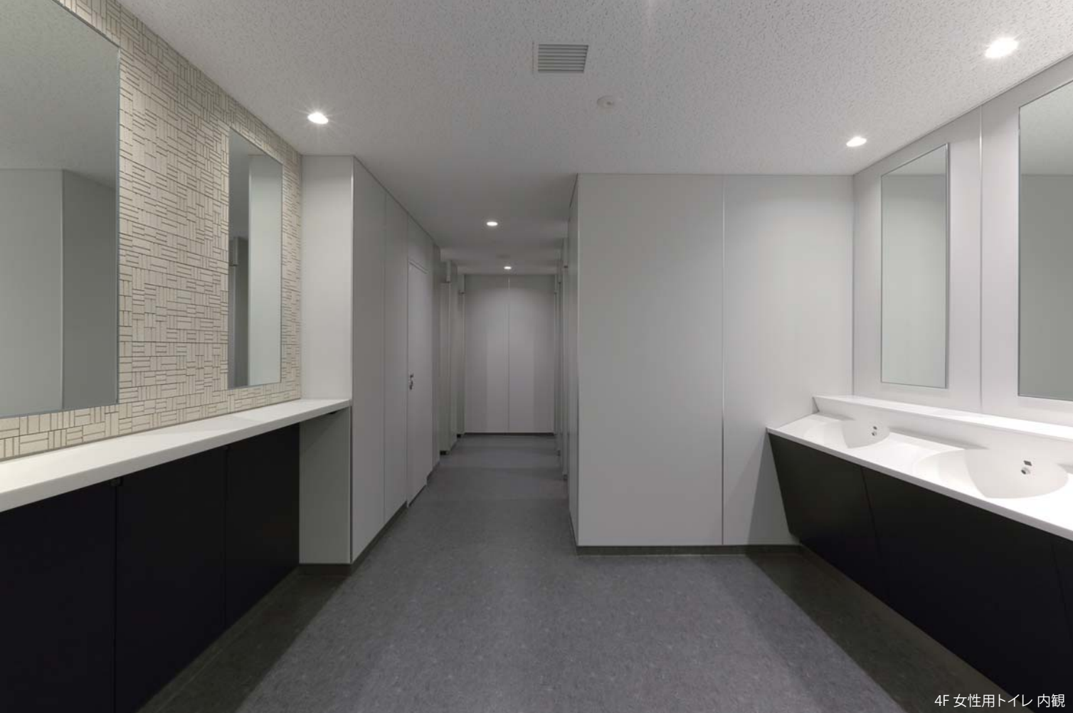
4F 女性用トイレ 内観