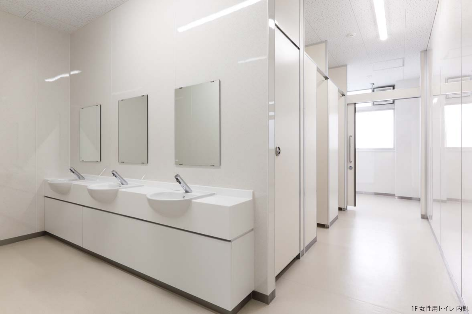
1F 女性用トイレ 内観