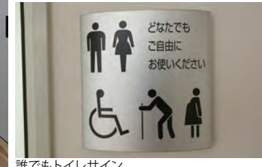
誰でもトイレサイン

特別支援学級前には誰でもトイレとシャワー室を設置。トイレサインには「どなたでもご自由にお使いください」というコメントと共に様々なピクトサインを表示。