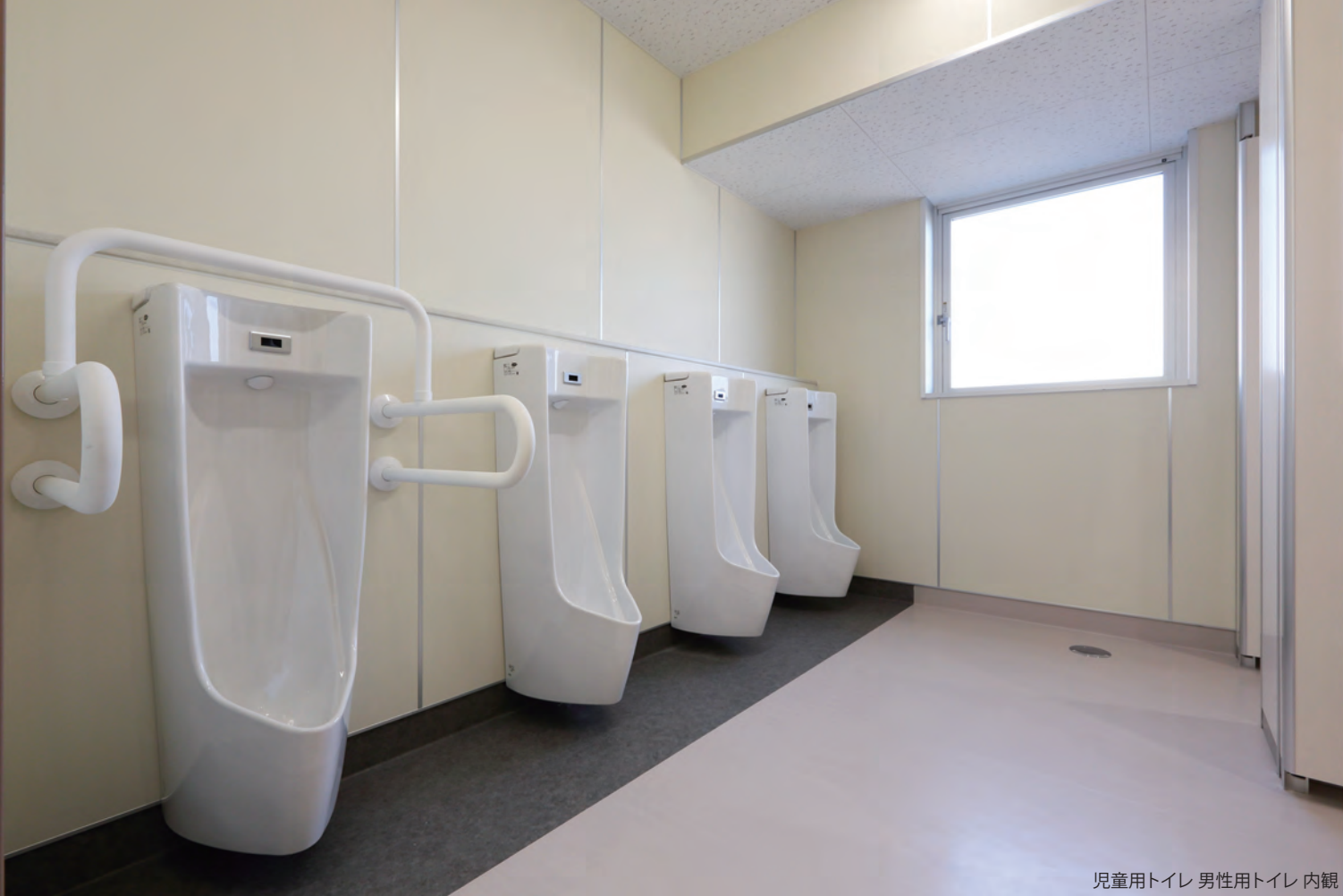
児童用トイレ 男性用トイレ 内観