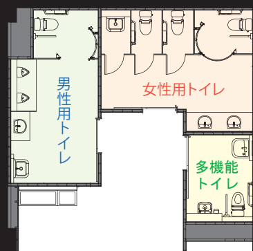
玄関ホールエリアトイレ 平面図

掲載内容及び写真・図版の無断転載はかたくお断りします。(許可なく転載・流用した場合、損害賠償が発生します。)