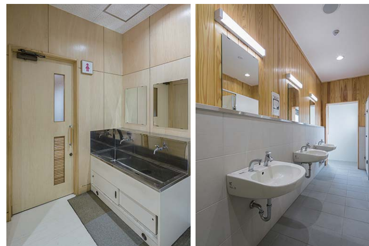
体育館 女性用トイレ

保健室内には多様な児童のケースに考慮しシャワーユニットを設置。必要時には全身シャワーで身体を洗うことができる。