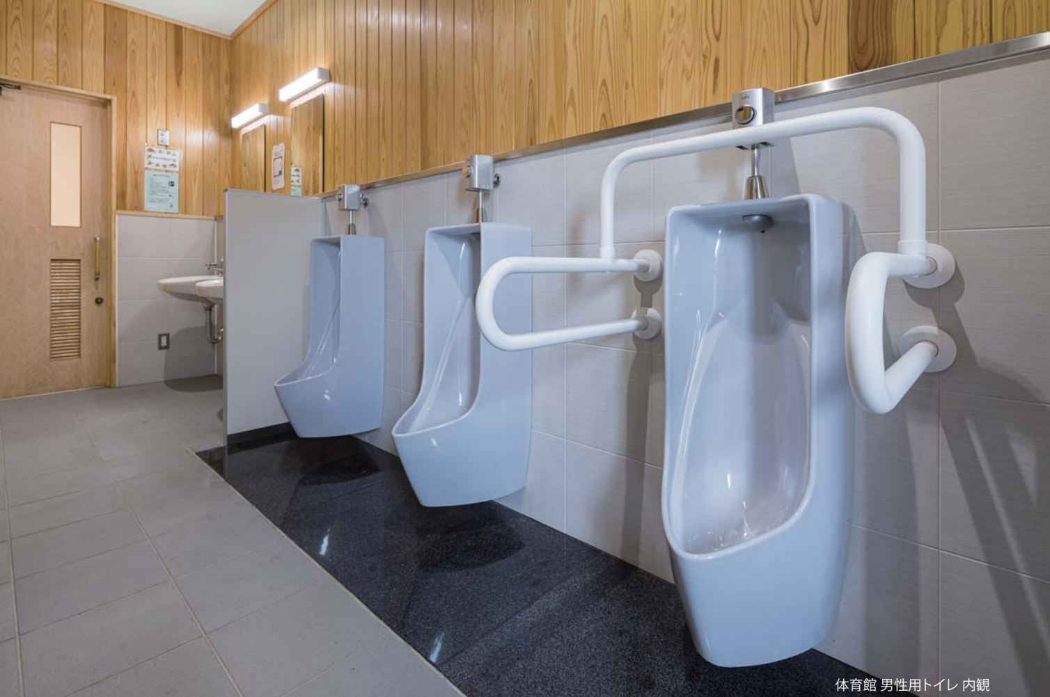
体育館 男性用トイレ 内観