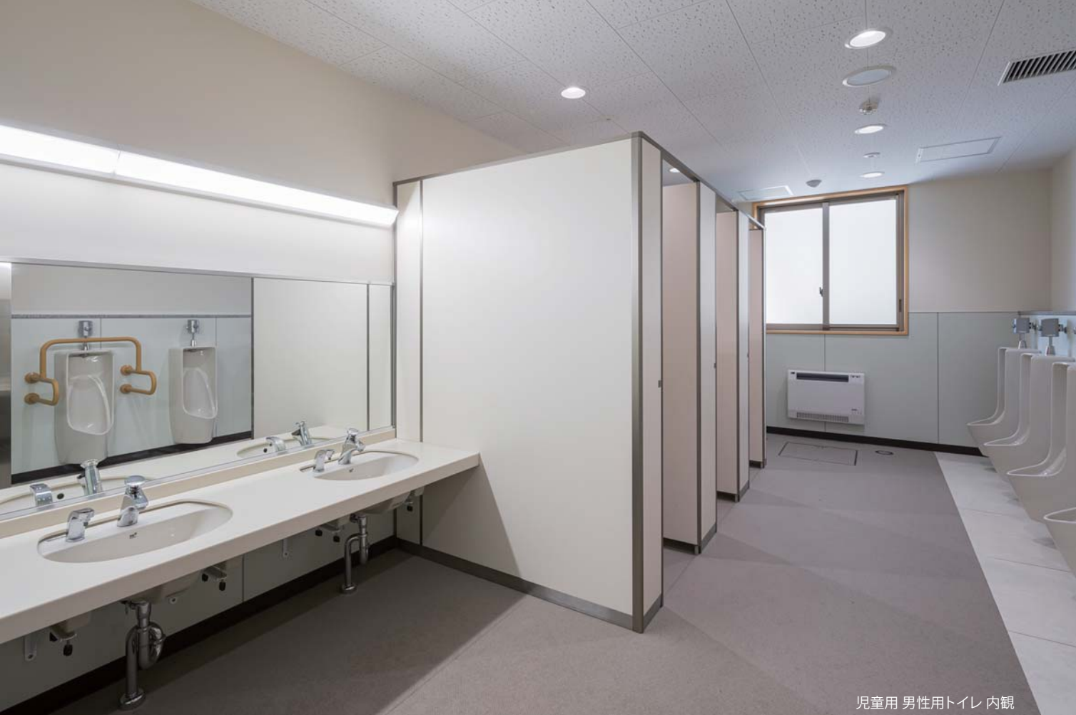
児童用 男性用トイレ 内観