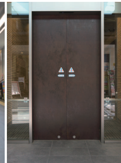
レジデンスエントランス扉