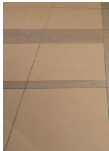
商業施設内装床面タイルディテール