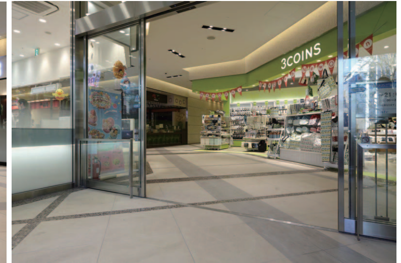
商業施設1F南側エントランス