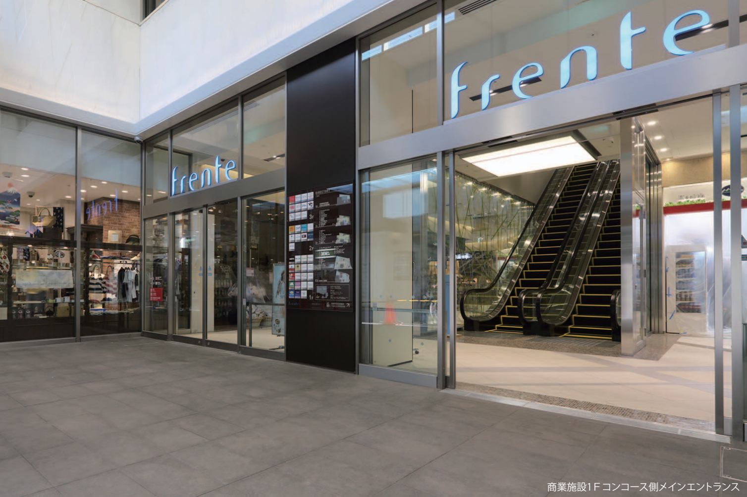
商業施設1Fコンコース側メインエントランス