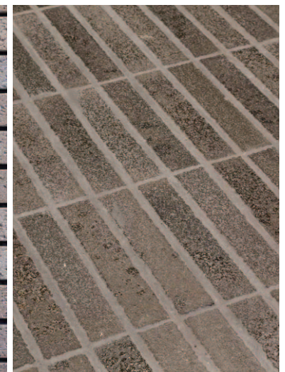
レジデンス内装床面タイルディテール