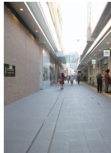
駅コンコース側外装壁・外構床