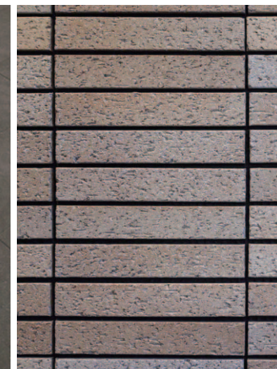
外装・内装壁面タイルディテール