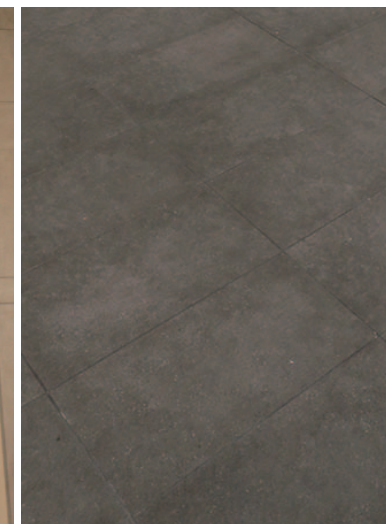
外構・エントランス床面タイルディテール