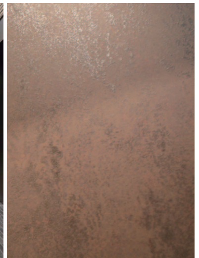
レジデンスエントランス扉面ディテール