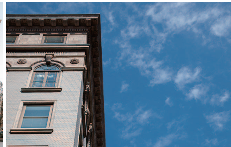
コーナー外装壁面