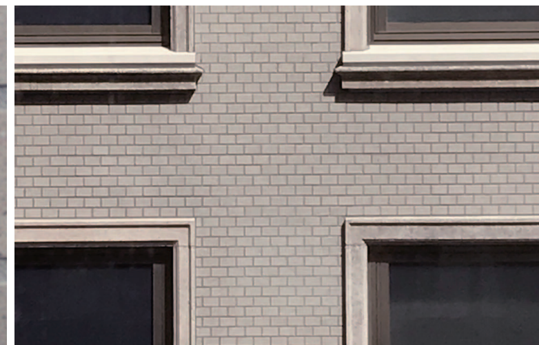
外装壁面ディテール